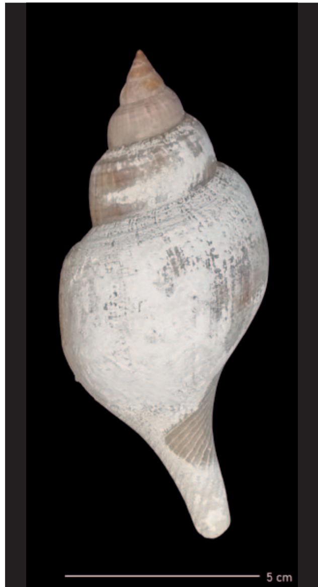
Sl. 2 Primjer Byneove bolesti ljuštura puža Fasciolaria tulipa (Linnaeus, 1758) iz Hrvatskog prirodoslovnog muzeja (dimenzije ljuštura: 12 x 5 cm)

Premda i Byneova bolest i piritno propadanje uzrokuju nepovratna oštećenja ljuštura mekušaca, posljedice se mogu ublažiti ili izbjeći prevencijom čuvanjem zbirke u uvjetima niske relativne vlažnosti (45–50 %) i pri odgovarajućoj temperaturi (16–21 °C). Preporučeno je korištenje čeličnih ladica i ormara s elektrostatskim premazom, dok uzorci koji sadrže pirit trebaju biti pohranjeni u plastične posude ili zatvorene staklene posude. Oštećeni primjerci moraju odmah biti uklonjeni iz zbirke i vraćeni tek nakon pravilnog čišćenja. Čišćenje se obavlja oprezno, pomoću vode ili suhim kistom, kako ne bi došlo do