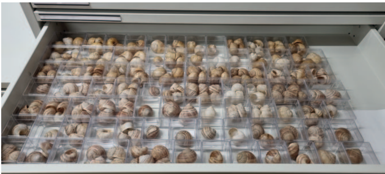
Sl. 1 Primjer pohrane kopnenih puževa u Hrvatskom prirodoslovnom muzeju

Nakon dovršetka čišćenja, slijedeći korak je fizička pohrana ljuštura u kutijice zajedno s etiketama koje sadrže prateće podatke. Postoje različiti načini provođenja ovog postupka. Tako su, primjerice, mekušci iz Hrvatskog prirodoslovnog muzeja u Zagrebu prvotno bili pohranjeni u drvenim ormarima s ladicama zatvorenim staklom na poklopcu, radi jednostavnijeg vizualnog pregleda ali i zaštite od prašine, dok su unutar ladice ljuštura bile pohranjene u metalnim ili kartonskim kutijicama te po potrebi u manjim kutijama ili epruvetama (Štamol, Medaković 1989: 79; Štamol 1998). Štamol i Medaković (1989)