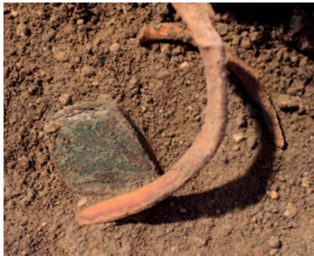
Sl. 1 Brevar in situ među dislociranim rebrima u zapuni groba 66 Fig. 1 Breverl in situ among dislocated ribs in the filling of grave 66

Do sada su u Hrvatskoj objavljeni brevari manjih dimenzija, prosječno između 2 x 2 i 3 x 3 cm (Azinović Bebek, Filipec 2015: 281). Iznimku čine nalazi dva veća, gotovo identična ovalna brevara, jedan pronađen na groblju oko crkve sv. Nikole biskupa u Žumberku (Stingl 2017: 51–57), a drugi iz crkve Majke Božje od Kuj kod Ližnjana u Istri, koji je objavljen kao medaljon-relikvijar ili moćnik-privjesak 2 (Krnjak 1997: 72–73; Krnjak 2016: 410–411, kat. 176), a dimenzija su oko 6 x 4,5 cm. 3 Brevari većih dimenzija već su objavljavani u stranoj literaturi (Ochsenbein 2000; Knez 2008; Gratz, Neuhardt 2010: 400–405; Lackovits Emőke 2013; Thwaite 2020: 86–90), a njima se ovim radom pridružuje i romboidni brevar iz Novske.