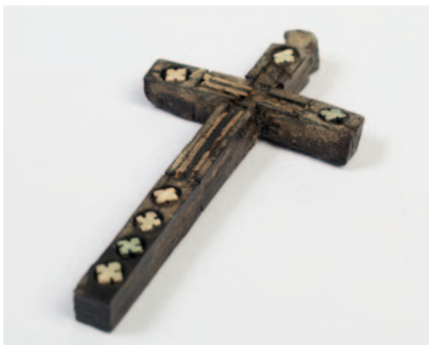
Sl. 5 Drveni križ iz brevara Fig. 5 Wooden cross from the brevarl