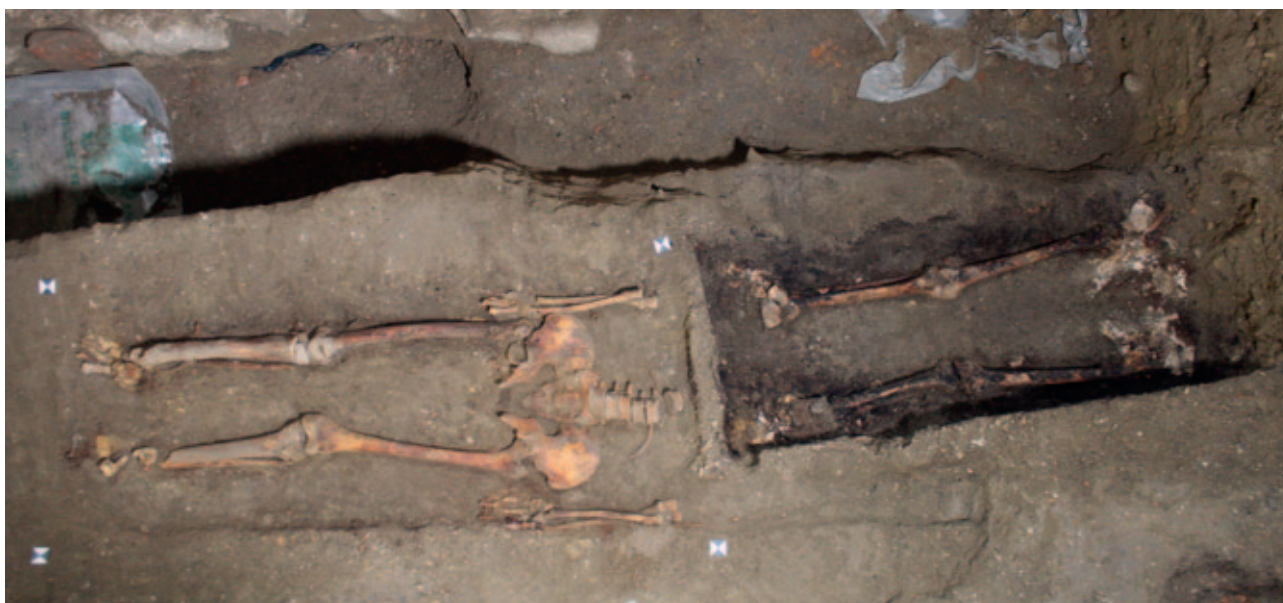
Sl. 2 Grob 66 (desno) presjekao je grob 67 (lijevo) u predjelu prsnog koša Fig. 2 Grave 66 (right) intersected the grave 67 (left) in the chest area