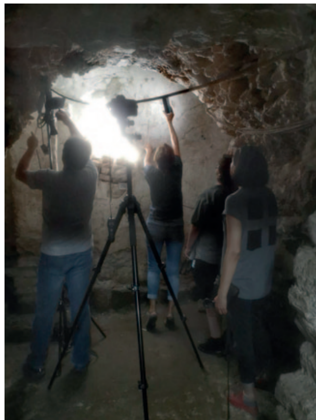
Sl. 10. Priprema multispektralnih snimanja crteža Krštenja Kristova u južnom bočnom brodu prve crkve , lipanj 2020 Fig. 10. Preparation of multispectral imaging of the drawing of the Baptism of Christ in the southern side aisle of the first church , June 2020

su njegovu potpuniju rekonstrukciju. Otkriveni su do sada nepoznati dijelovi scene Krštenja, kao i natpisi pisani grčkim alfabetom, a što će svakako pridonijeti daljnjoj stilskoj i ikonografskoj analizi koja ranije nije bila učinjena. Nadalje, potvrđena su razmatranja prethodnika prema kojima je crtež