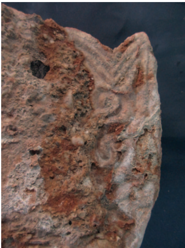
Sl. 3. Primjer ulomka predromaničkih stilskih odlika uklopljenog u građevinsku žbuku. Depo Katedrale, KA1128 (prije čišćenja: 23 x 15 x 12 cm)

Fig. 3. Example of a fragment with pre-Romanesque stylistic features, embedded in building plaster. Cathedral depot, KA1128 (23 x 15 x 12 cm before cleaning)