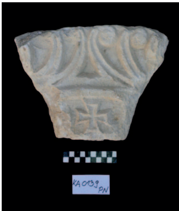
Sl. 5. Ulomak kapitela isklesan od ranijeg luka. Depo Katedrale, KA0139PN Fig. 5. Fragment of a capital sculpted from an earlier arch. Cathedral depot, KA0139PN

da je kapitel nastao preklesavanjem luka starije oltarne ograde, pri tom zadržavši starije motive (sl. 5). Na temelju motiva, luk od čijega je dijela načinjen kapitel datiran je u 9. stoljeće (Jakšić 2014: 597). Ovaj primjer tako jasno ukazuje ne samo na reupotrebu starije liturgijske opreme u kasnijim fazama opremanja prve crkve , već otvara prostora razmišljanju o potrebi za „štednjom“, odnosno „reciklažom“ materijala čak i kod novih i važnijih investicija, što preuređenje svetišta svakako jest bilo.