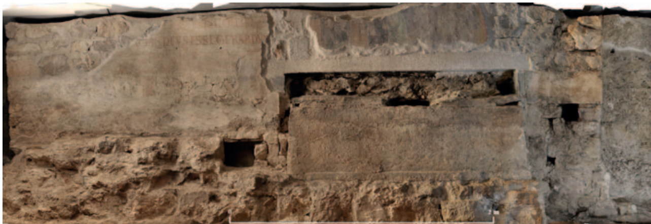
Sl. 8. Fotogrametrijski snimak grobnice nadbiskupa Gerarda i groba u arkosoliju Fig. 8. Photogrammetric image of the tomb of Archbishop Gerard and the grave in the arcosolium