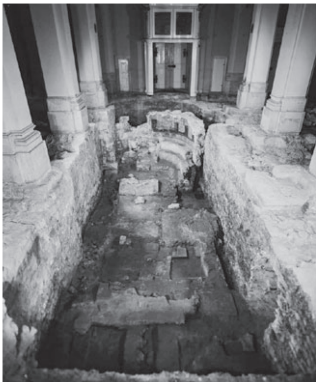
Sl. 1. Pogled na prostor svetišta prve crkve Fig. 1. View of the sanctuary of the first church

liturgija te se s tim u vezu dovode ostaci stepeništa koje je vodilo iz eksterijera izravno u prostor južnog bočnog broda (Stošić 1988: 16–18, 20–21; Zelić 2014: 44). Dodatno, neposredno pred gradnju romaničke katedrale grade se i spomenute monumentalne grobnice na vanjskoj plohi zida (Stošić 1988: 20; Fisković 2009: 21; 2014: 85; Zelić 2014: 38, 41, 43).