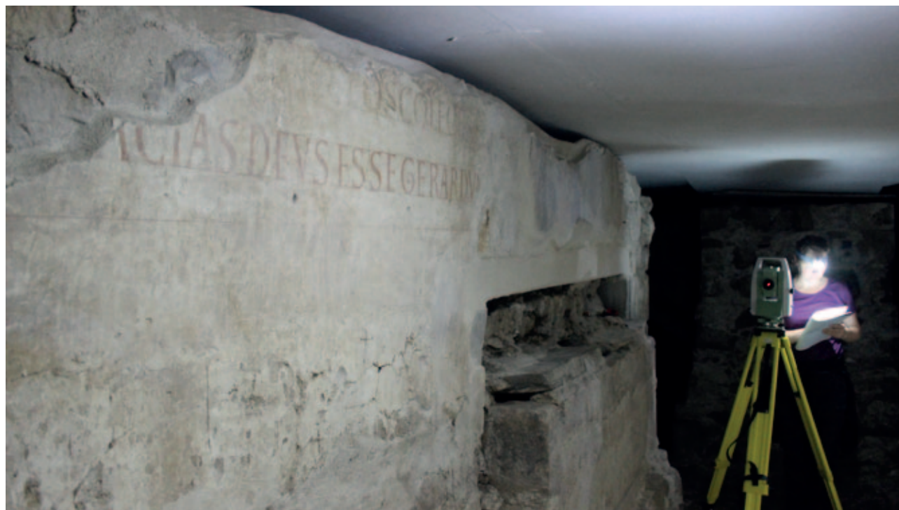
Sl. 2. Pogled na vanjski perimetralni zid prve crkve s monumentalnim grobnicama u tijeku snimanja totalnom stanicom Fig. 2. View of the outer perimeter wall of the first church with the monumental tombs during total station recording