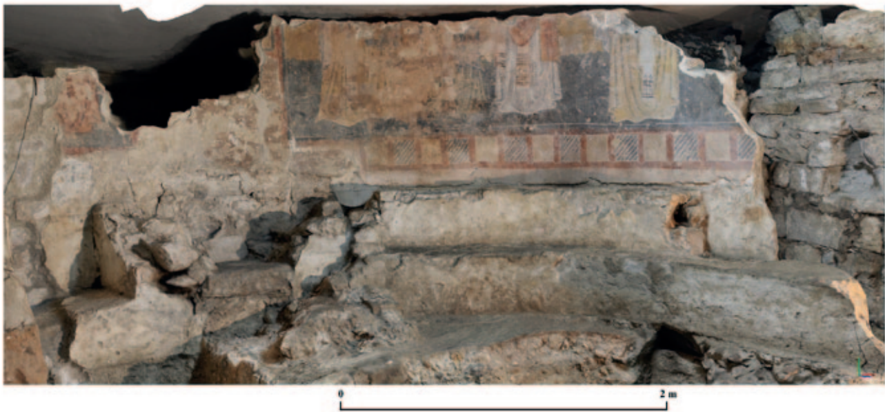
Sl. 9. Fotogrametrijski snimak svetišta prve crkve Fig.9. Photogrammetric image of the sanctuary of the first church

crkve (sl. 9) omogućit će daljnje bolje sagledavanje odnosa različitih faza izgradnje klupe za kler i katedre, kao i zahvata koji su provedeni u zadnjoj fazi uređenja svetišta, datiranoj 11. stoljećem, kada je katedra bila podignuta i, pretpostavlja se, proširena (Stošić 1988: 18). U budućim istraživačkim kampanjama nastavit će se snimanja cjelokupnog prostora svetišta i struktura u središnjem brodu, a kako bi se ispitali i složeni odnosi pojedinih cjelina kamenog liturgijskog namještaja, ali i odnosi liturgijskog namještaja prema zidnim slikama u središnjoj apsidi, i to iz različitih faza. Jedino na taj način, kombiniranjem različitih istraživačkih metoda različitih struka, moći ćemo u budućim kampanjama dati i precizniju interpretaciju očuvane kamene plastike (u depou, pa i opisane u dokumentaciji 1980–ih) ili slikane dekoracije prve crkve (bilo in situ ili iz arheološkog sloja lokaliteta).