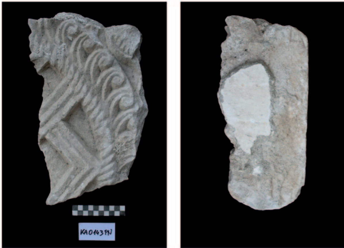
Sl. 6. Ulomak pluteja, prednja strana (a) i komad finije žbuke s naličjem na neobrađenoj strani ulomka (b). Depo Katedrale, KA0143PN (izradila: M. Zeman)