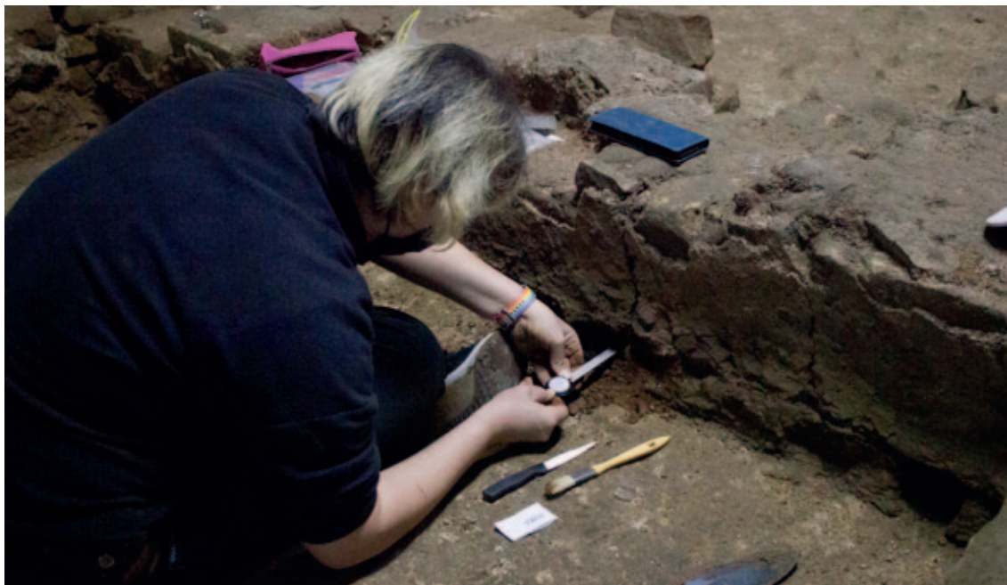
Sl. 7. Uzimanje uzoraka tla iz središnjeg broda prve crkve u ožujku 2022. godine Fig. 7. Taking soil samples from the main aisle of the first church in March 2022

plaštu zida – totalnom stanicom snimljene su i fiksne točke koje su korištene za izradu vektorskog crteža u AutoCAD programu. Tako izrađena dokumentacija pogodna je za daljnju obradu računalnim alatima te će i unutar interaktivne baze podataka projekta poslužiti kao podloga rekonstrukcijama pojedinih arhitektonskih cjelina prve crkve , u različitim fazama, kao i odnosa prve crkve prema romaničkoj katedrali.