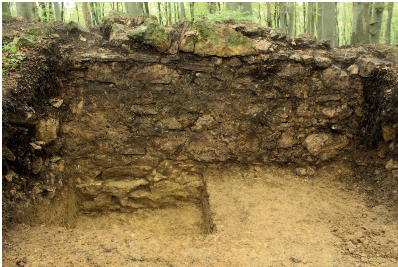
Sl. 3 Zid u sondi 23

U sloju prhke svjetlije žute zemlje pronađeni su ulomci prapovijesne keramike, za koje zbog fragmentarnosti i oštećenosti materijala, nije bilo moguće odrediti kojem točno prapovijesnom razdoblju pripadaju. Iznimka je ulomak posude pronađene u rovu 1 koji pripada starijoj fazi kulture polja sa žarama (sl. 4). Slični su keramički oblici pronađeni na lokalitetu Blizna kod Jakopovca kraj Varaždina (Bekić 2006: 109–110) udaljenom tek 15-ak km od utvrde Gradišće. Postoji mogućnost da je ovaj sloj zapravo izbačen tijekom kopanja temelja te vremenom ispran, no tu bi pretpostavku tek trebalo ispitati (Belaj 2008: 27). U urušenju zida, osim ulomaka prapovijesne keramike, u sondi 23 pronađeni su i ulomci minimalno jednog, a vjerojatnije dva kasnosrednjovjekovna lonca koji se na osnovi profilacije ruba, fature i ukrasa mogu datirati u široko razdoblje od sredine 13. do u 15. stoljeće (sl. 5). Raspoloživa keramička građa ne daje dovoljno podataka za rekonstrukciju oblika posuda. Ulomci su ukrašeni kombinacijom jednostruke valovnice i vodoravne linije. Na nekim se ulomcima ramena lonca valovnica pojavljuje visoko ispod vrata i iznad vodoravne linije ili se nalazi između vodoravnih linija, a na nekima prelazi preko vodoravne linije. Ulomci trbuha s nizovima isključivo vodoravnih linija pripadaju istoj posudi koja je na ramenu bila ukrašena kombinacijom valovnica i vodoravnih linija. Slično