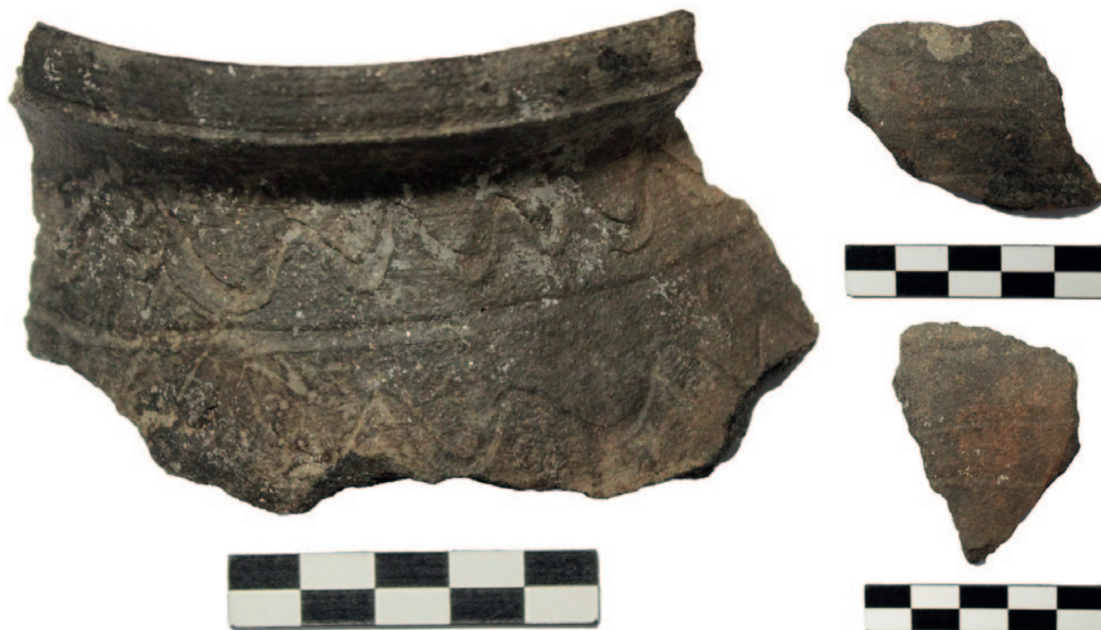
Sl. 5 Ulomci kasnosrednjovjekovne keramike iz sonde 23 (snimila i izradila: T. Kokotović)

Fig. 4 Fragment of Late Bronze Age pottery from Trench 1 (photo by: T. Kokotović)