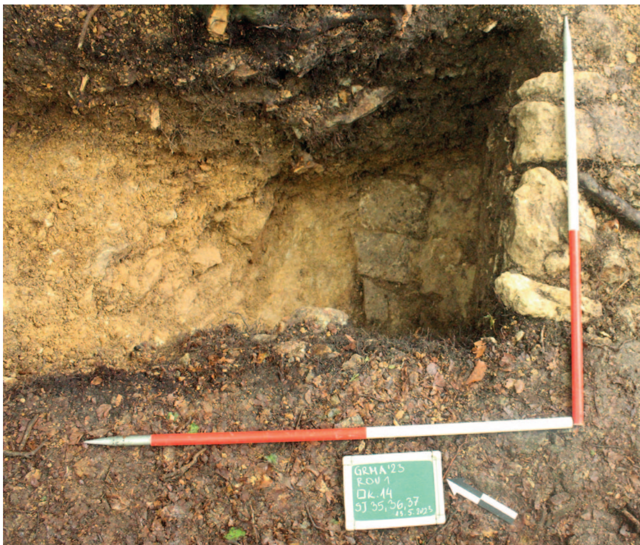
Sl. 6 Struktura kod južnog zida u rovu 1 Fig. 6 Structure at the southern wall in Trench 1

kojeg se nalazila zdravica. S unutarnje strane zidova pronađeno je njihovo urušenje. Nalaz kasnobrončanodobne keramike potvrđuju postojanje brončanodobnog visinskog naselja na ovom položaju. Nažalost, nisu pronađeni ostaci objekata ili struktura unutar zidova utvrde, a ulomci kasnosrednjovjekovne keramike potječu iz razdoblja za koje se pretpostavlja da je utvrda mogla nastati, 13. i 14. stoljeća, no zbog svoje malobrojnosti ne omogućavaju pobližu dataciju. Kombinacija jednostruke valovnice i vodoravnih linija, iako ukazuje na tradicije razvijenog srednjeg vijeka također se može koristiti i kroz čitavo razdoblje kasnog srednjeg