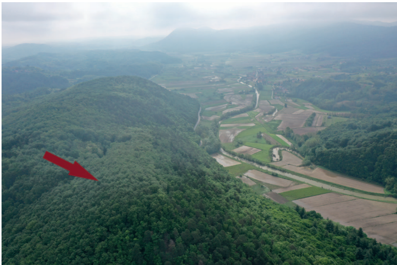
Sl. 1 Brdo Cukovec i pozicija utvrde Gradišće (crvena strelica) Fig. 1 Cukovec Hill and the position of Gradišće Castle (red arrow)

konfiguraciju vrha brežuljka u smjeru zapad – istok, a dužina utvrde iznosi 152,70 m, dok je prosječna širina približno 28 m (vanjske dimenzije) (Belaj 2005: 56). Debljina obrambenih zidova varira, a iznosi od 1,5 do 2,1 m. Na istočnom dijelu utvrde pronađeni su ostaci kvadratne kule (vanjskih dimenzija 11 x 11 m) koja je kontrolirala prilaz u utvrdu (Belaj 2005: 56). Kameni ostaci vanjskih zidova i danas su mjestimično vidljivi iznad zemlje, a po sredini utvrde prolazi uski zemljani planinarski put. Srednjovjekovni naziv utvrde nije poznat, niti su nam poznati povijesni dokumenti koji ju spominju. Utvrda se prvi puta spominje u anketi koju je proveo Ivan Kukuljević Sakcinski 1850. godine 1 i to kao ostaci „kloštra negda Templarah iliti Čerlenih Fratov“ (Dobronić 1984: 102). Lelja Dobronić također utvrdu dovodi u vezu s viteškim redovima i smatra da bi ona mogla biti napušteno sjedište vitezova redovnika (Dobronić 1984: 102). Na temelju oblika utvrde, građevinskih elemenata i drugih značajki (Horvat 2008: 27–28), Belaj (2008) s oprezom zaključuje kako se utvrda može datirati u 13. ili 14. stoljeće te pretpostavlja da su ju gradili ivanovci i to kao putnu postaju za smještaj velikog broja hodočasnika na putu za Svetu Zemlju (Belaj 2020: 29–30). 2