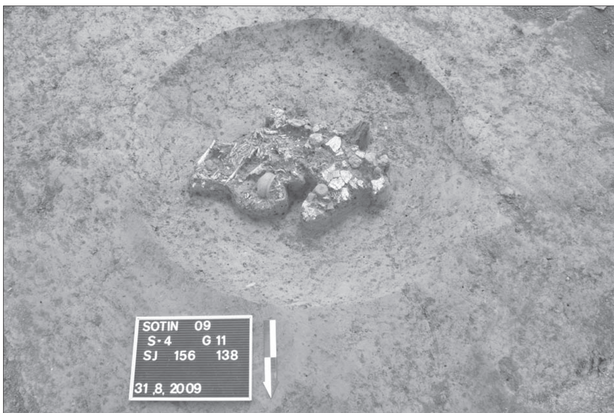
Sl. 3 Sotin, grob 11.