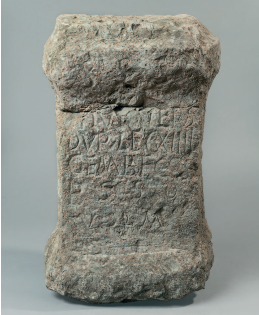
Sl. 1 – Žrtvenik beneficijarija Julija Vera, uz dozvolu (Arheološki muzej u Zagrebu, inv. br. KS-962)