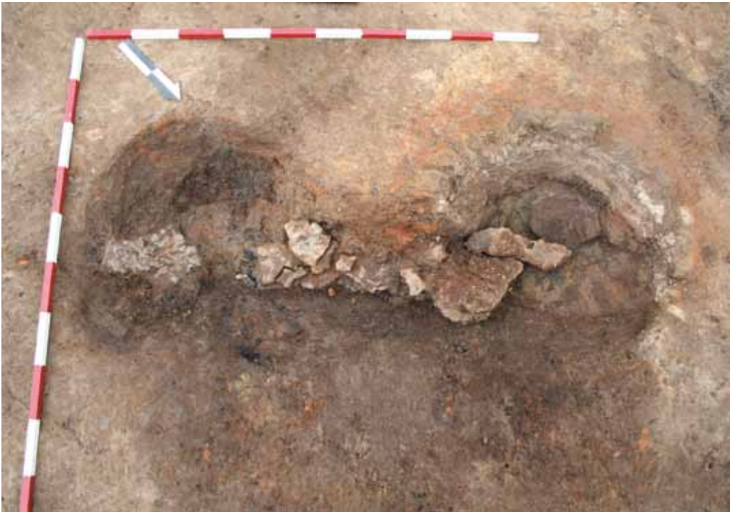
Slika 2. Virje – Volarski breg, ostaci talioničke peći SJ 056/057.

Nastavak istraživanja na Volarskom bregu uslijedio je 2010. g. kada su, oko 200 m sjevernije, istraženi ostaci ranosrednjovjekovnog naselja te ostaci talioničkog otpada iz radionice koja je funkcionirala tijekom kasne antike. 5 Iskopavanjima provedenim tijekom 2012. g. dodatno je istražena površina na kojoj su se nalazile veće arheološke cjeline kružnog tlocrta sa zapečenim dnom, koje su, kao i pet jama istraženih prve godine, bile zatrpane odbačenom talioničkom zgurom i lijepom iz radionice. 6 Iako sekundarno zatrpane otpadom, čini se da su primarno bile u funkciji mjesta za izradu drvenog ugljena ili pripremu sirovine za taljenje. 7