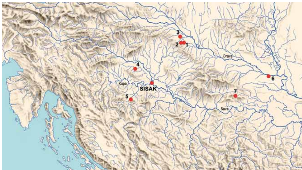
Slika 1. Karta s označenim lokalitetima na kojima je tijekom arheoloških iskopavanja prepoznato taljenje željezne rude: 1. Virje – Volarski breg; 2. Virje – Sušine; 3. Hlebine – Velike Hlebine; 4. Okuje; 5. Turska kosa; 6. Osijek – Donji grad; 7. Imrijevcu – Polačica.

u sklopu znanstveno-istraživačkog projekta TransFER kojeg financira Hrvatska zaklada za znanost. 1 U radu se donosi kratak pregled novoistraženih arheoloških lokaliteta s talioničkim značajkama, kao i onih poznatih iz starijih istraživanja, smještenih na prostoru između dviju rijeka te okolnom području koje je obuhvaćeno pojmom kontinentalne Hrvatske.