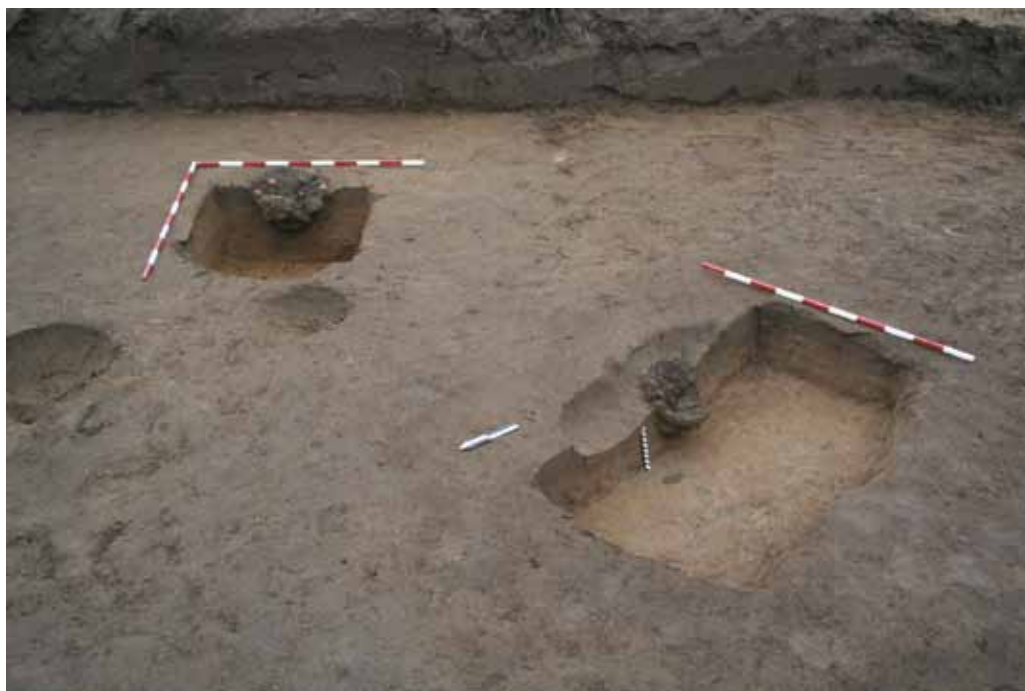
Slika 3. Virje – Sušine, ostaci peći SJ 290/291 i SJ 292/293.

na položaju Sušine evidentirane su arheološke cjeline iz mlađeg željeznog doba te ranoga 10 i razvijenoga srednjeg vijeka, 11 koje su bile nasebinskog karaktera te se one ne mogu direktno povezati s taljenjem željezne rude na ovom lokalitetu. 12 Peći s ovog položaja bile su drugačije od onih istraženih na položaju Volarski breg. Tijekom istraživanja zatečene su jame koje su u potpunosti bile ispunjene većom gromadom zgure te bi se ovaj tip mogao opredijeliti u jamske peći (Sl. 3), u kojima se zgura u nekom postupku obrade rude ili poluproizvoda (bloom-a) taložila na dnu, u manjoj jami (engl. sleg pit furnace). 13