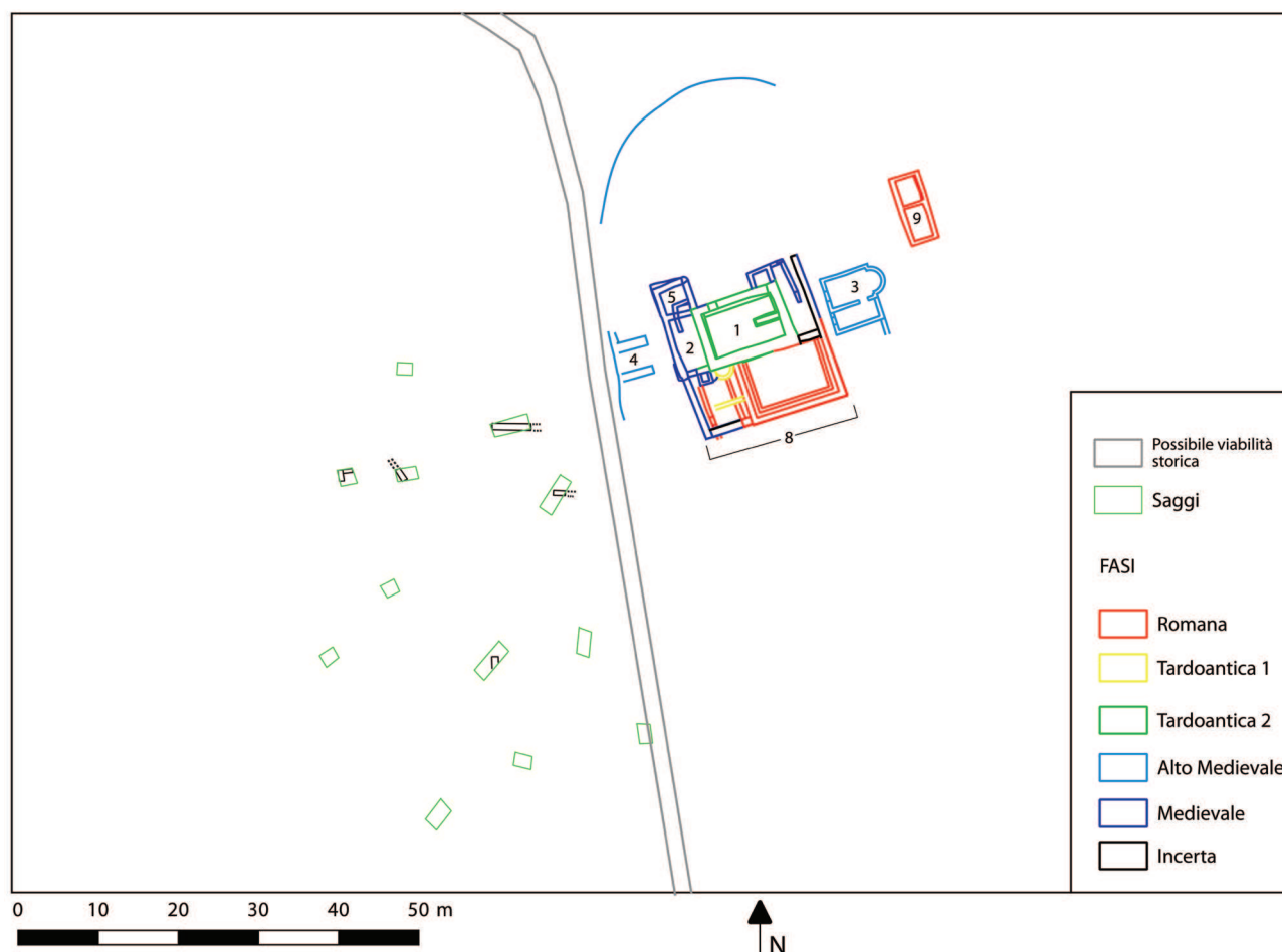
Fig. 1 – Pianta complessiva del sito di Tarovec sovrapposta a una foto aerea. I numeri si riferiscono agli ambienti citati nel testo. A ovest sono indicate le strutture rinvenute in alcuni saggi preventivi (pianta saggi da: J. VIŠNJIĆ, Lokalitet: Tar... , p.157; elaborazione di Ana Konestra).

potenziale economico di questo territorio e della sua vicina insenatura costiera 7 .