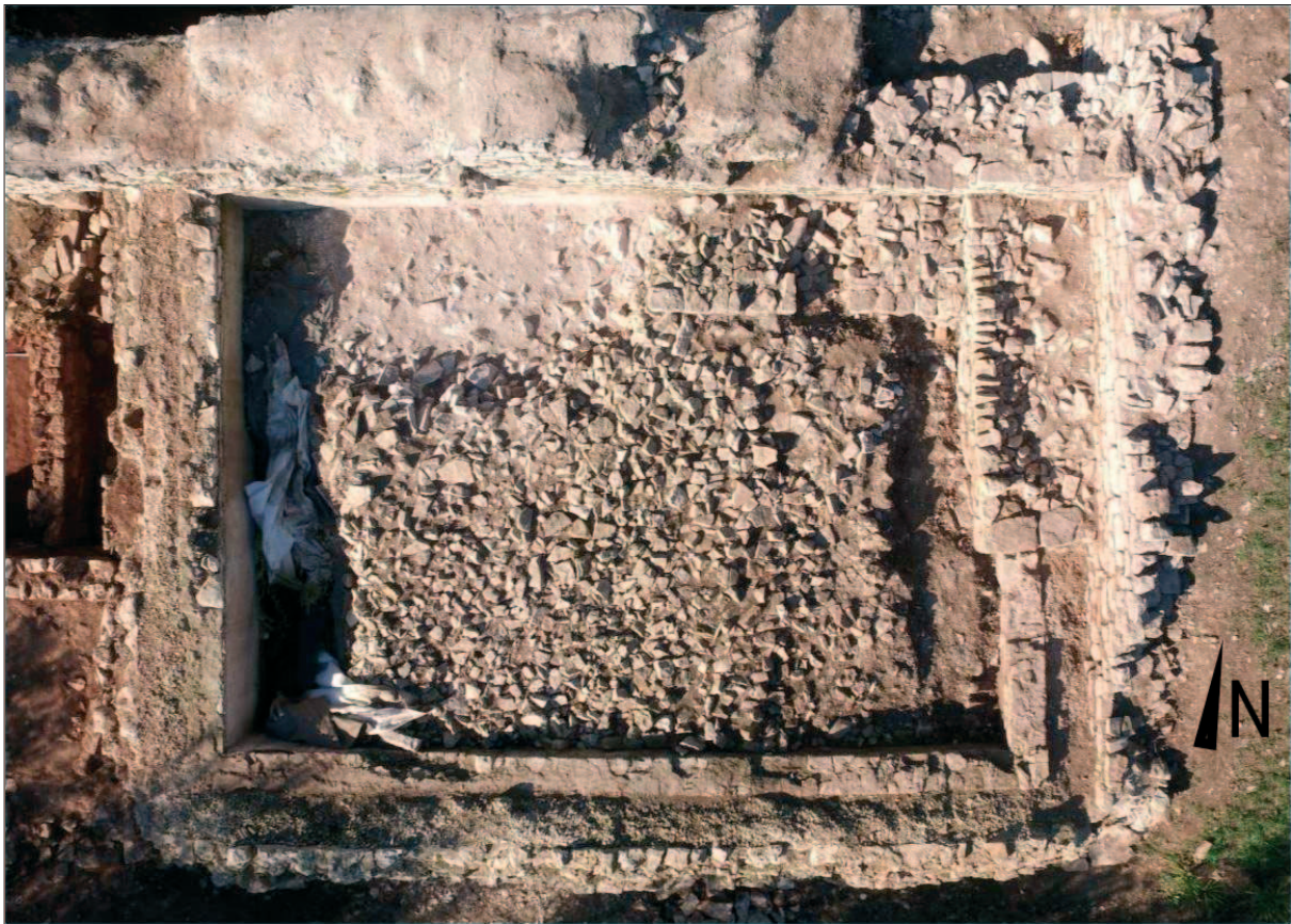
Sl. 5 Zračna snimka cisterne s vidljivim kasnijim strukturama, zapunom i novootkrivenim zidom SJ 142