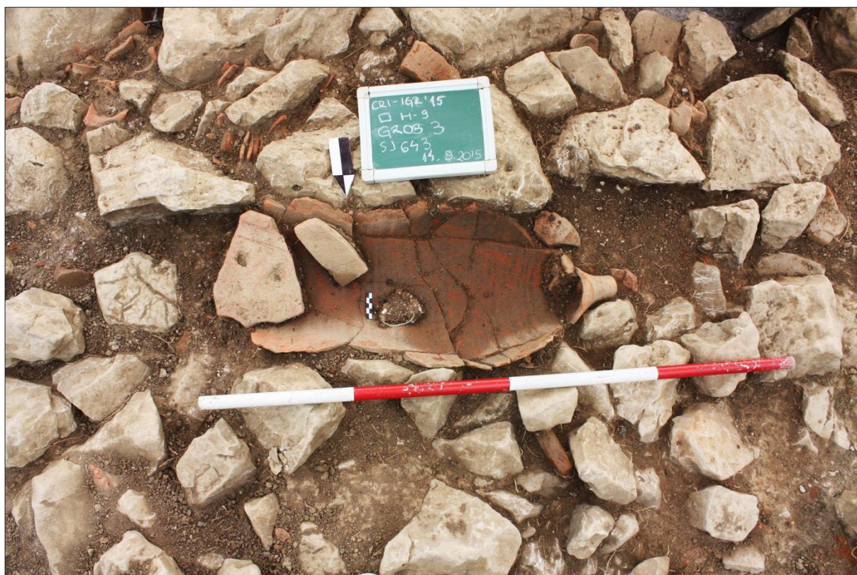
Sl. 6 Crikvenica-Igralište, 2015, nalaz amfore s brončanom narukvicom, SJ 643, 645 i PN-3094.