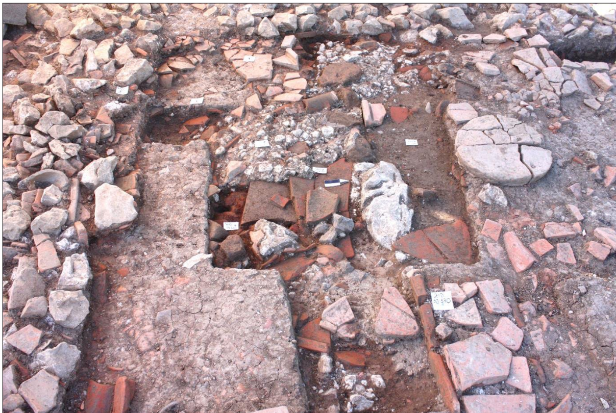
Sl. 5 Crikvenica-Igralište, 2015., tlocrtna situacija podnica uz zapadni rubni dio zida SJ 570: SJ 682, SJ 672, SJ 658, SJ 679, SJ 683, SJ 664, SJ 555.