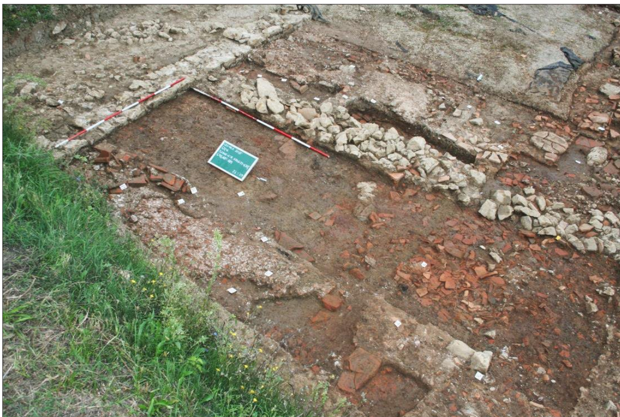
Sl. 1 Crikvenica-Igralište, 2015., situacija na sjeverozapadnom dijelu „Sjevernog proizvodnog sektora“ (snimio: I. Valent).

Fig. 1 Crikvenica – Igralište, 2015, the northwestern section of the "north production sector" (photo: I. Valent).