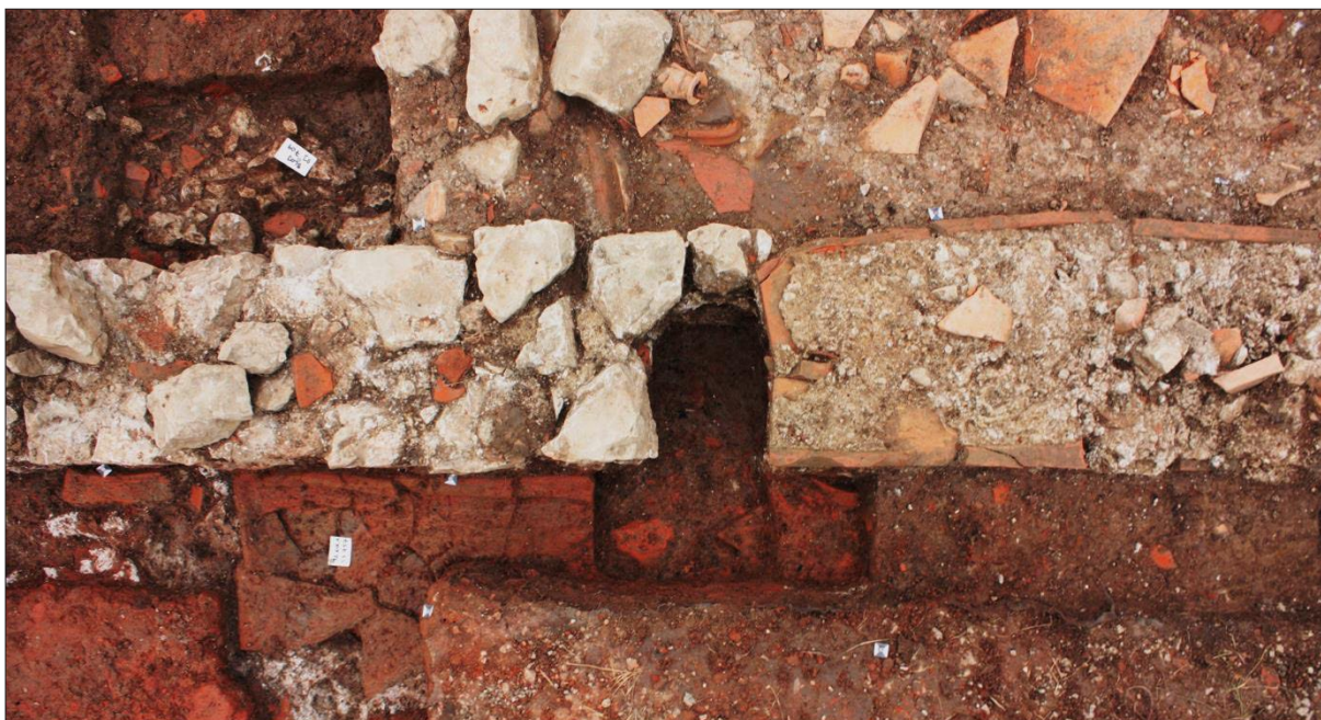
Sl. 3 Crikvenica-Igralište, 2015., položaj utora SJ 654 unutar strukture zida SJ 570.

Fig. 3 Crikvenica – Igralište, 2015., the position of a slot SU 654 within the structure of the wall SU 570.