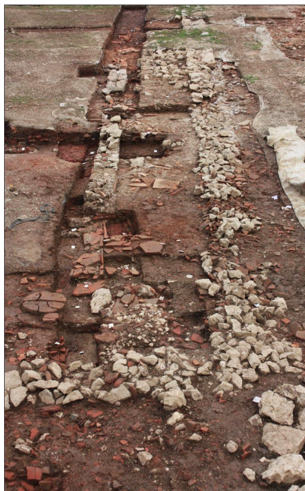
Sl. 2 Crikvenica-Igralište, 2015., smjer pružanja zida SJ 570.

Unutar ovog poluzatvorenog prostora „Sjevernog proizvodnog sektora“ u istoj je fazi, unutar kvadranta □ I,6, funkcioniralo nekoliko prostorija poredanih u niz (smjer zapad-istok) koristeći ogradni sjeverni radionički zid (SJ 051) za svoj sjeverni zid. Prostorije su međusobno bile odvojene pregradnim zidovima SJ 670 i SJ 697 čija se struktura (dimenzije 1,45 x 0,26 m)