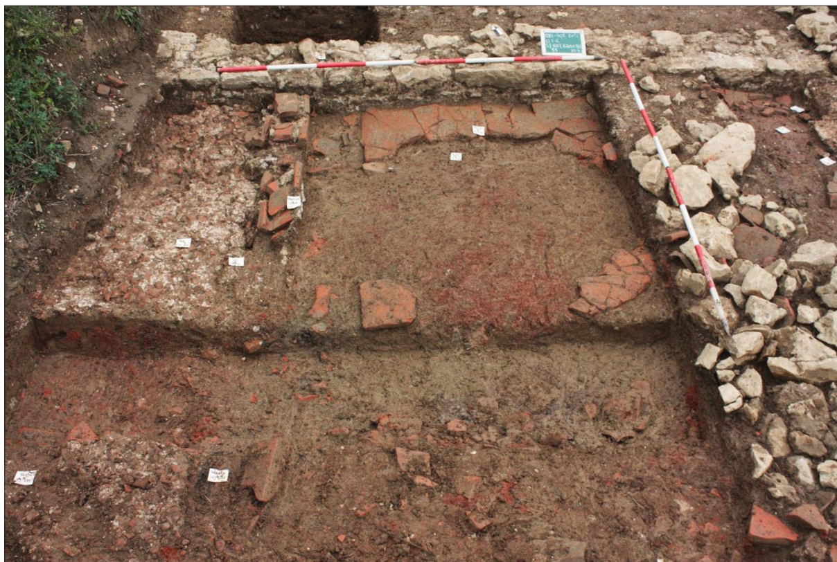
Sl. 4 Crikvenica-Igralište, 2015., dvije različite strukture podnice (hidraulična, SJ 554 i SJ 667 i podnica s opekama SJ 698 i SJ 662 ) unutar dviju prostorija odvojenih pregradnim zidom, SJ 670.