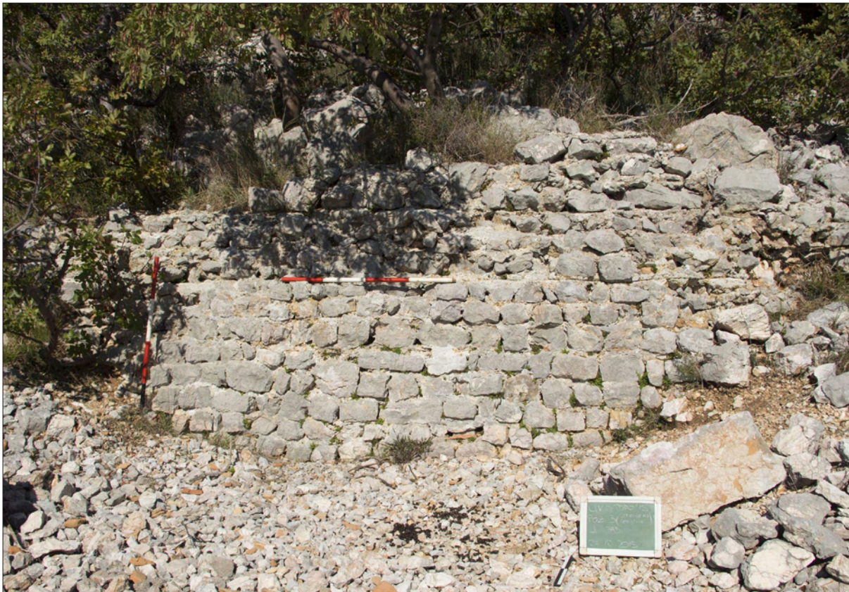
Sl. 5 Gradina kod Starigrada – ostaci antičke(?) arhitekture na POZ 3.