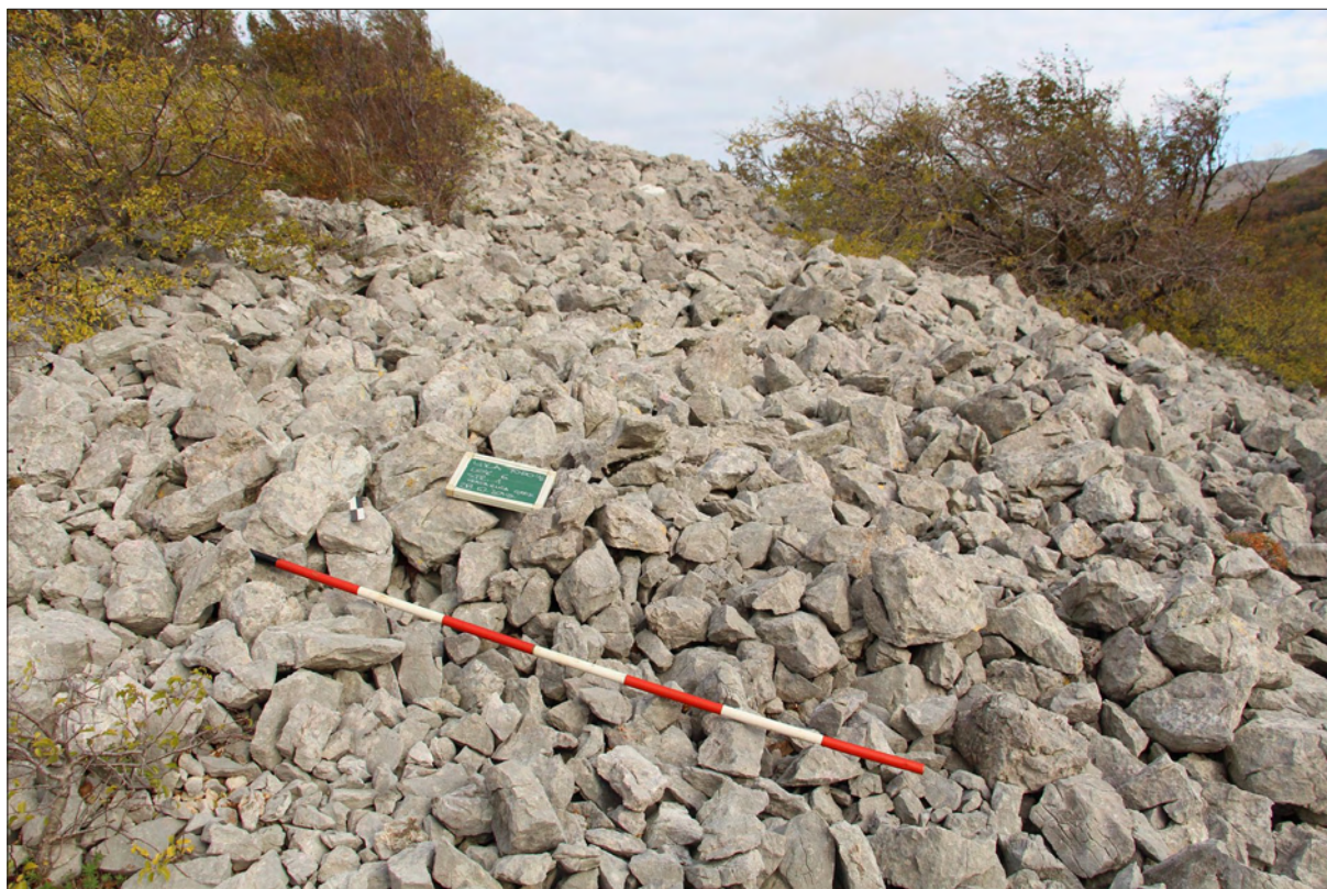
Sl. 4 Rasuti bedem na Gradini kod Vrataruše, LOK 6 (snimila: A. Konestra).

Fig. 4 Collapsed rampart, hillfort at Vrataruša, LOK 6 (photo: A. Konestra).