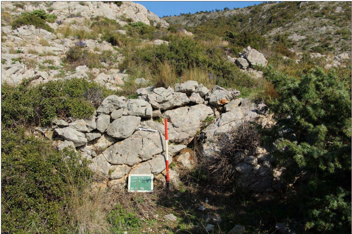
Sl. 2 Lokalitet 1 – Kuk, suhozidna struktura.

Fig. 2 Site 1 – Kuk, drywall structure.