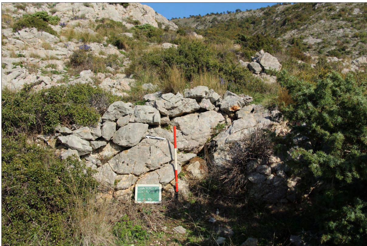
Sl. 2 Lokaltet 1 – Kuk, suhozidna struktura (snimila: A. Konestra).

Fig. 2 Site 1 – Kuk, drywall structure (photo: A. Konestra).