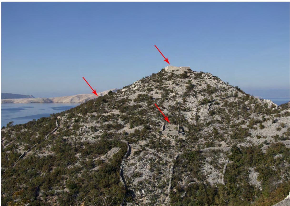
Sl. 3 Lokalteti 3 i 4, pozicije 1-3 – pogled na Gradinu iznad Starigrada senjskog s obilježenim položajima lokaliteta i pozicija.

Fig. 2 Site 1 – Kuk, drywall structure.