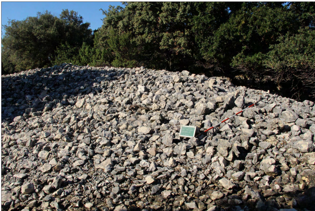
Sl. 4 Lokalitet 79 – rasuti bedem na lokalitetu Plogar.

Fig. 4 Site 79 – collapsed rampart at Plogar site.