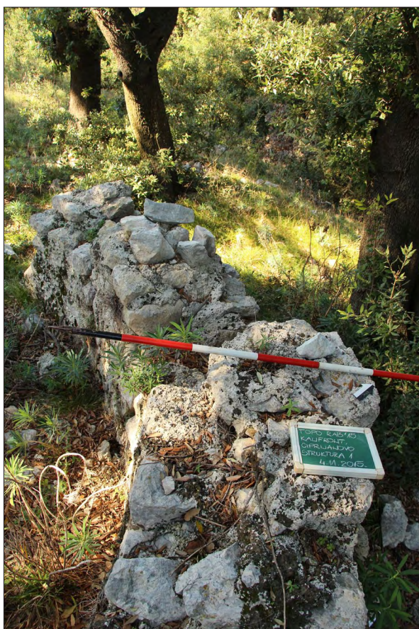
Sl. 3 Lokalizet 81 – apside ranokršćanske (?) crkve u šumi Dundo.

Fig. 2 Site 82 – state of preservation of the perimeter walls of the Church of St. Mavro with damage indicated.