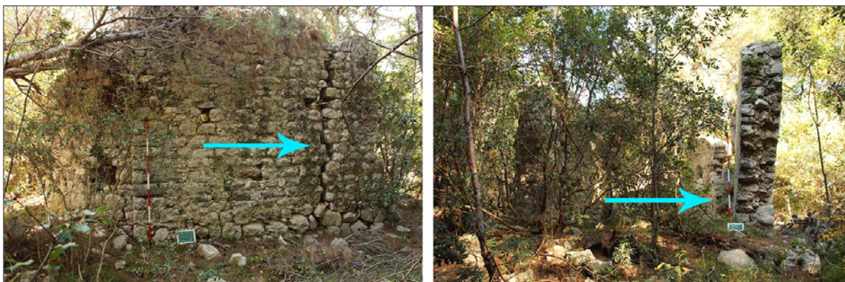
Sl. 2 Lokalizet 82 – stanje očuvanosti perimetralnih zidova crkve sv. Mavra s označenim oštećenjima.

Fig. 2 Site 82 – state of preservation of the perimeter walls of the Church of St. Mavro with damage indicated.