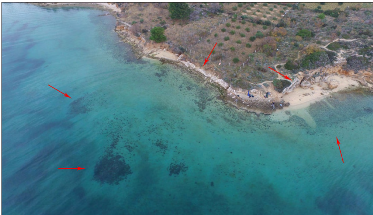
Sl. 6 Zračni snimak područja lokaliteta Mirine – ostaci pristaništa i zidnih struktura na obali (snimio: E. Šilić).