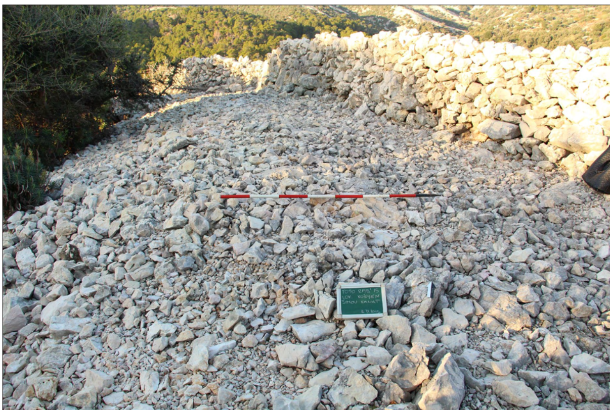
Sl. 5 Lokalitet 83 – rasuti bedem gradine Košljen.

Fig. 4 Site 79 – collapsed rampart at Plogar site.