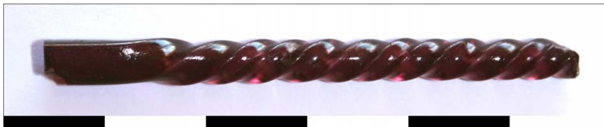
Sl. 3 Ulomak staklene miješalice PN 3517

Tijekom primarne i studijske obrade nalaza izdvojena je veća količina posebnih nalaza (PN), mahom keramičkih predmeta, a koji se odnose na nove ili cjelovite oblike, pečate ili otiske na tegulama i uvoznu keramiku (italska terra sigillata i keramika tankih stijenki).