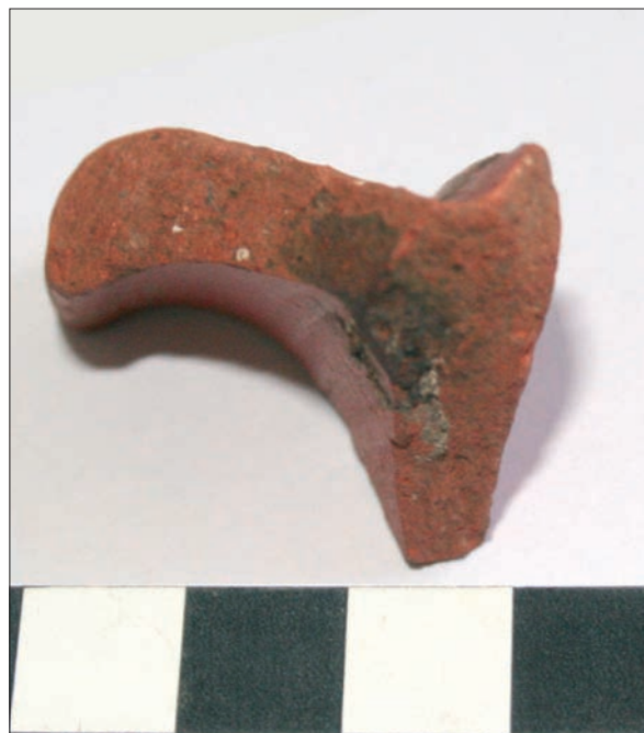
Sl. 2 Ulomak afričke sigilatne zdjelice Hayes 91b (PN 173).

Skidanjem svih paljevinskih slojeva uočeno je da se SJ 081 (relativno pravilno, uslojeno kamenje, uočeno u sjeverozapadnom kutu) prostire ispod zidova SJ 058 i SJ 059, a vjerojatno je vidljiv i sa sjeverne strane SJ 058, dok se SJ 092 prostire po cijeloj površini omeđenoj gore navedenim zidovima. Unutar SJ 096, ali i u ostalim paljevinskim slojevima, pronađena je veća količina metalne zgure, ali i metalnih (čavli, dijelovi fibula?) i staklenih predmeta. Nalazi metalne (kovačke?) zgure unutar paljevinskih slojeva mogli bi upotpuniti njihovu interpretaciju, međutim tek nakon detaljnije analize. U južnom dijelu istog prostora uočen je još jedan ukop, SJ 098, čija je zapuna SJ 097 također dio paljevinskog sloja. Iz ove zapune potječe PN 173, rub i izvijeno rebro zdjelice tipa Hayes 91b afričke proizvodnje, koji se datira u 5. stoljeće (Bonifay 2004: 178–179) (sl. 2). Iz SJ 092 potječe pak ulomak mortarija (ili zdjele s rebrom), PN 145, kakvi se javljaju od 1. stoljeća u afričkoj proizvodnji, međutim