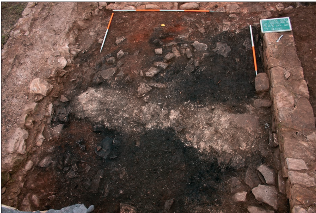
Sl. 1 Situacija u □ H/I 30 s paljevinskim slojevima SJ 091, 094 i 096, zapunom 090 i slojem kamenja SJ 081.

Fig. 1 Situation in □ H/I 30 with burnt layers SU 091, 094 and 096, fill 090 and layer of stones SU 081.