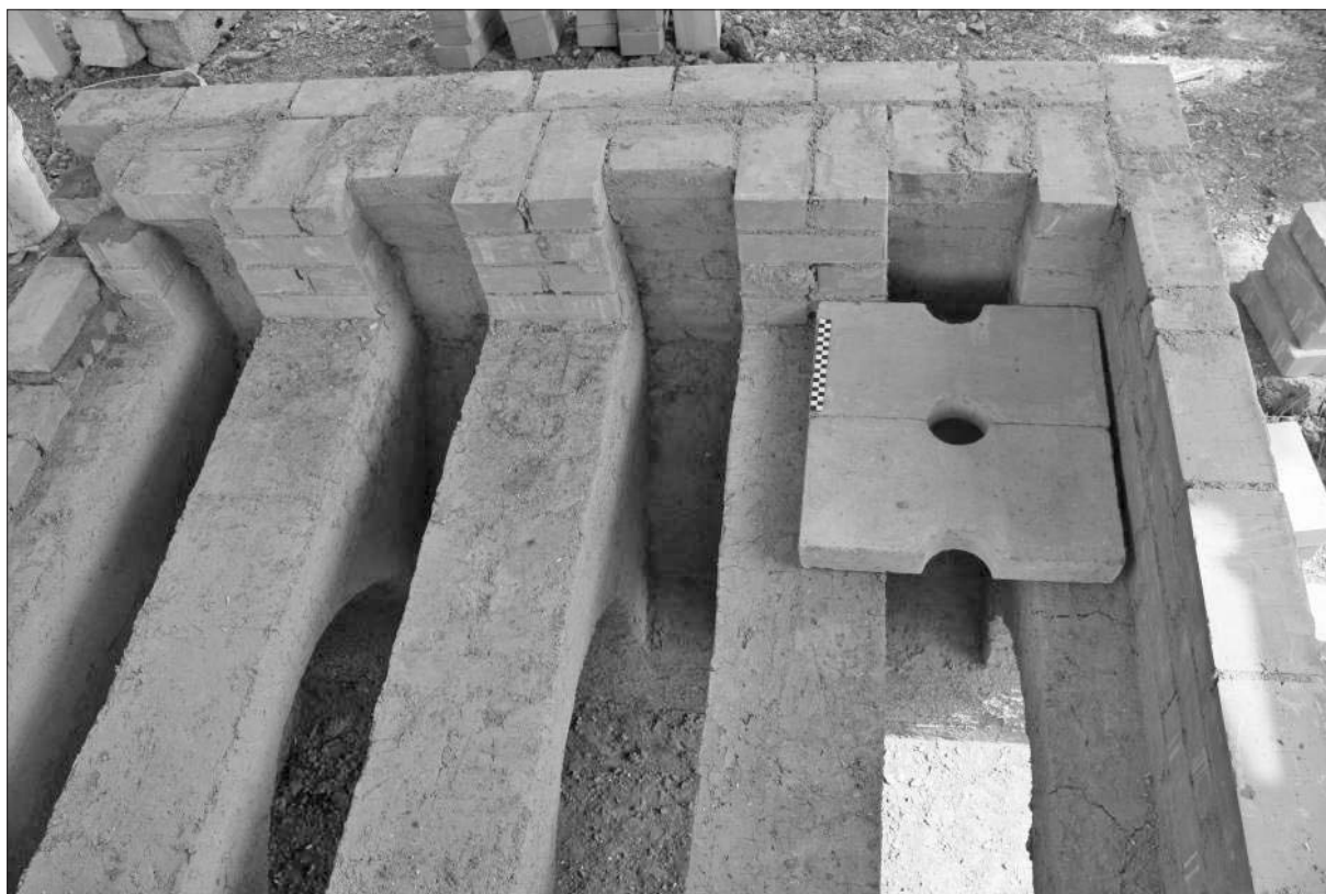
Sl. 3 Crikvenica – opeka rešetke s kružnim otvorom za protok toplog zraka.

Pri zidanju lučnog svoda visine 1,52 m, ostavljeni su otvori širine 26 cm, po četiri u svakom nizu i peti na samom sljemenu svoda. Tijekom zidanja, na lučnom svodu pri spoju sa zabatnim zidom naknadno smo dodali još jedan veći rezervni otvor u slučaju da smo pogiješili u termodinamičkim izračunima toplinskog protoka. Tijekom nekoliko pokusnih režima pečenja, ovaj se otvor pokazao nepotrebnim i naknadno je zatvoren. Ve-