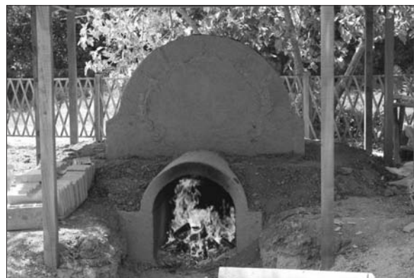
Sl. 7 Crikvenica – rekonstrukcija rimske keramičarske peći i postupak njenog paljenja.

Rezultat koji je nužno očekivati u optimalnom režimu pečenja mora zadovoljavati nekoliko pretpostavki: maksimalna koncentracija energije uz korištenje što manje količine ogrijevne mase unutar vremenski zadanog režima temperaturnih maksimuma. Kada se postignu i usklade svi elementi ovih idealnih uvjeta, doseže se sustav antičke tehnologije pečenja keramike. U našem eksperimentalnom projektu prošle godine tek smo zakoračili u poznavanje nekih njegovih dijelova. Saznanja o propustima i uspješnim rješenjima su prikupljena, a svakim novim