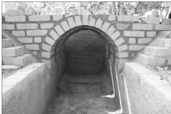
Sl. 2 Crikvenica – Pogled na vatrišni/ložišni kanal i komoru za izgaranje.

Fig. 2 Crikvenica – View of the furnace channel and the combustion chamber.