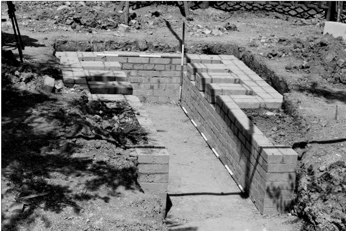
Sl. 1 Crikvenica – Strukture vatrišnog/ložišnog kanala i komore za izgaranje replike rimske keramičarske peći.