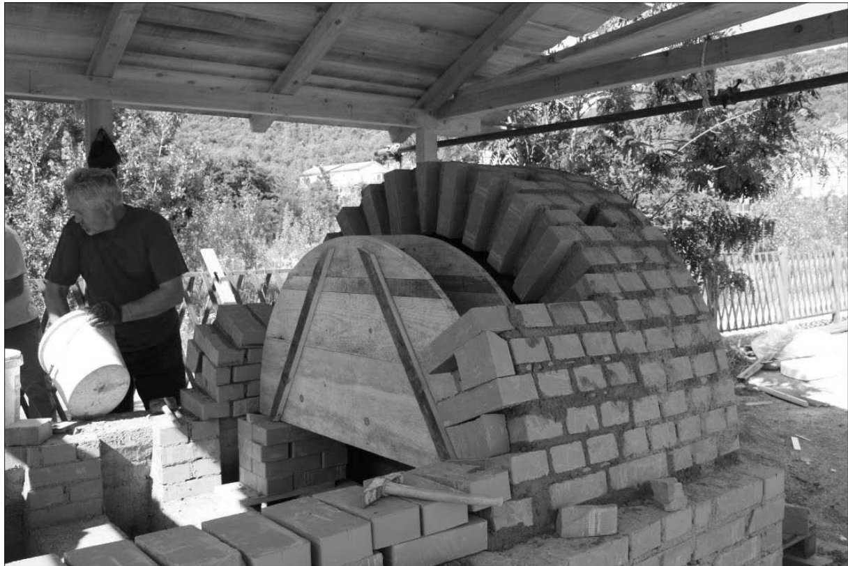
Sl. 4 Crikvenica – zidanje lučnog svoda peći.

Fig. 4 Crikvenica - building of the kiln's arched ceiling.