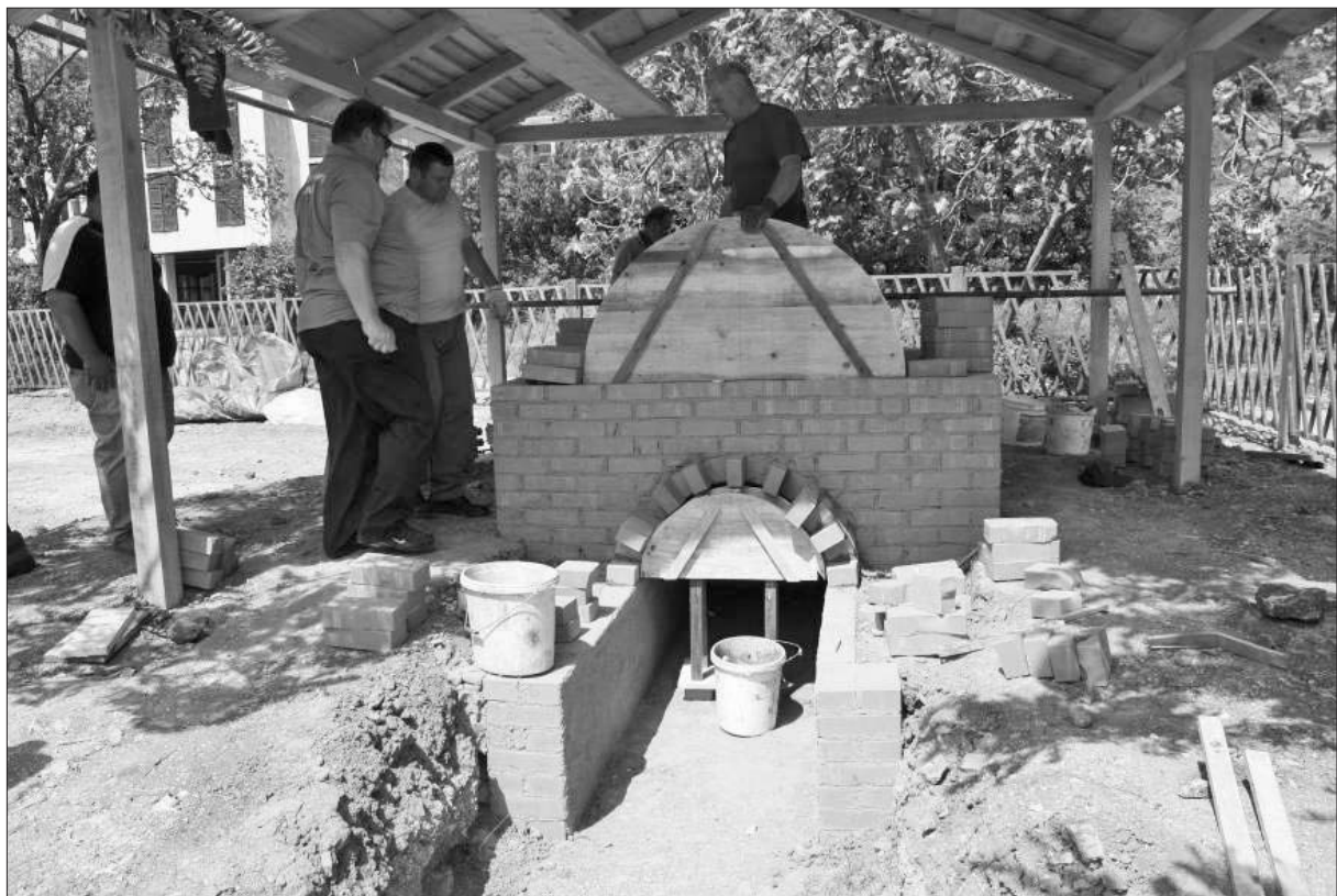
Sl. 5 Crikvenica – zidanje lučnog svoda peći.

Fig. 4 Crikvenica - building of the kiln's arched ceiling.