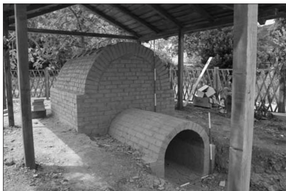
Sl. 6 Crikvenica – rekonstrukcija rimske keramičarske peći.

Fig. 6 Crikvenica - reconstruction of a Roman pottery kiln.