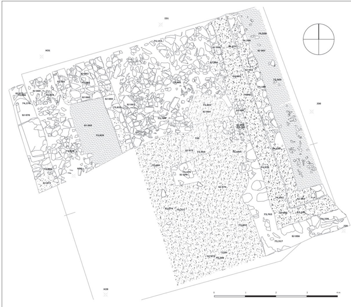
Sl. 2 Zapadni profil istraženog dijela sa slojem urušenja i ostatcima vrata (izradila: K. Jelinčić).