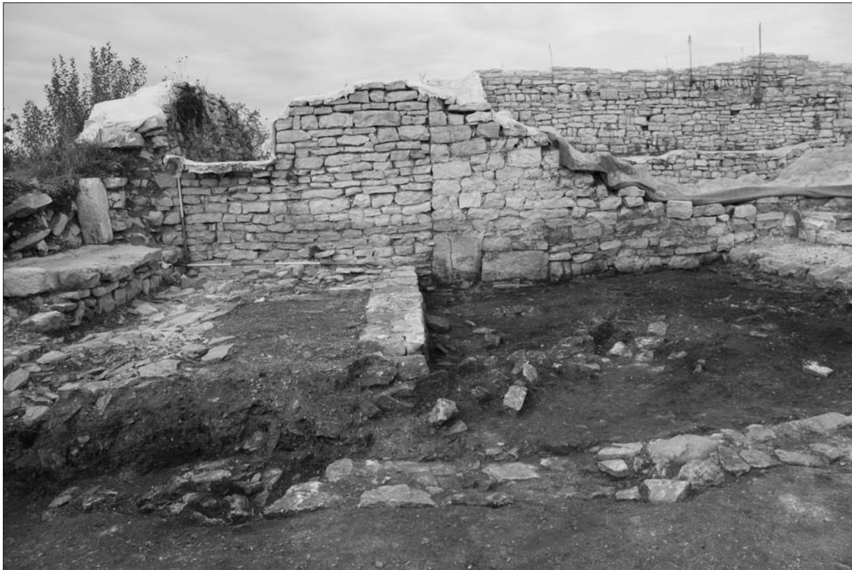
Sl. 3 Južni zidovi prostorija 1 i 2 (snimio: B. Šiljeg).