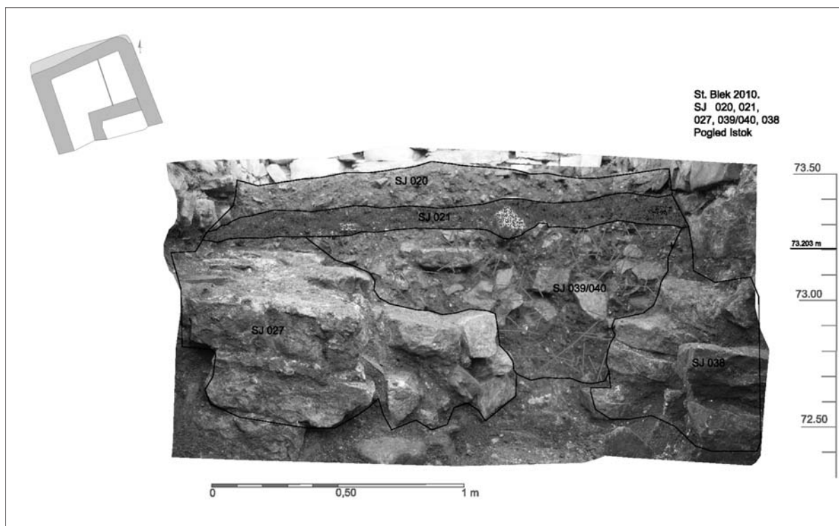
Sl. 1 Kontrolni profil unutar prostorije 5 (izradila: A. Kudelić).

Fig. 1 Control profile inside room 5 (illustration: A. Kudelić).