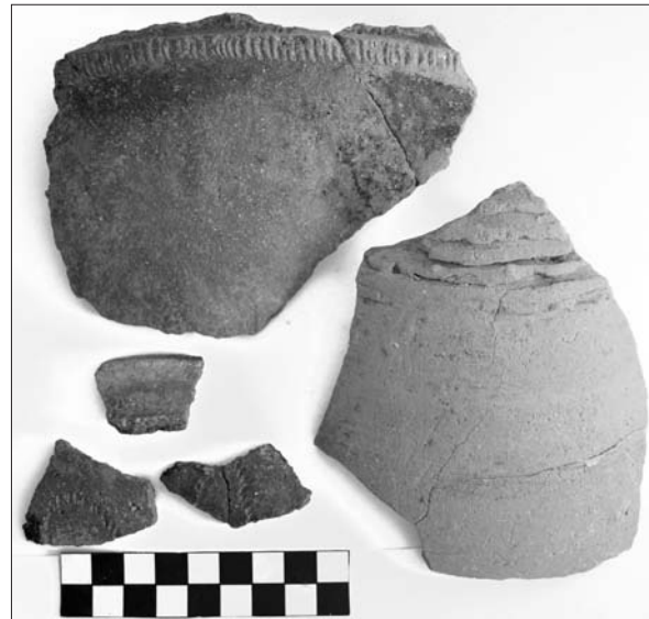
Sl. 4 Kasnoantička keramika 5. i 6. stoljeća.

Godine 2010. nastavilo se s radovima na razini slojeva SJ 010, 018 i 019, te je unutar SJ 018, koja se nalazi u SZ uglu otkriveno još ulomaka stakla istih obilježja kao i ono otkriveno ranije. Za razliku od 2008. godine kad je pronađeno više čaša, ove je nađeno više ostataka boca (tijelo, vrat, dno i obod). Od boca su očuvani vratovi s diskoidnim proširenjem te prema