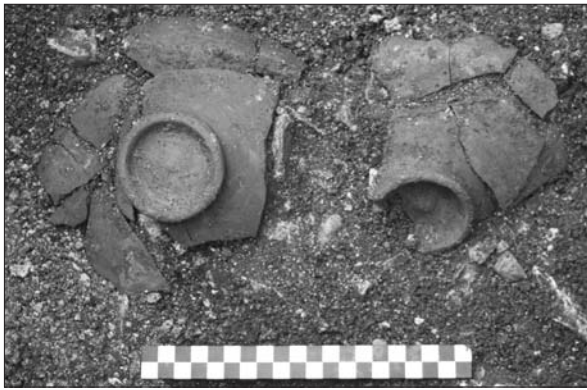
Sl. 3 Keramičke zdjelice (PN 75 i 79) ukrašene engobom i zelenom glazurom iz sloja SJ 018.

Fig. 3 Small ceramic bowls (SF 75 and 79) decorated with engobe and green glaze from layer SU 018.