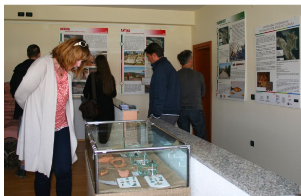
Sl. 7 S otvorenja izložbe „Arheološka topografija: putovanje kroz prošlost Lopara“.