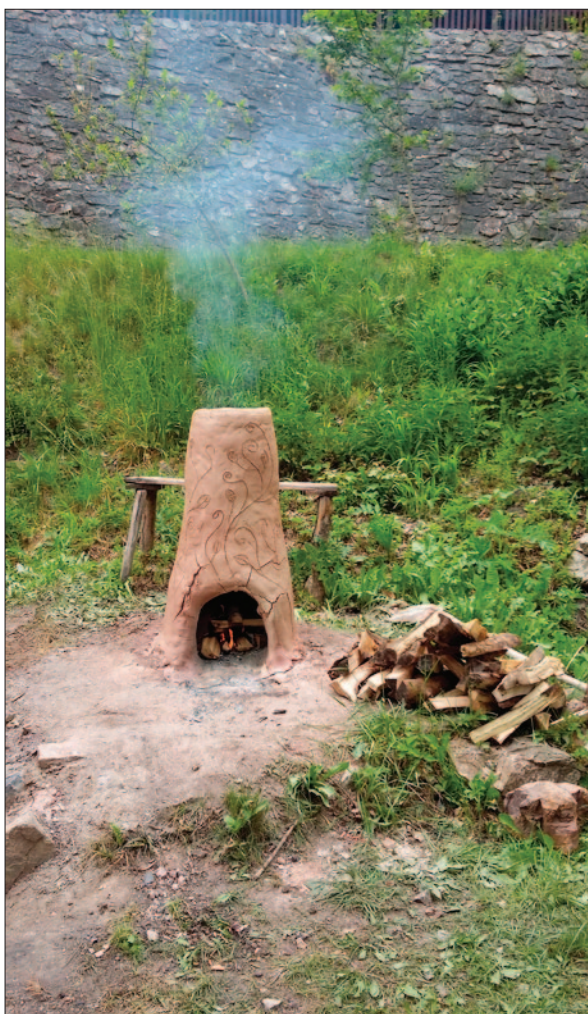
Sl. 2 Samostojeća talionička peć u mjestu Stará huť u Adamovu kraj Brna

Fig. 1 Smelting furnaces dug into the slopes of a nearby height in the settlement of Stará huť at Adamov near Brno