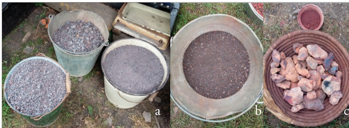
Sl. 3 Tri vrste željezne rude korištene u eksperimentalnim taljenjima za vrijeme trajanja radionice: a) magnetit podrijetlom iz Želehovice (Češka); b) siderit iz regije južna Boca (Slovačka); c) getit iz mjesta Olomučany u regiji Blonsko (Češka)