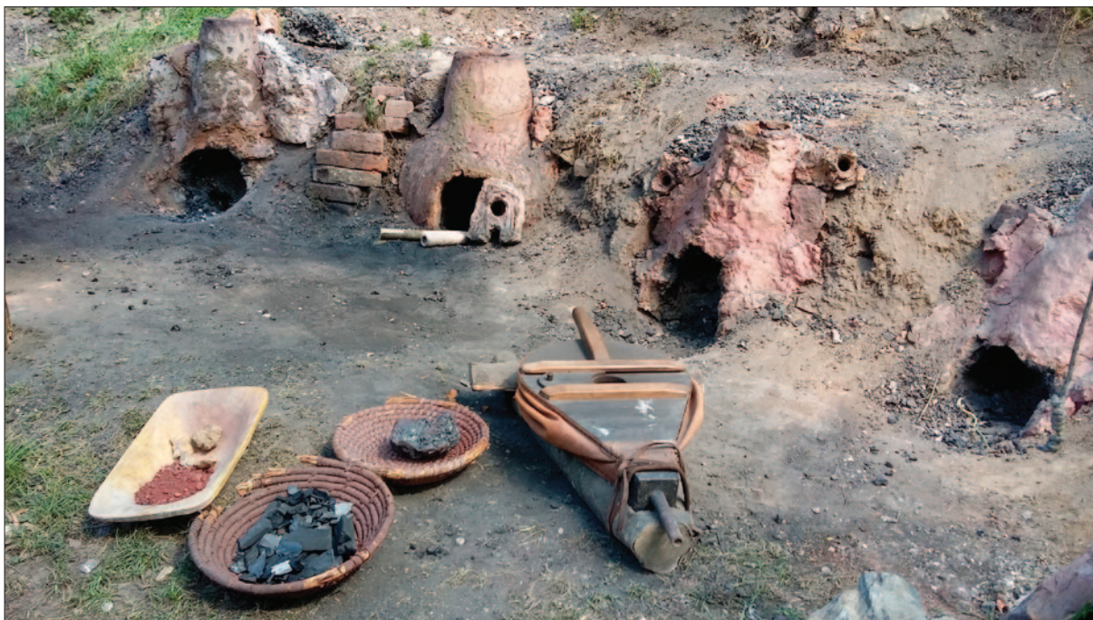
Sl. 1 Talioničke peći ukopane u padinu okolnog uzvišenja u mjestu Stará huť u Adamovu kraj Brna

Fig. 1 Smelting furnaces dug into the slopes of a nearby height in the settlement of Stará huť at Adamov near Brno