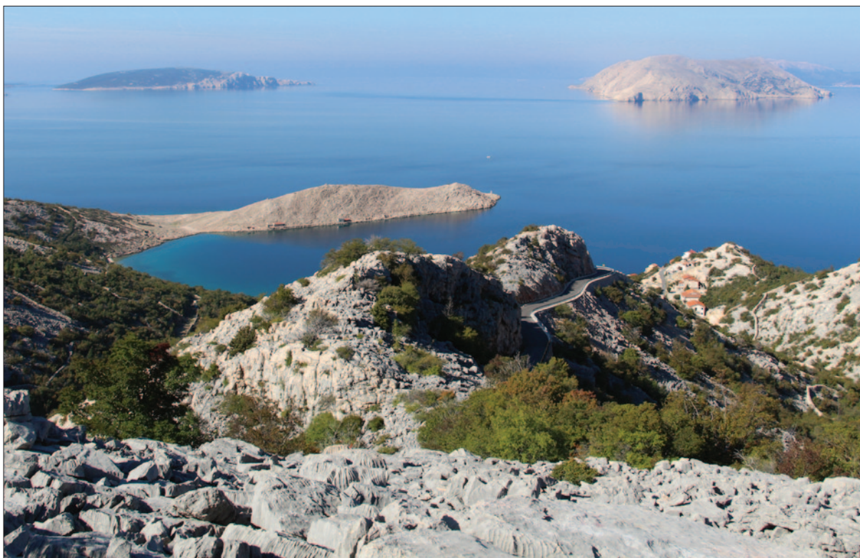
Sl. 2 Glavičica iznad Lukova – pogled na vršni dio kose