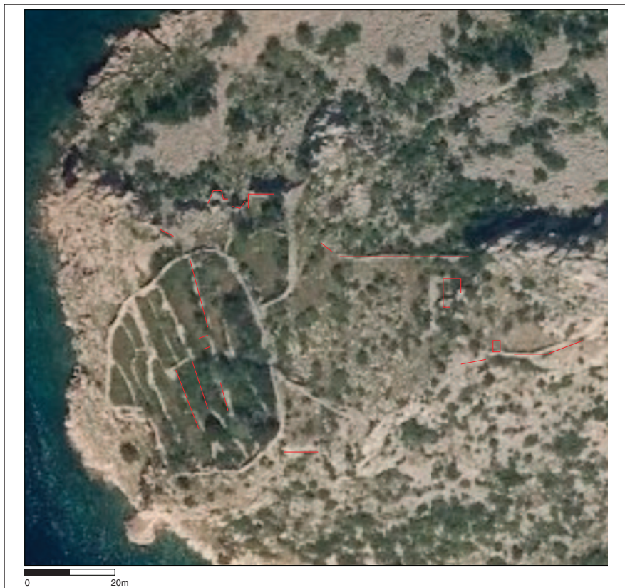
Sl. 3 Gradina kod Prizne – ortofoto s ucrtanim utvrđenim strukturama (podloga: geoportal.dgu.hr; obradila: A. Konestra)

Fig. 3 Hillfort near Prizna – orthophoto with marked visible structures (image: geoportal.dgu.hr; drawing: A. Konestra)