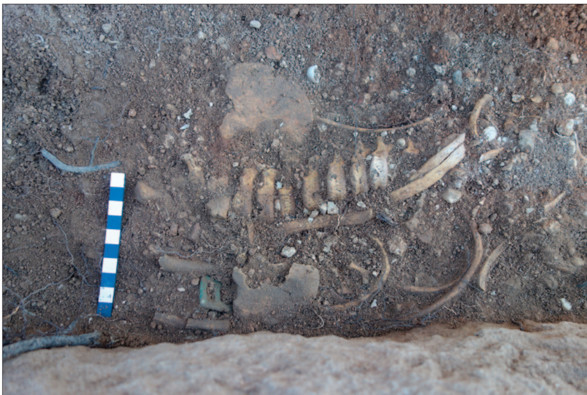
Sl. 3 Grob 1