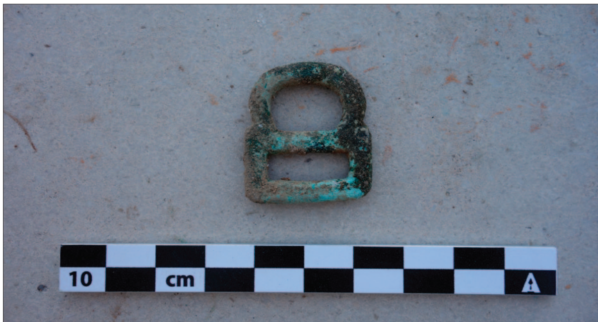
Sl. 4 Brončana kopča iz groba 1