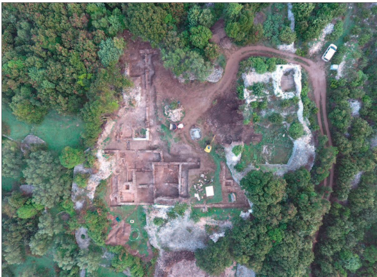
Sl. 1 Pogled na lokalitet na kraju istraživanja u listopadu 2017.

Prostorije SJ 9001 i 9011 odijeljene su zidom SJ 9004 koji se prema sjeveru nastavlja sa strukturom SJ 9023. Prema istoku u prostoriji SJ 9001 nalazi se manja