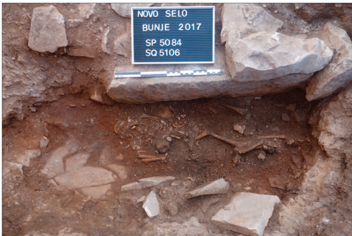
Sl. 2 Grob 1