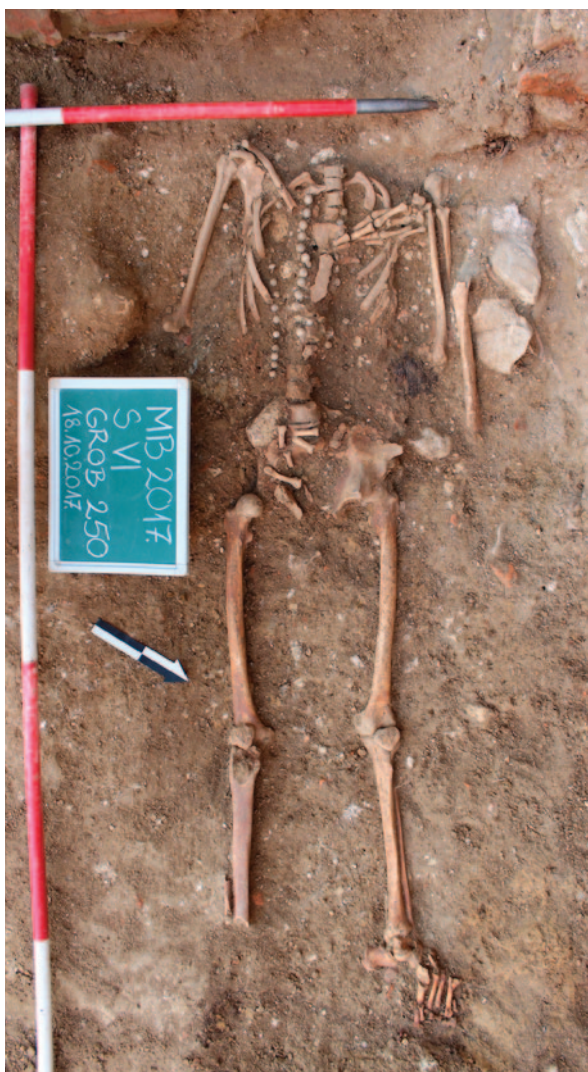
Sl. 4 Grob 250 tijekom istraživanja

Fig. 3 Larger stone structure SU 1456 and a partly buried funerary construction SU 1429 built in brick