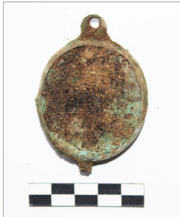
Sl. 6 PN 599 – Brončani brevar

Osim ostataka keramike, čavala, stakla i bojnih uzoraka, pronađeno je čak 368 posebnih nalaza. Razlog tako velikom broju moglo bi biti često prekopavanje i ponovno ukapanje unutar broda crkve, pri čemu su mnogi