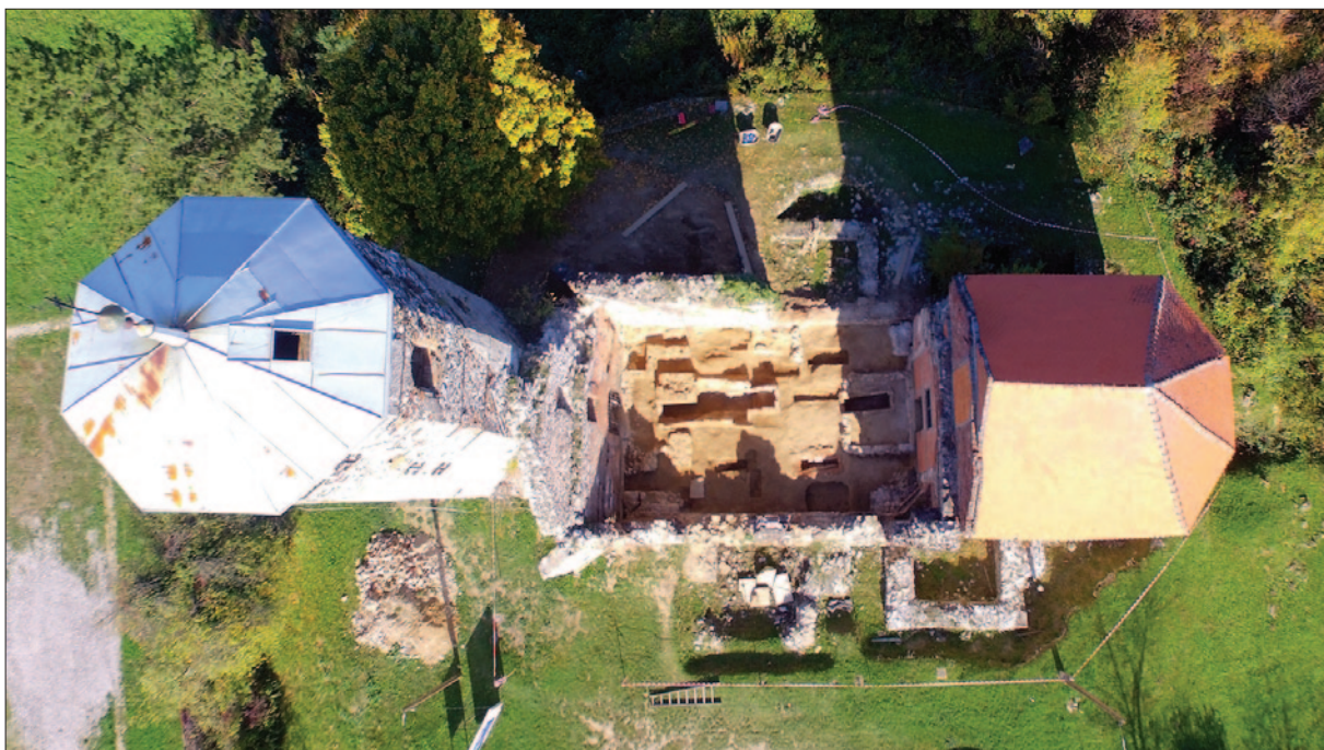
Sl. 7 Pogled na brod crkve na kraju istraživanja