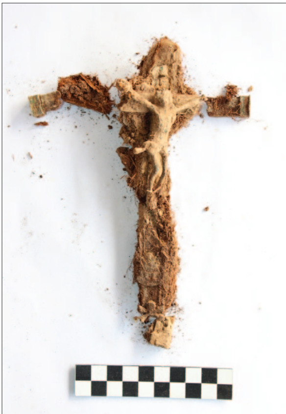
Sl. 5 PN 622 – Ukopni križ izrađen kombinacijom drva i bronce