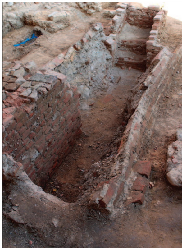
Sl. 2 Pogled s juga/jugozapada na kriptu urušenog bačvastog svoda (SJ 1421)

Grobna konstrukcija SJ 1421 ukopana je u sloj smeđe zemlje (SJ 1420), koji se prostire većim dijelom sonde i unutar kojeg se pronalaze prvi grobovi. Odmah nakon dokumentiranja i vađenja kamenih ploča dizalicom, prionulo se istraživanju grobne konstrukcije. Kao i grobna konstrukcija SJ 1429 i ova je bila izgrađena od opeke vezane žbukom, ali je bila mnogo veća, što može upućivati na to da je riječ o kripti. Također je bila bačvasto presvođena, no svod je najvećim dijelom bio urušen. Očito je i ova grobna konstrukcija bila prekopavana u 20. stoljeću jer je pronađeno mnogo recentnog otpadnog materijala. Istražena je do dubine od otprilike 1,5 m, no odlučeno je da se, zbog sigurnosti, daljnje istraživanje grobne konstrukcije ostavi za nadolazeće kampanje, nakon što se spusti okolna razina zemlje. Na dosegnutoj dubini, zbog veće koncentracije kostiju, mogli bi se očekivati grobovi. Ulaz u kriptu nalazio se na njenom istočnom dijelu, na što upućuju stubi izrađene također od opeke, koja je