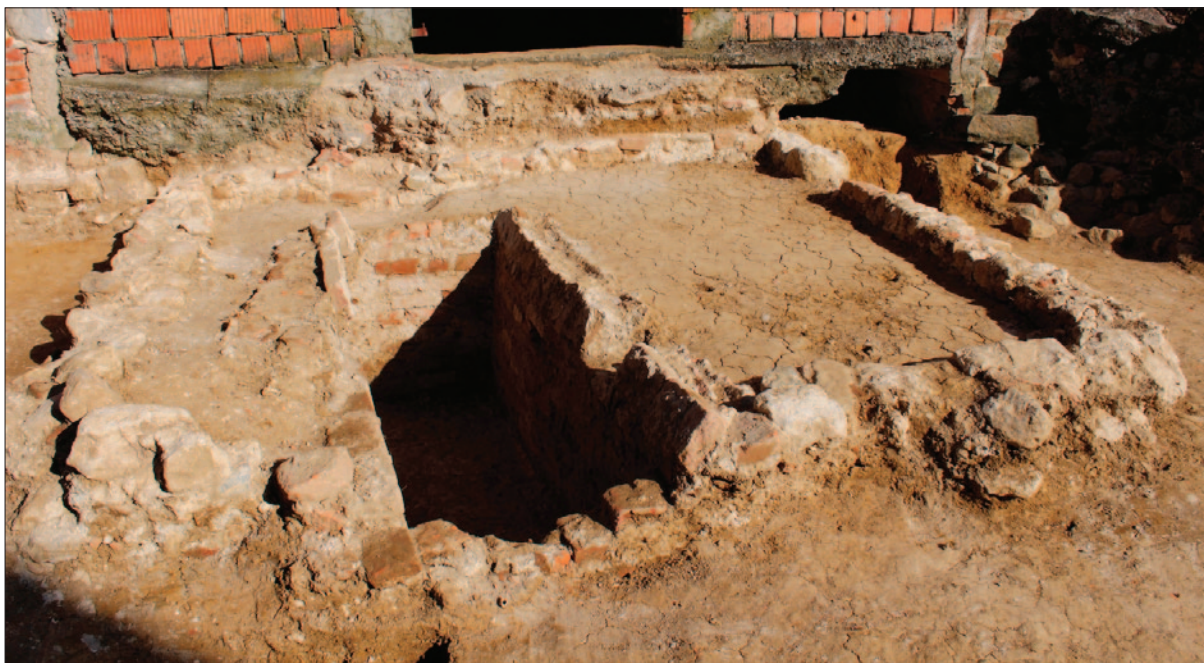
Sl. 3 Veća kamena struktura SJ 1456 te u nju djelom ukopana grobna konstrukcija SJ 1429 izrađena od opeke (istočni dio broda)

Fig. 3 Larger stone structure SU 1456 and a partly buried funerary construction SU 1429 built in brick