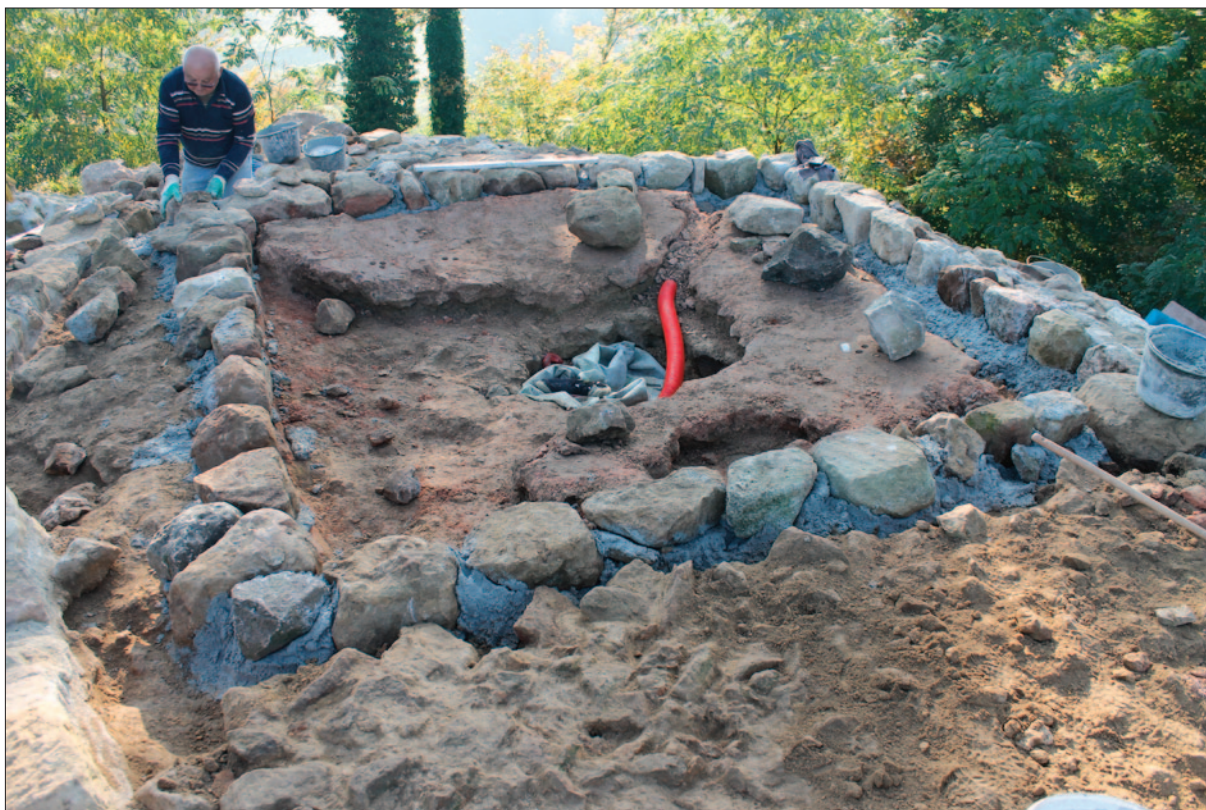
Sl. 3 Konzervacija i rekonstrukcija unutrašnjih lica zidova na vrhu kule, pogled od zapada

Unutrašnjost kule s podnicama zaštićena je daskama i geotekstilom do budućih arheološko-konzervatorskih radova (sl. 4).