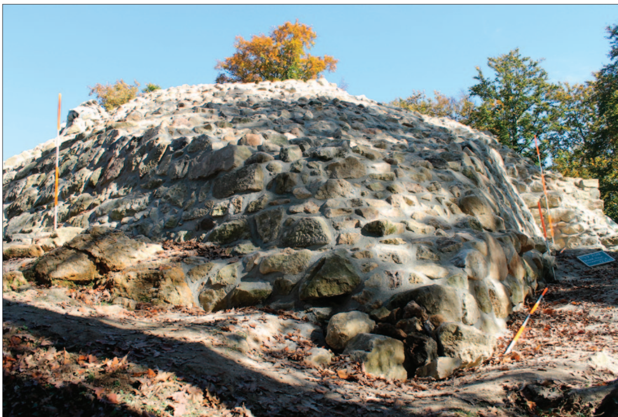
Sl. 1 Pogled s jugozapada na konzerviranu branič-kulu

Fig. 1 View on the keep from the southwest after the conservation works