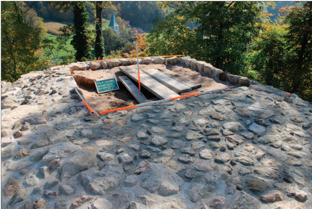
Sl. 4 Vrh kule nakon provedenih konzervatorskih radova, pogled od zapada