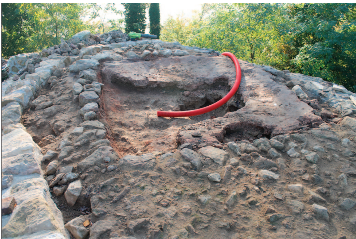
Sl. 2 Vrh kule s ostacima dviju podnica u njezinoj unutrašnjosti prije konzervatorskih radova, pogled od zapada

Fig. 1 View on the keep from the southwest after the conservation works