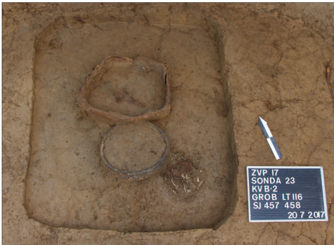
Sl. 1 Grob LT 116