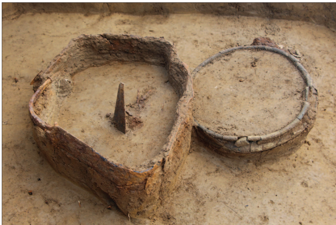
Sl. 2 Detalj groba LT 116 – pokop ratnika