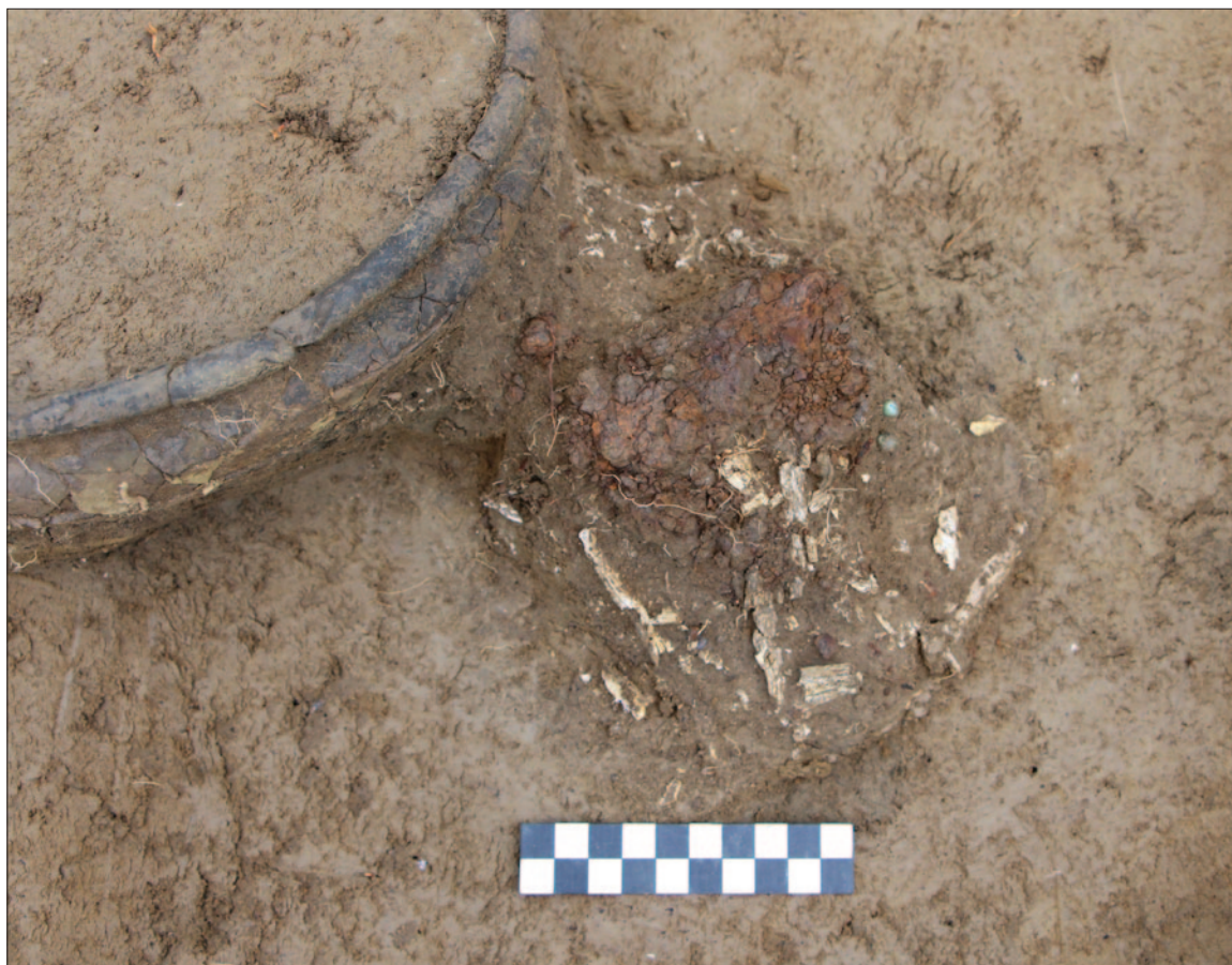
Sl. 3 Detalj groba LT 116 – pokop žene