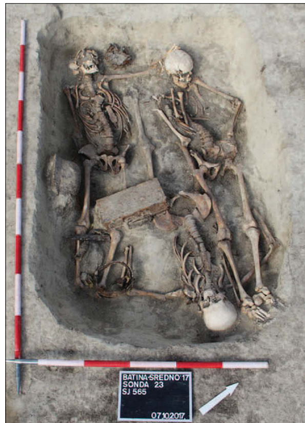
Sl. 3 Ukop vojnika s kraja II. svjetskoga rata

U istočnome dijelu sonde, u većoj pravokutnoj grobnoj jami, pronađeni su posmrtni ostaci tri vojnika s kraja II. svjetskoga rata uz koje su još pronađeni veća količina osobnoga naoružanja i streljiva, zatim osobni predmeti te dijelovi uniformi (sl. 3). Poginuli vojnici vjerojatno su pokopani na Srednom tijekom Batinske bitke koja se odvijala u studenome 1944. godine, a s kojom se mogu povezati i brojni nalazi naoružanja i streljiva koji su pronađeni tijekom istraživanja tumula 1 i 2 smještenih na samome sjevernom rubu položaja Sredno, neposredno uz surduk koji je Sredno dijelio od naselja na Gracu. Ostale dokumentirane cijeline u sondi 21 nisu sadržavale nalaze te ih nije moguće uže kronološki odrediti, iako sustavi ka-