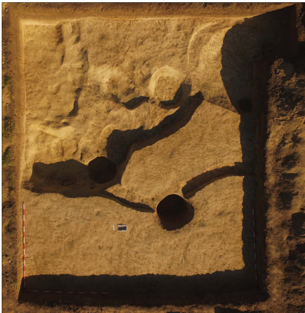
Sl. 4 Sonda 22