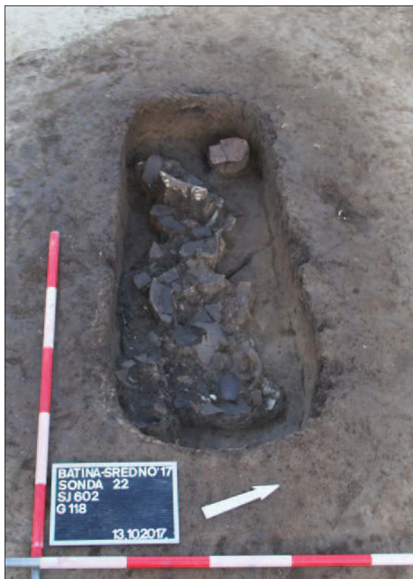
Sl. 5 Grob 118