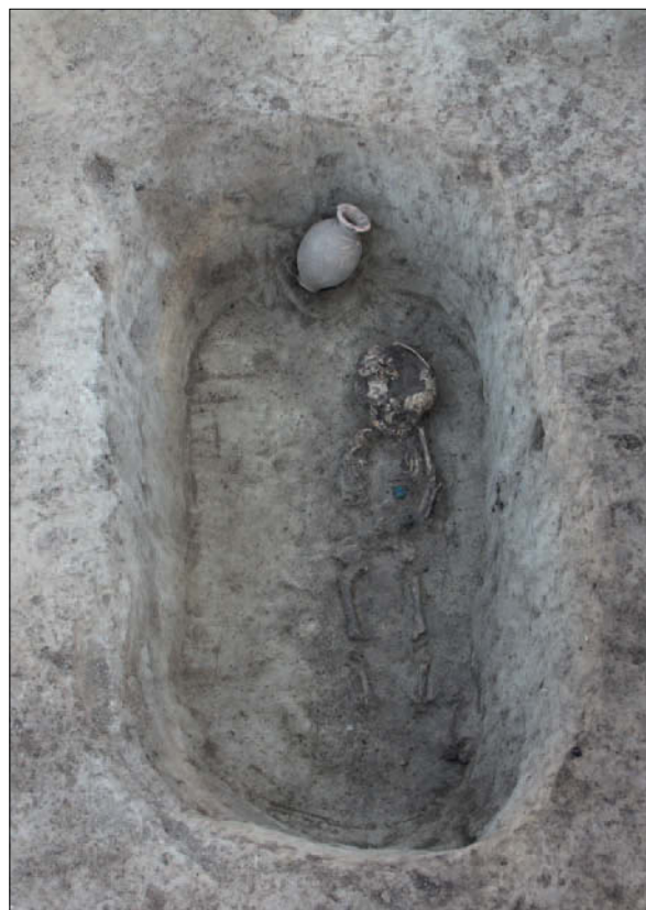
Sl. 6 Grob 116