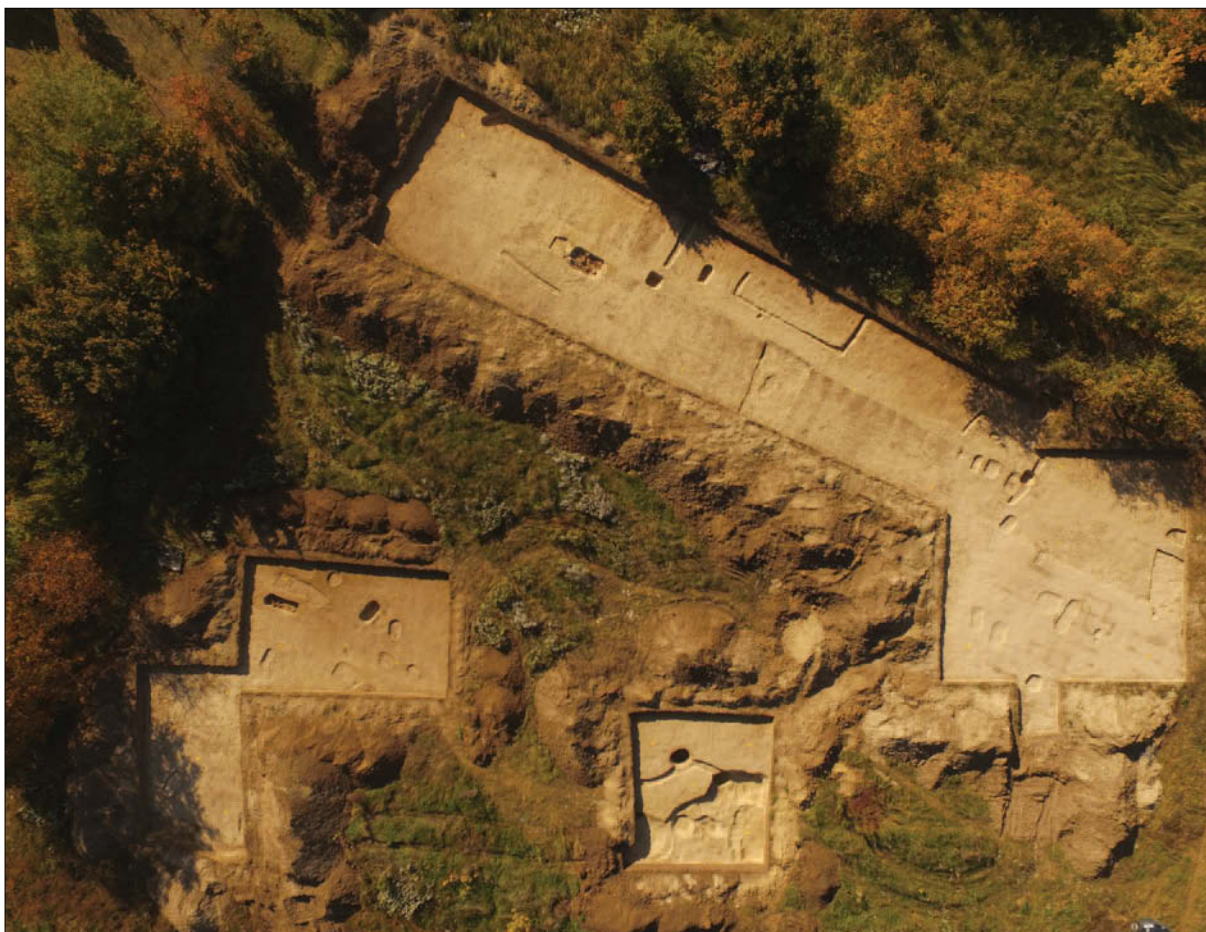
Sl. 1 Zračni snimak terena