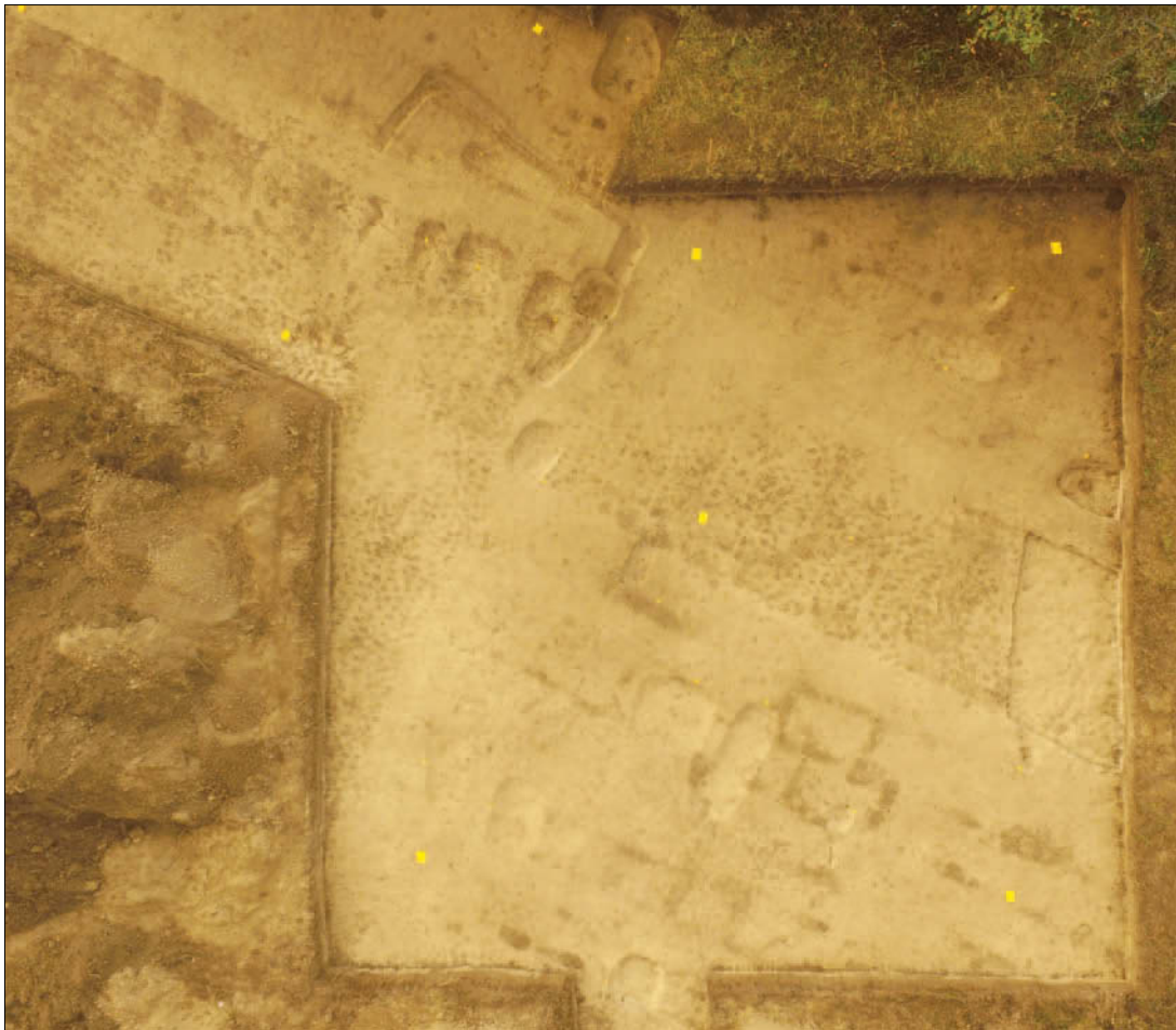
Sl. 2 Sonda 20