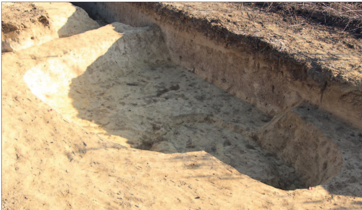
Sl. 5 Ukop kasnolatenske zemunice SJ 69