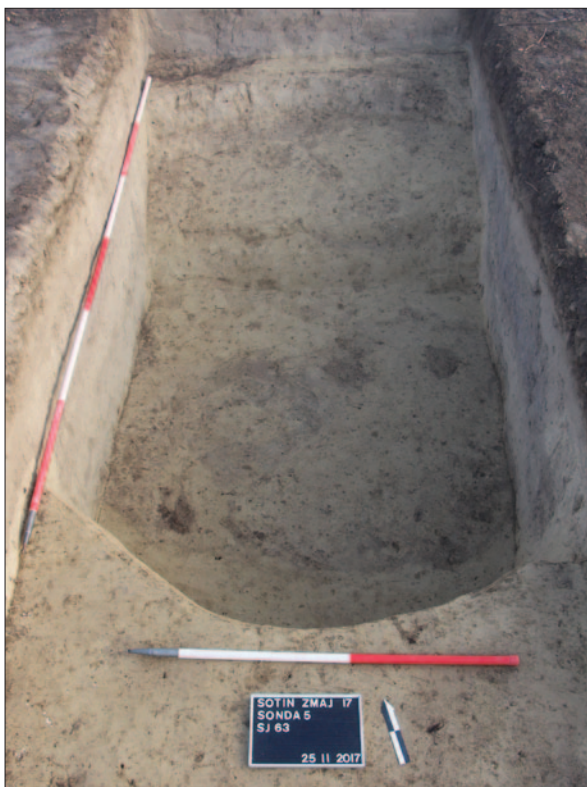
Sl. 7 Ukop kasnosrednjovjekovne jame SJ 63

Fig. 7 Late Medieval pit SU 63