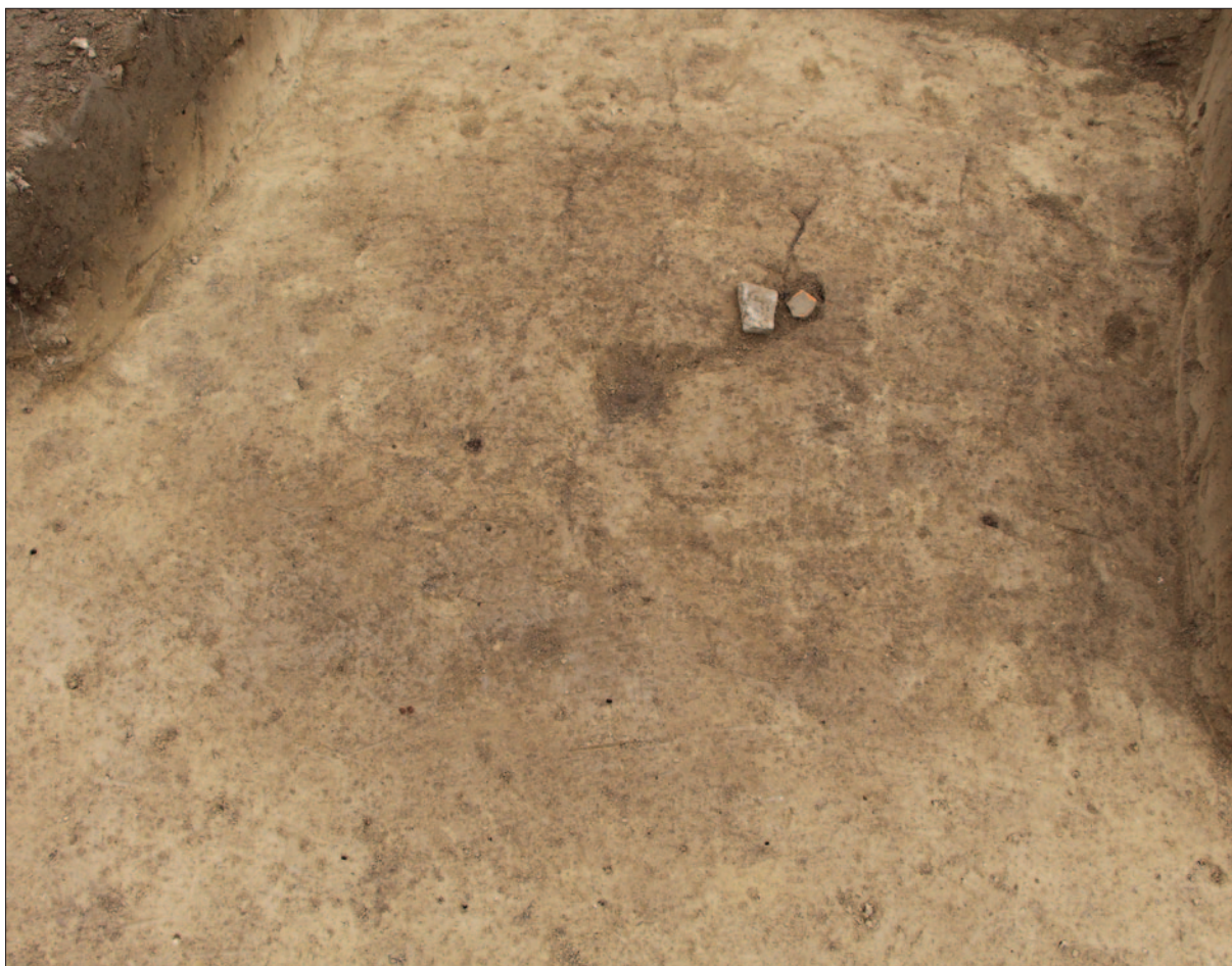
Sl. 3 Zapuna kasnotatenske jame SJ 77 u sondi 4

Fig. 3 Filling of the Late La Tène pit SU 77 in the trench 4