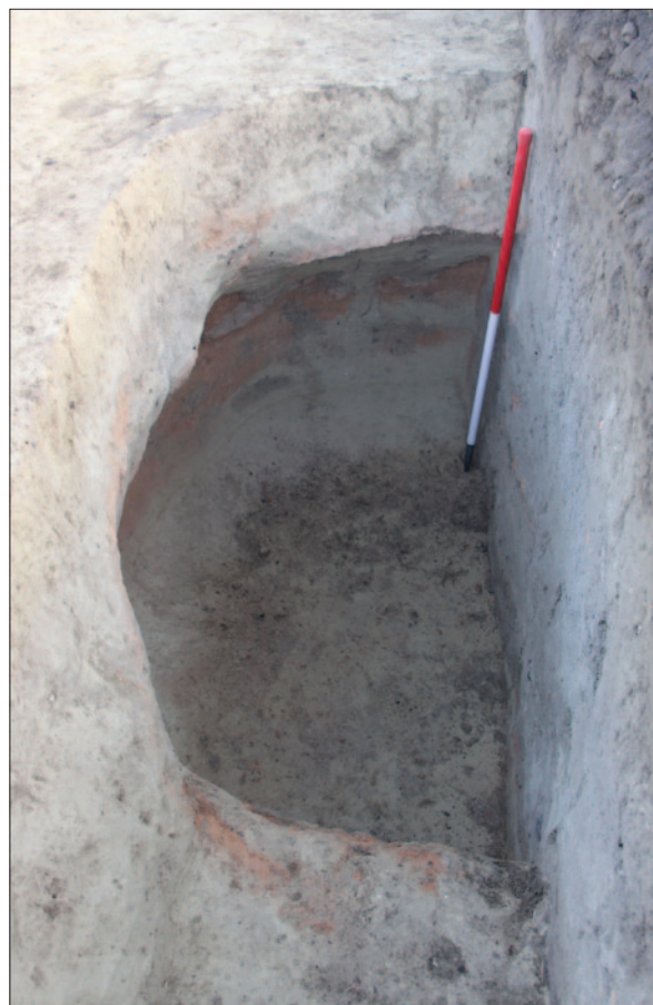
Sl. 8 Ostaci peći u kasnosrednjovjekovnoj zemunici SJ 65

Kasnom latenu vjerojatno pripadaju i ukopi zemunica u južnome dijelu sonde 5 od kojih je istražen samo zapadni rubni dio, dok se njihov ostatak najvećim dijelom nalazio na susjednoj oranici na kojoj nije bila moguća provedba iskopavanja. U zapuni jedne od zemunica pronađeni su i ulomci keramike iz kasnoga bronzanog doba (Belegiš II kultura), što pokazuje kako se na položaju Zmajevac vjerojatno nalazilo i kasnobrončanodobno naselje.