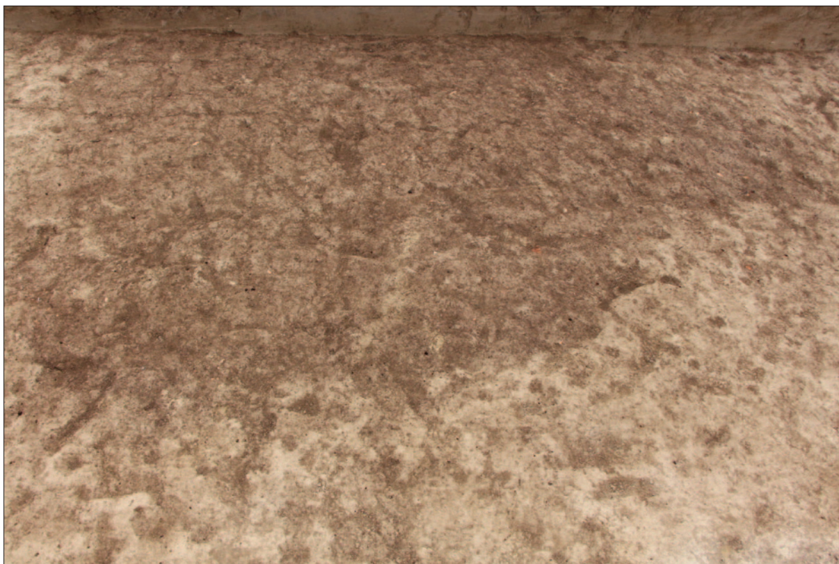
Sl. 4 Zapuna kasnotatenske zemunice SJ 69 i jame SJ 71 u sondi 5

Fig. 3 Filling of the Late La Tène pit SU 77 in the trench 4