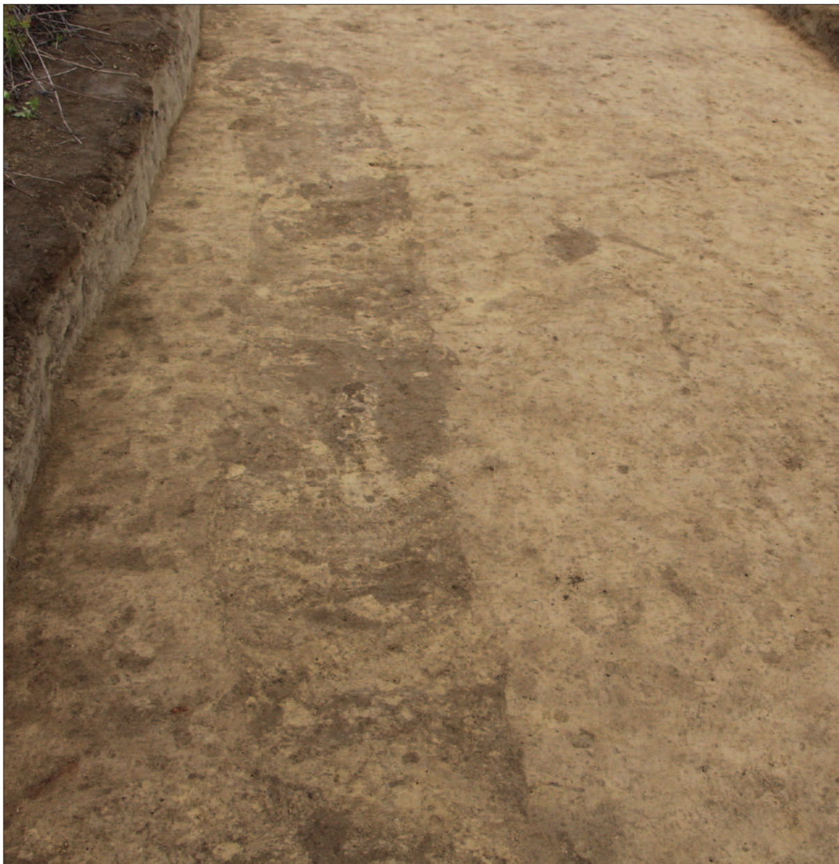
Sl. 9 Pogled na južni dio sonde 4 sa zapunom rova SJ 83 iz II. svjetskoga rata