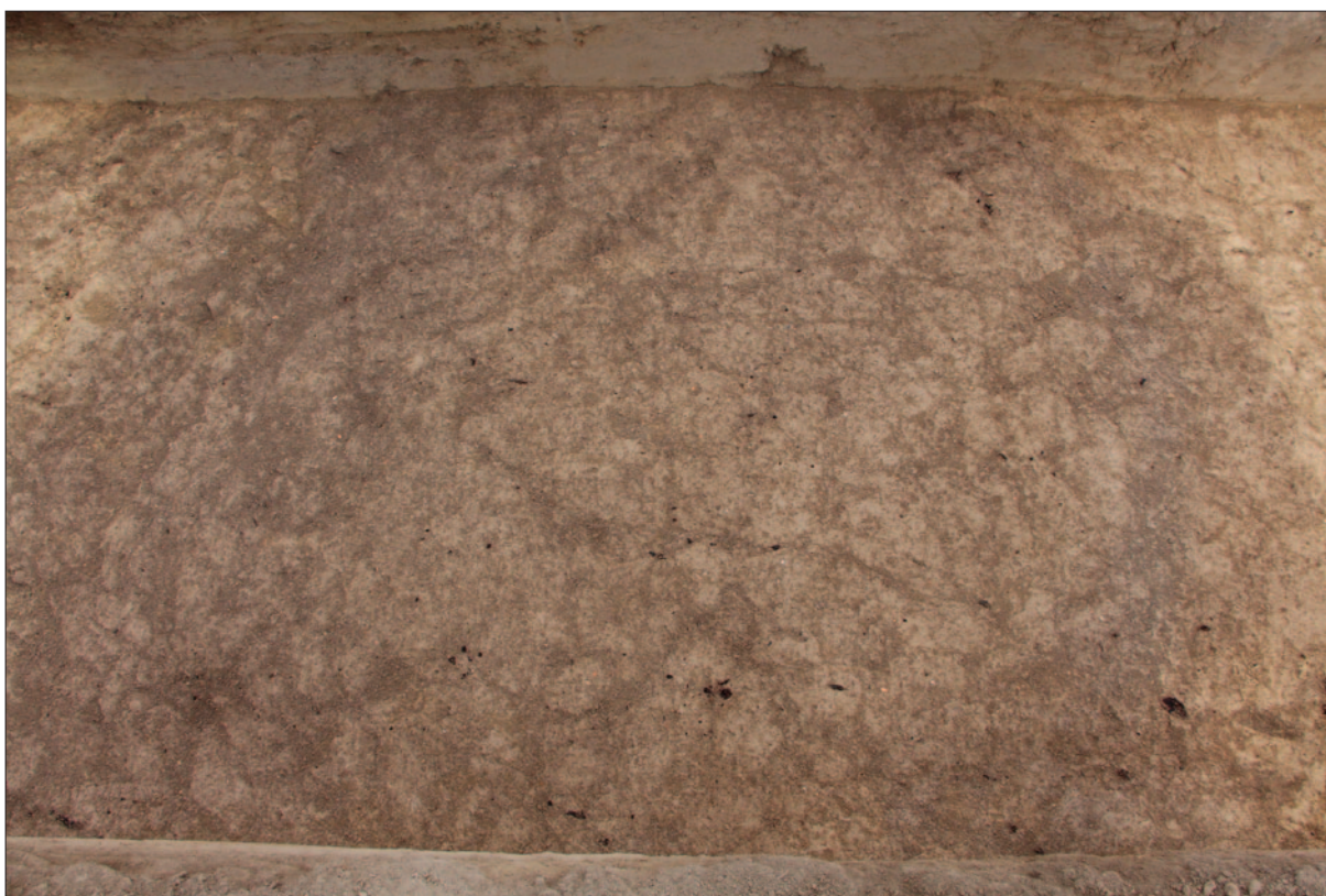
Sl. 6 Zapuna kasnosrednjovjekovne jame SJ 63