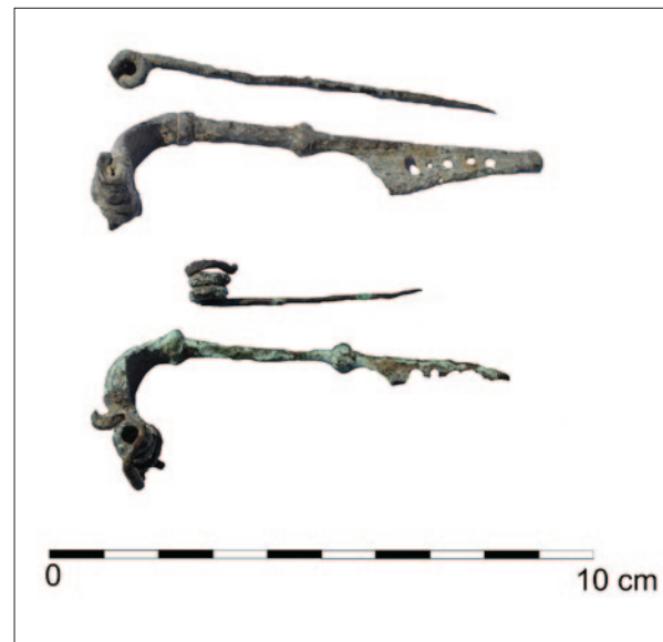
Sl. 6 Fibule noričko-panonskoga tipa

Novog Čiča, Bučevca, Veleševca, Turopoljskog luga (Vojvoda 1997: 8) te tijekom brojnih arheoloških iskopavanja koja su provedena prije opsežnih infrastrukturnih radova kojima je u novije vrijeme područje Turopolja bilo intenzivno podvrgnuto. Stoga je moguće pretpostaviti kako je cijeli taj prostor u rimsko doba bio aktivno korišten, dok o intenzitetu života na užem području Kurilovca svjedoče brojni slučajni nalazi. Najčešće su otkrivani tijekom građevinskih radova, osobito u ulici Bana Jelačića koja se nalazi tek 500 metara istočno od nalazišta Kurilovec – Belinščica. Do sada nepoznati nalazi s istoga prostora dvije su rimskodobne fibule (sl. 6) noričko-panonskoga tipa s dva diska na luku i perforiranim držačem koje se datiraju u rano 1. st. (Koščević 1980: 72; T. 8: 50–52). 4