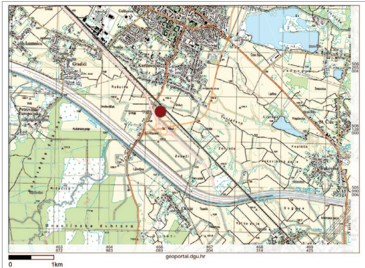
Sl. 1 Položaj nalazišta Kurilovec – Belinščica (izradió: D. Tresić Pavičić; podloga: TK25, DGU)

Sjeverozapadno od kanala, u zapunama manjih ukopa, nađen je keramički materijal koji sadrži stilske i tehnološke karakteristike ranobrončanodobne lončarije, odnosno koje odudaraju od standardnih obilježja keramičkih posuda kulturne grupe Virovitica kojoj je pripisano brončanodobno naselje na položaju Kurilovec – Belinščica. Iako njihovo preciznije kronološko i kulturološko određenje za sada nije moguće, pojava toga materijala ukazuje na složenost aktivnosti provedenih na ovome položaju kroz cijelo brončano doba te upućuje na specifičan utjecaj prirodnih obilježja na načine njegova korištenja.