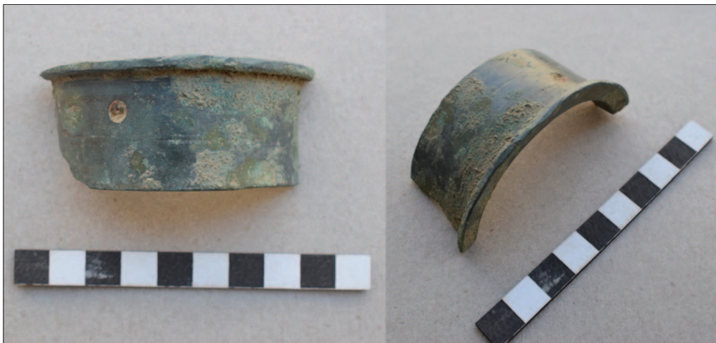
Sl. 5 Fragment brončane glavine kotača