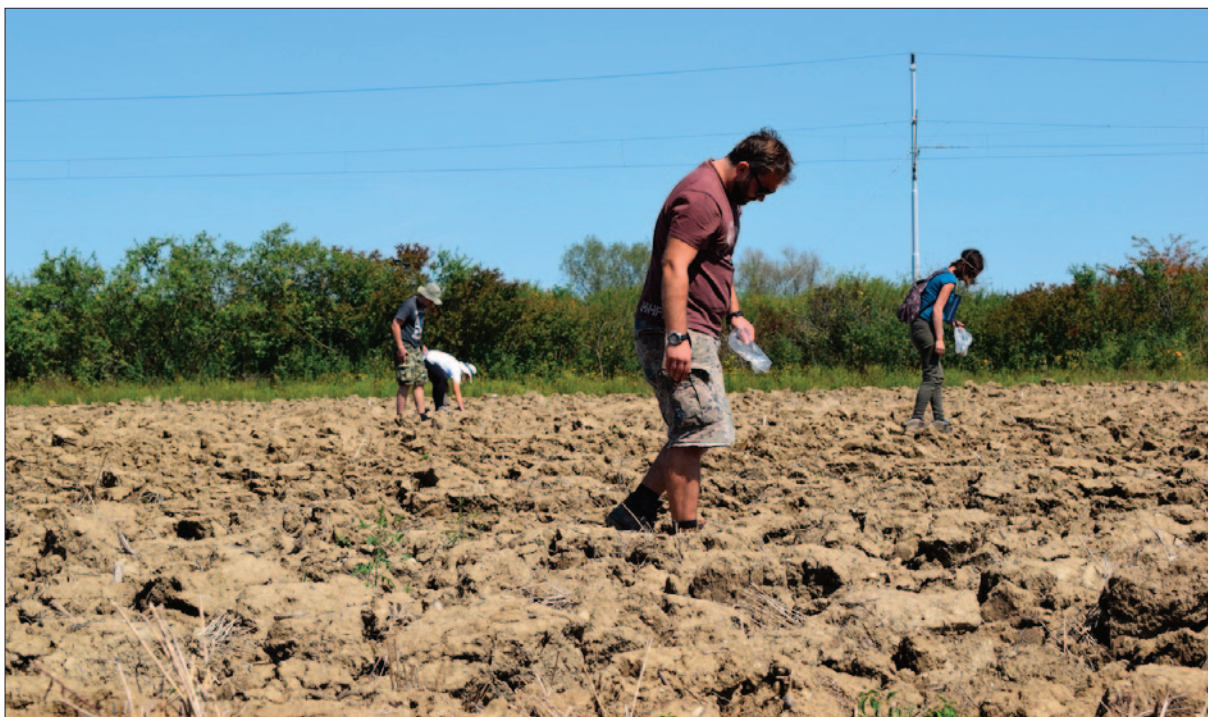
Sl. 2 Sustavni terenski pregled, kolovoz 2018. godine