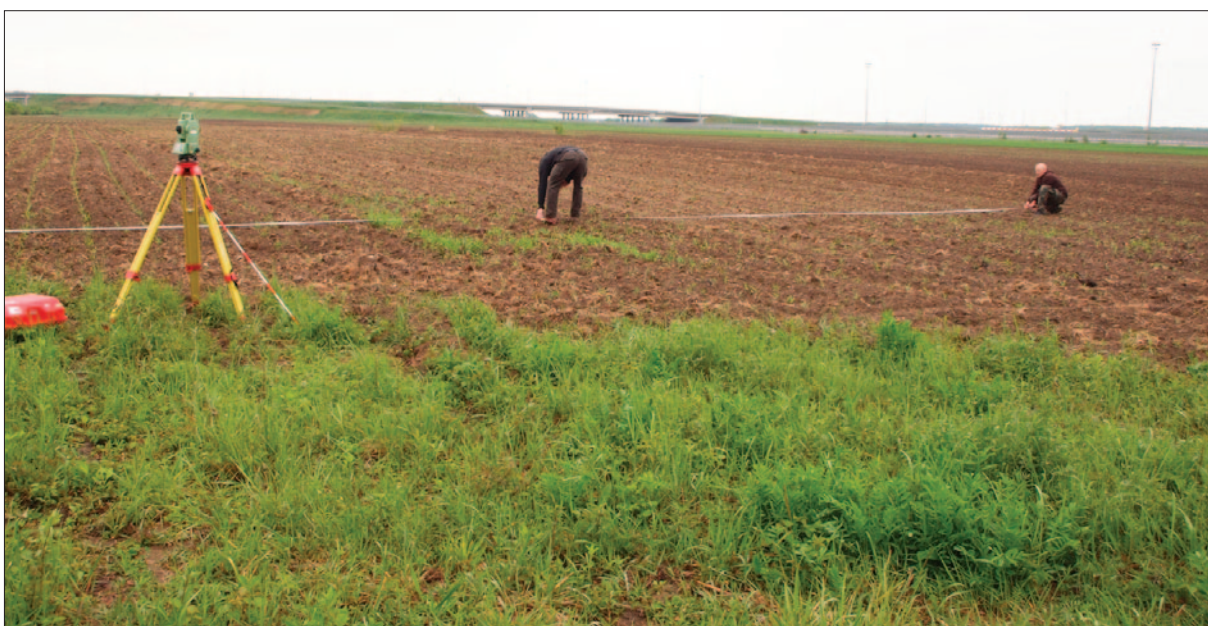
Sl. 3 Postavljanje kvadratne mreže, svibanj 2017.

Iako su digitalizacija i obrada prikupljenih podataka još uvijek u tijeku, na temelju preliminarne analize prikupljenih podataka mogu se naslutiti područja s intenzivnijom pojavom površinskoga arheološkog materijala kao i ona na kojima učestalost primjetno opada. Izrazitija pojava materijala poklapa se s pružanjem manjega uzviše-