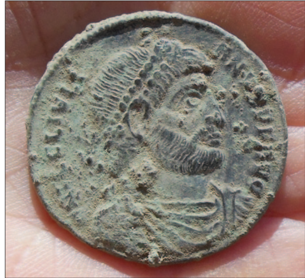
Sl. 5 Novac cara Julijana

podarskome kompleksu. Značajan je nalaz novca cara Julijana (361.–363.) u odličnom stanju i drugoga kasnorimskog novca (mogući skupni nalaz, ostava) ukupan u sloju s brojnim sitnim i krupnijim ulomcima fresaka, očito iz neke ranije faze, odbačene tijekom pregradnje ili prenamijenjene u tome arealu. Nedavno objavljeni članak i katalog numizmatičkih nalaza sa Solina koji datiraju iz vremena od 3. st. pr. Kr. do kasne antike, ukazuju na dugotrajnost i važnost ovoga lokaliteta (Ugarković, Visković 2019). Ti nalazi jasno pokazuju kako je ekonomska i tranzitno-pomorska uloga ove maritimne vile bila najintenzivnija u kasnoj antici.