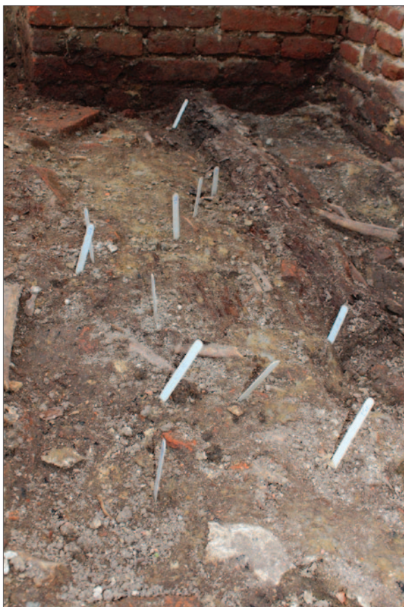
Sl.7 Pogled s istoka na kriptu SJ 1421 tijekom istraživanja s označenim pozicijama posebnih nalaza