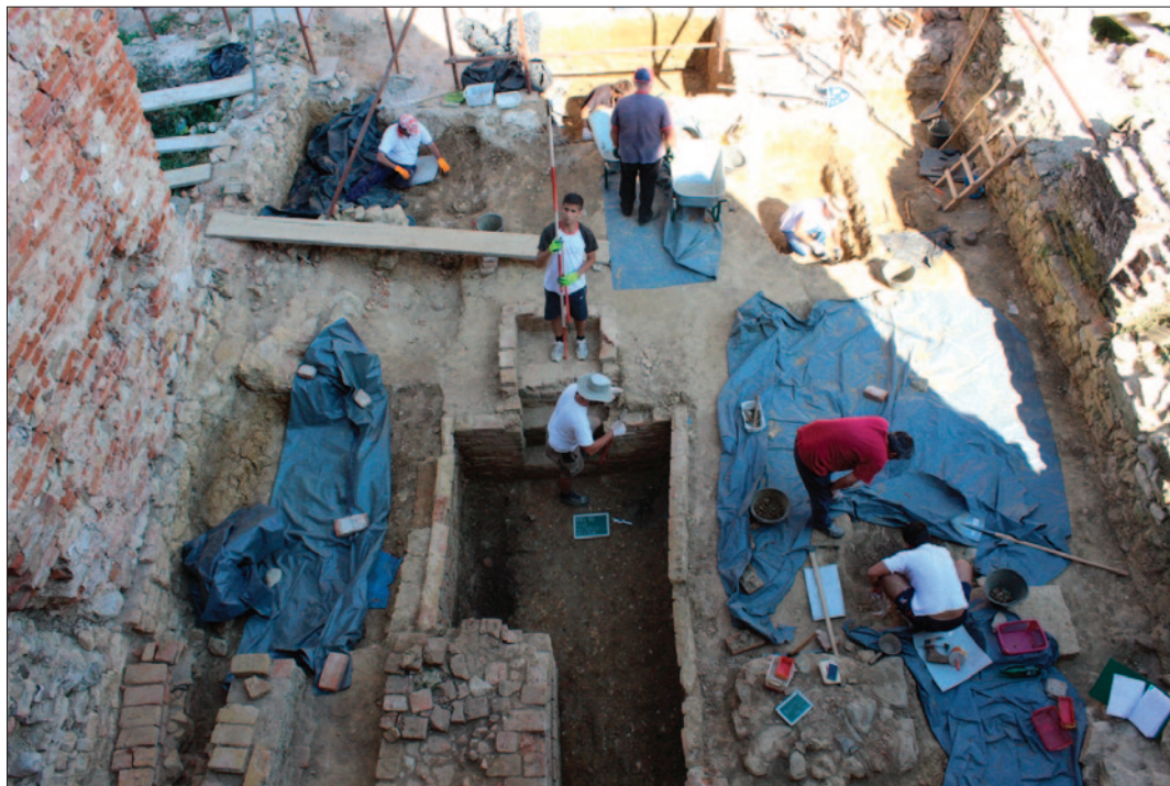
Sl. 1 Pogled na brod crkve tijekom istraživanja