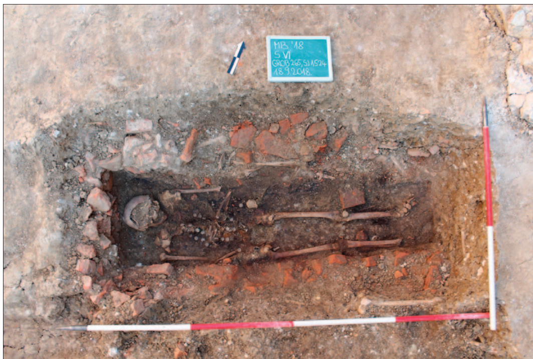
Sl. 2 Grob 265