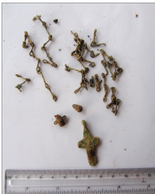
Sl. 3 Posebni nalazi iz groba 265 (PN 827)