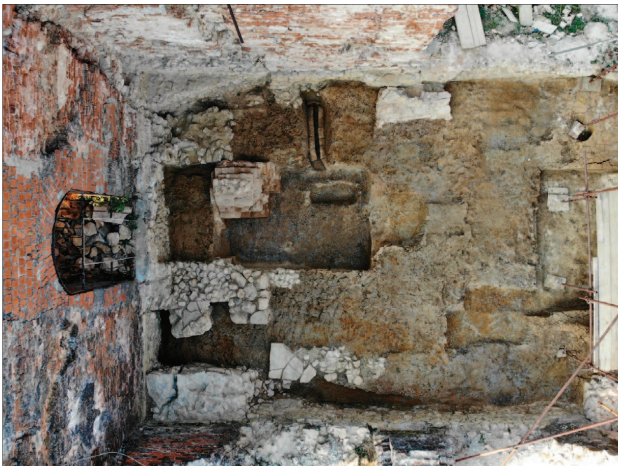
Sl. 6 Pogled na brod crkve na kraju istraživanja

Iz zapadnoga zida broda crkve, u smjeru istoka, pružaju se dva zida (SJ 1598 i 1603) izgrađena od nepravilnoga kamenja bijele i bijelo-sive boje međusobno povezanog žutom ili žutozelenkastom žbukom. Za sada