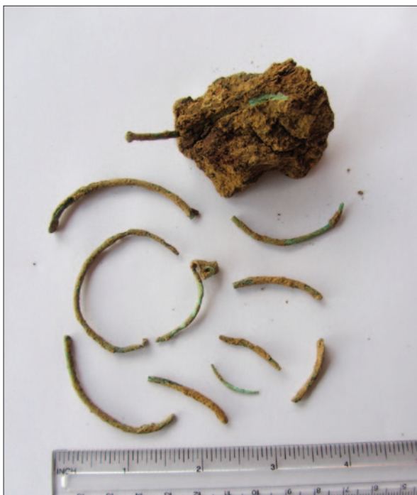
Sl. 5 S-karičice iz groba 293 (PN 1115)

Fig. 5 Temple rings with S-shaped terminals from grave 293 (SF 1115)