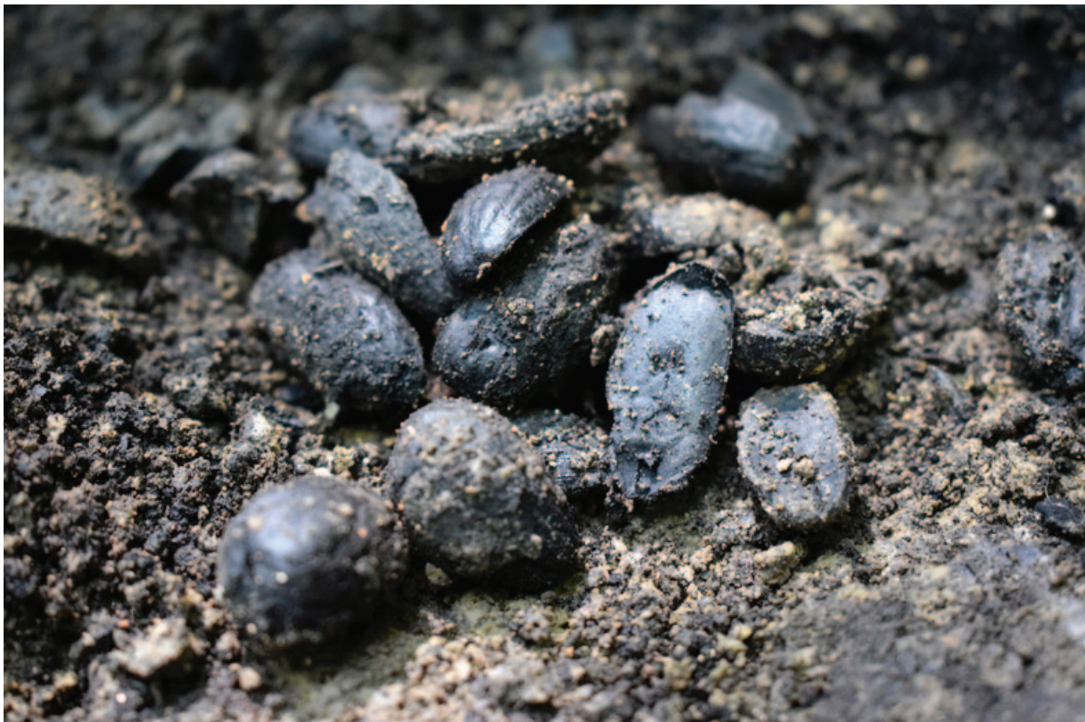
Sl. 2 Karbonizirane žitarice i žirevi pronađeni su u manjim i većim nakupinama te se pretpostavlja da su bili pohranjeni u vreće načinjene od organskog materijala (snimila: A. Kudelić)

Sa sjeverne i istočne strane definiran je rub ukopa koji je napravljen radi niveliranja prostora kako bi se omogućila gradnja ovog objekta. Na padini sjeveroistočnog ugla tog ukopa dokumentirano je urušenje sastavljeno od isključivo kućnog lijepa pri čemu je djelomično spaljena i padina odnosno stijenka ukopa koja je uslijed