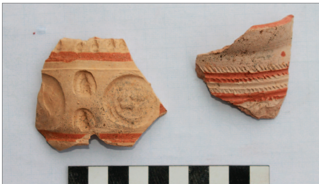
Sl. 8 Ulomci čaša ukrašenih biblijskim motivima iz SJ 9 i SJ 10

Početak života na utvrđi seže do u drugu polovicu 13. st. Već tada je vlasnik lokaliteta vjerojatno imao visoki standard što se očituje u pronalasku urušene kaljeve