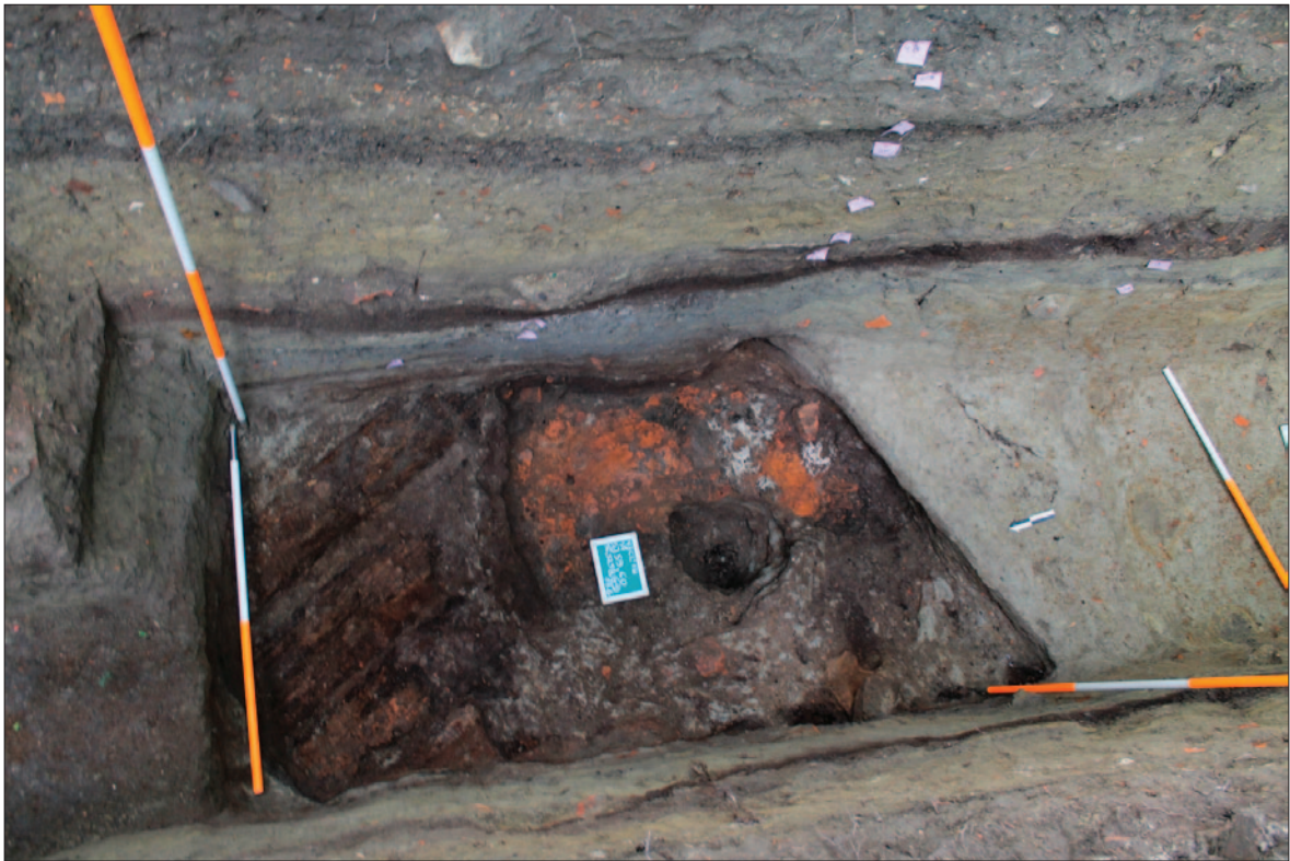
Sl. 5 Sloj SJ 36 u sjevernome dijelu sonde: lijevo – ostaci drvenih dasaka i greda, desno – niz stupova u kanalu SJ 75/76, pogled sa zapada Fig. 5 Layer SU 36 in the north part of the trench: left – the remains of wooden planks and beams, right – a series of post-holes in the channel SU 75/76, view from the west