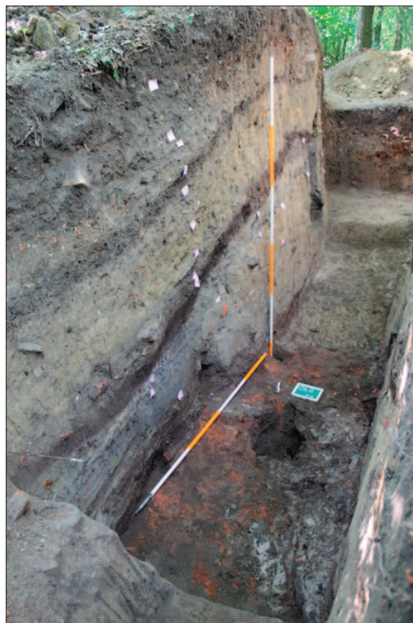
Sl. 4 Sloj SJ 59 u sjevernome dijelu sonde, pogled sa sjevera

U toj fazi događaju se i građevinske intervencije – počinje se podizati zemljani nasip koji se sada nalazi na rubu središnjega uzvišenja utvrde kakvu poznajemo u