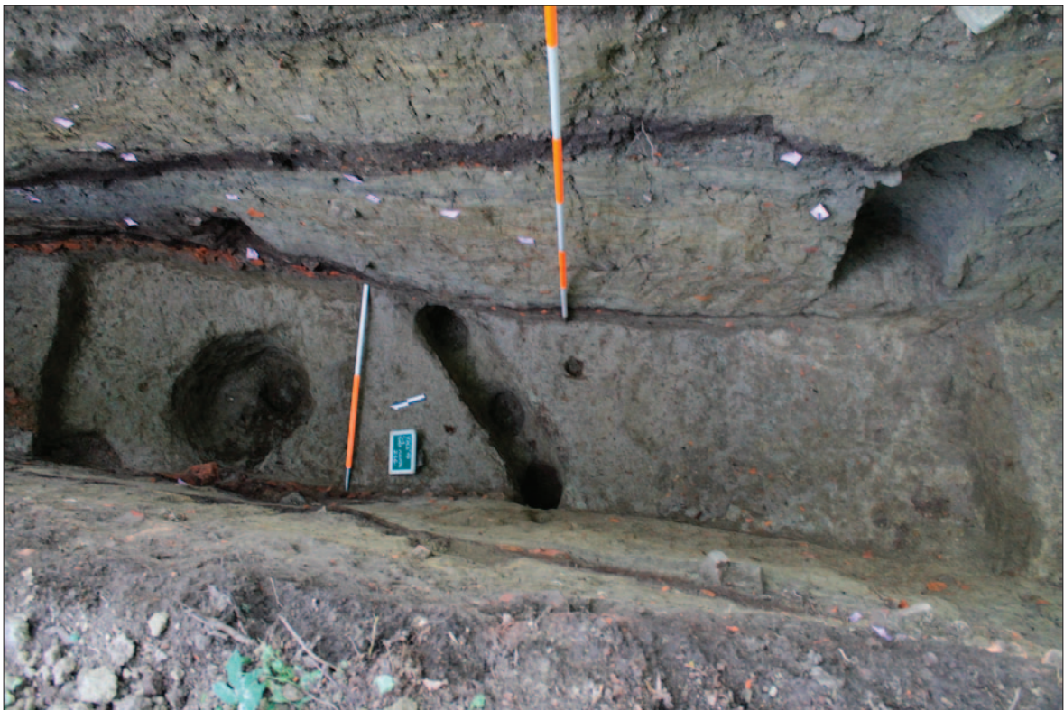
Sl. 6 Pogled na dno iskopa s ostacima rupa od stupova (u sredini kanal SJ 75/76 s nizom rupa od stupova) Fig. 6 View of the bottom of the trench with the remains of the post-holes (in the middle channel SU 75/76 with a series of post-holes)