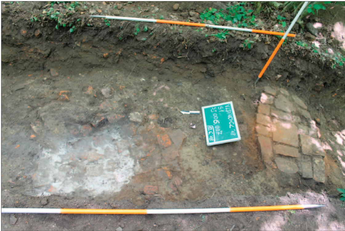
Sl. 9 Strukture SJ 7 (lijevo) i SJ 6 (desno), pogled sa zapada