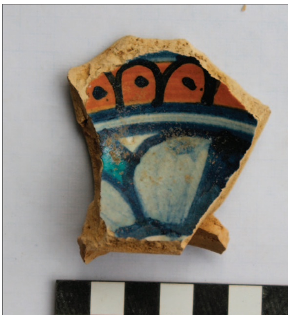
Sl. 7 Ulomak majoličke posude iz sloja SJ 15