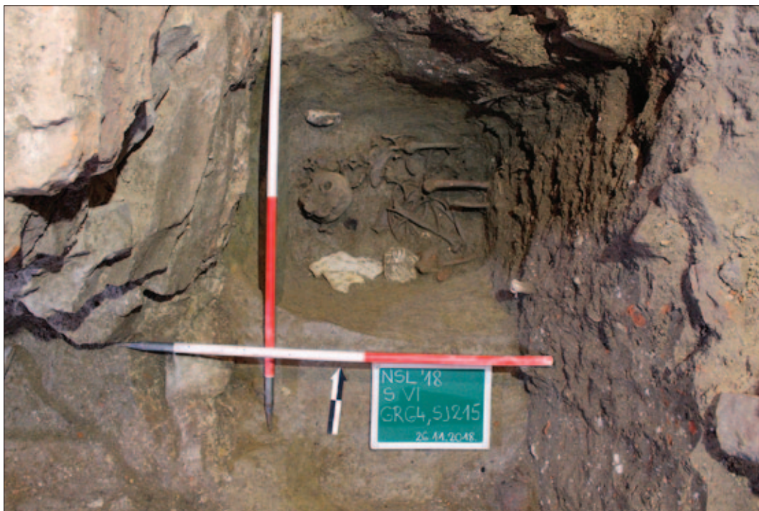
Sl. 17 Grob 64