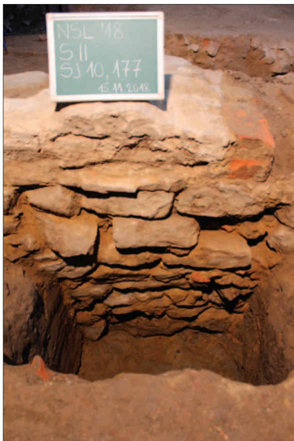
Sl. 20 Probna sonda u sektoru II, pogled sa zapada na sondu i zid SJ 10 s temeljem SJ 171