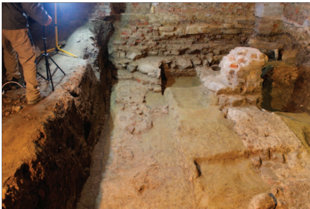
Sl. 14 Pogled s juga na sjeverni (SJ 283; u pozadini), pročelni (SJ 284; lijevo) i zid triforija (SJ 171/11; desno) starije crkve. U produžetku pročelnoga zida vidljiv je u zdravicu utisnut sloj žbuke SJ 212 preostao nakon razgradnje središnjega dijela zida. Nad sjevernim zidom vidi se struktura od većih kamenih blokova SJ 286