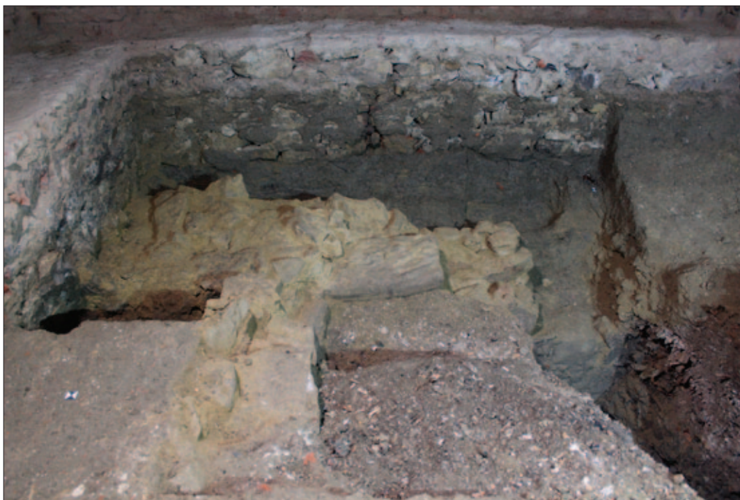
Sl. 18 Pogled s juga na sektor III tijekom istraživanja. Vidljivi su ostaci temelja SJ 241 i 242 te sloj spaljenih kostiju SJ 261