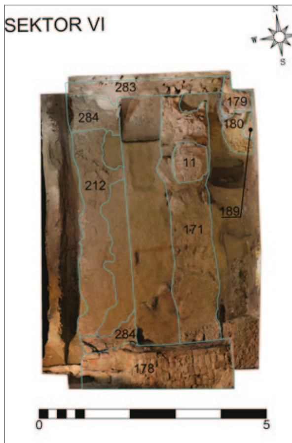
Sl. 10 Sektor VI, tlocrt s ucrtanim ostacima arhitekture (izradio: M. Babeli; 3D model u podlozi izradila: V. Gligora)