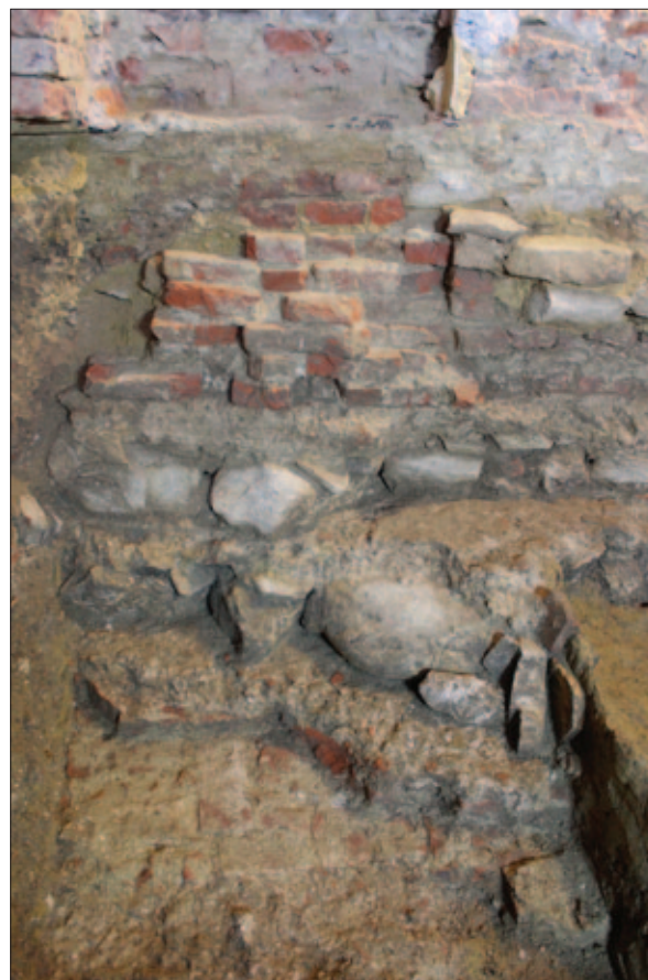
Sl. 11 Spoj sjevernoga (SJ 283) i pročelnoga (SJ 284) zida najstarije crkve