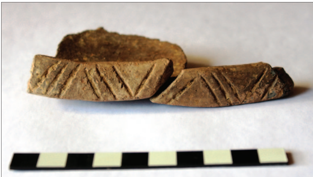
Sl. 25 Ulomci keramičkih posuda vinkovačke kulture (snimio: J. Belaj) Fig. 25 Fragments of ceramic vessels of the Vinkovci culture (photo: J. Belaj)

U istraživanjima su prikupljene 272 vrećice uzoraka. Uglavnom je riječ o ljudskim kostima iz grobova i slojeva te o ponekoj životinjskoj kosti ili zubu, komadima žbuke i ugljena te uzorcima tkanine, troske, zemlje i sl. Odabrani nalazi bit će poslani na daljnje analize, osobito osteološki materijali iz grobova. Tako ćemo doznati više o načinu života novljanskoga stanovništva tijekom kasnoga srednjeg i ranoga novog vijeka.