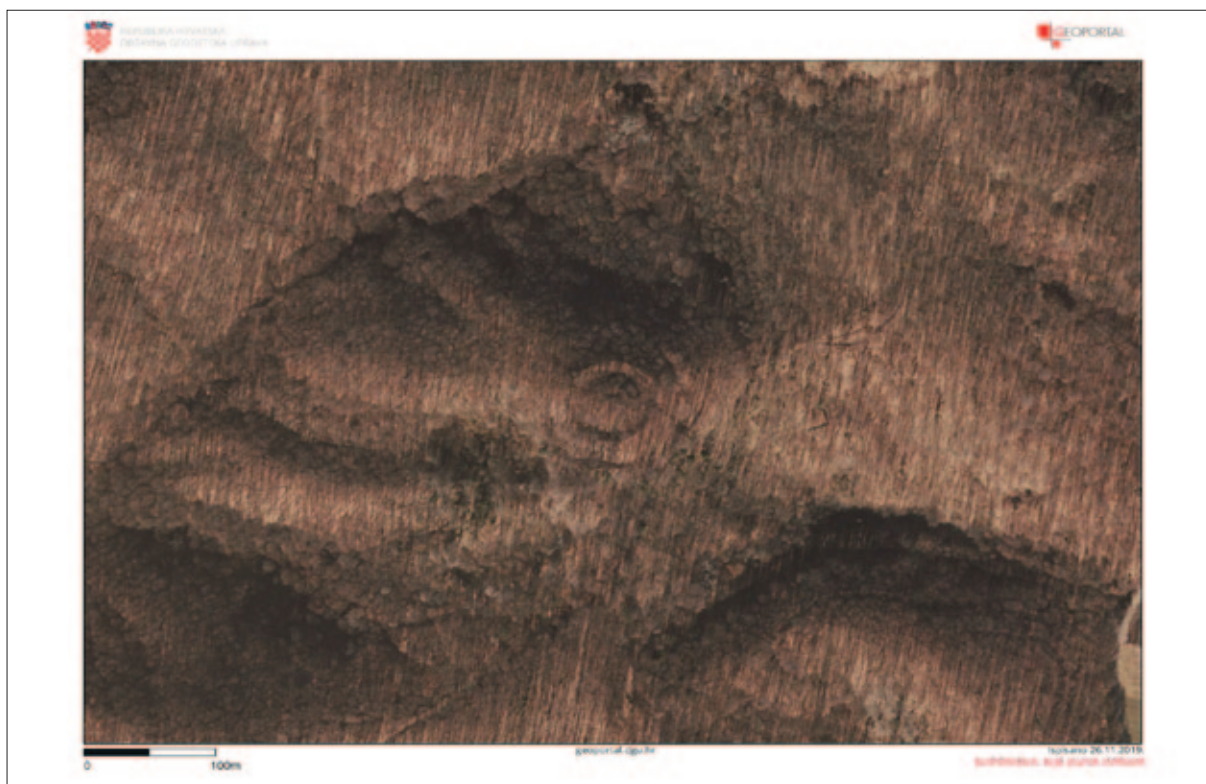
Sl. 30 Visinska utvrda Gradina iznad Voćarice i Paklenice na aerofotogrametrijskoj snimci (Geoportal DGU)

Fig. 30 Aerial photogrammetric image of the Gradina hill fort above Voćarica and Paklenica (SGA Geoportal)