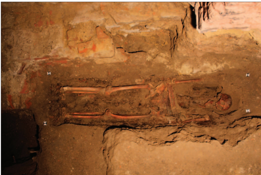
Sl. 13 Grob 60, djelomično položen na južni zid starije crkve (SJ 178), koji je njegovim ukopom oštećen

Fig. 12 Junction of the southern (SU 1783) and façade (SU 284) wall of the oldest church