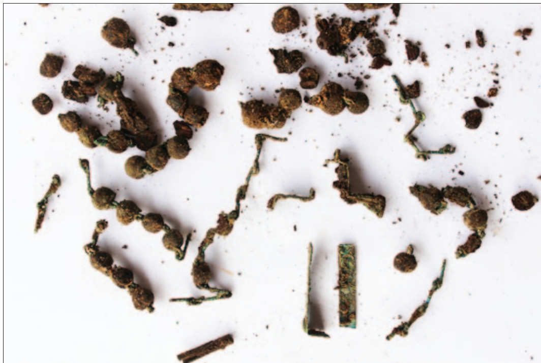
Sl. 23 Ostaci drvene krunice i križa (PN 58) iz groba 60, stanje prije čišćenja (snimio: S. Stingl)

Od posebnih nalaza iz grobova svakako još valja istaknuti i vrlo dobro očuvan srebrni bečki pfening pronađen u grobu 12 (PN 7). Kovan je od zatamnjenoga srebra, otišnut samo s prednje strane na kojoj se već i prije čišćenja vidi trolis izvan kojega se vide tri šesterokrake zvijezde, a unutar se u sredini nazire štitasti grb (vjerojatno grb Austrije, jako izlizan) i uokolo njega inicijali AL, B, t. Čini se da je riječ o novcu Alberta II. Habsburgovca koji je od 1437. do 1439. bio ugarsko-hrvatski kralj kao prvi od mnogih pripadnika dinastije Habsburg (od 1404. do 1439. kao Albert V. bio je austrijski nadvojvoda). U grobu 30 nađena su slijepljena četiri komada srebrnih sitnih novaca – moguće različitih vrijednosti (PN 12), no čini se da je riječ o novcima kralja Žigmunda Luksemburškog (1387. – 1437.). Na jedinom vidljivom aversu nalazi se