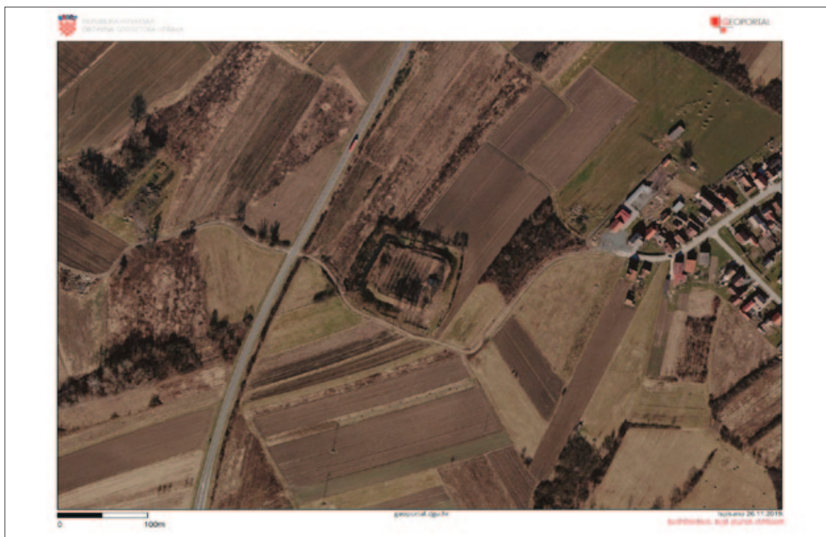
Sl. 28 Nizinska utvrda Orešić grad na aerofotogrametrijskoj snimci (Geoportals DGU) Fig. 28 Aerial photogrammetric image of the Orešić grad lowland fortification (SGA Geoportals)