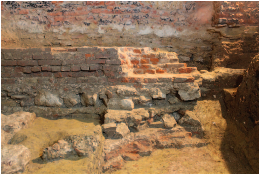
Sl. 12 Spoj južnoga (SJ 1783) i pročelnoga (SJ 284) zida najstarije crkve

Fig. 12 Junction of the southern (SU 1783) and façade (SU 284) wall of the oldest church