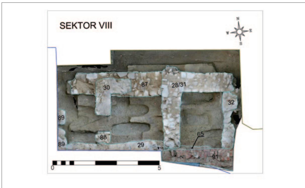
Sl. 3 Sektor VIII, tlocrt s ucrtanim ostacima arhitekture (izradio: M. Babeli; 3D model u podlozi izradila: V. Gligora)

Temelj/zid SJ 91 ostatak je sjevernoga zida broda crkve iz kasnoga srednjeg vijeka, a njegov je nastavak pronađen unutar crkve u sektoru VI gdje je dobio oznaku SJ 283. Na SJ 91 prilijepljen je temelj SJ 31 građen od većega nepravilnog bijelog i sivog kamenja koji se pruža prema sjeveru. Na jednak način bio je zidan i temelj SJ 28 koji se pruža u smjeru istok – zapad na oko 2,5 m udaljenosti od zida crkve, a građen je istovremeno s temeljom SJ 31 s kojim čini jednu cjelinu. Pogledamo li tlocrt, zajedno s ova dva temelja treći temelj, SJ 32, zatvara jednu logičnu pravokutnu prostoriju sjeverno uz crkvu. No, taj potonji temelj je od njih značajno plići! Zidan je