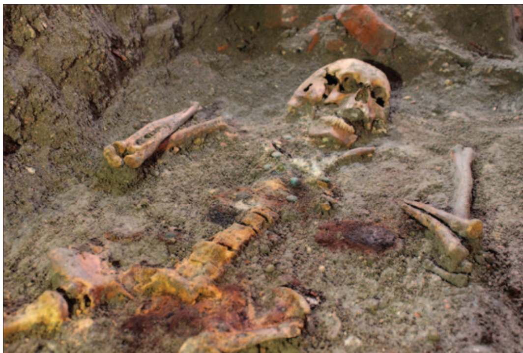
Sl. 21 Grob 65 tijekom istraživanja

Nabožni predmeti ili devocionalije su predmeti koji potiču ili proširuju pobožnost, a najčešće je riječ o svetačkim medaljicama, križevima i krunicama. Na grobljima ranoga novoga vijeka pronalaze se u otprilike 30% grobova, a taj se postotak povećava unutar crkvene građevine gdje se najčešće pokapao bogatiji sloj društva (Azinović Bebek 2012: 13; Belaj, Stingl 2018: 113). Iako je uzorak istraženih ranonovovjekovnih grobova unutar crkve sv. Luke Evanđelista premalen za donošenje čvršćih zaključaka, zanimljiv je podatak da su nabožni predmeti pronađeni u tri od šest grobova, odnosno u njih 50%. Osim nabožnih predmeta iz groba 65, značajan nalaz je i brevar (PN 74) koji je najvjerojatnije pripadao pokojniku iz groba 67 te krunica (PN 58) iz groba 60. Brevar je izrađen od bronce u obliku nepravilnoga romba (donje stranice su