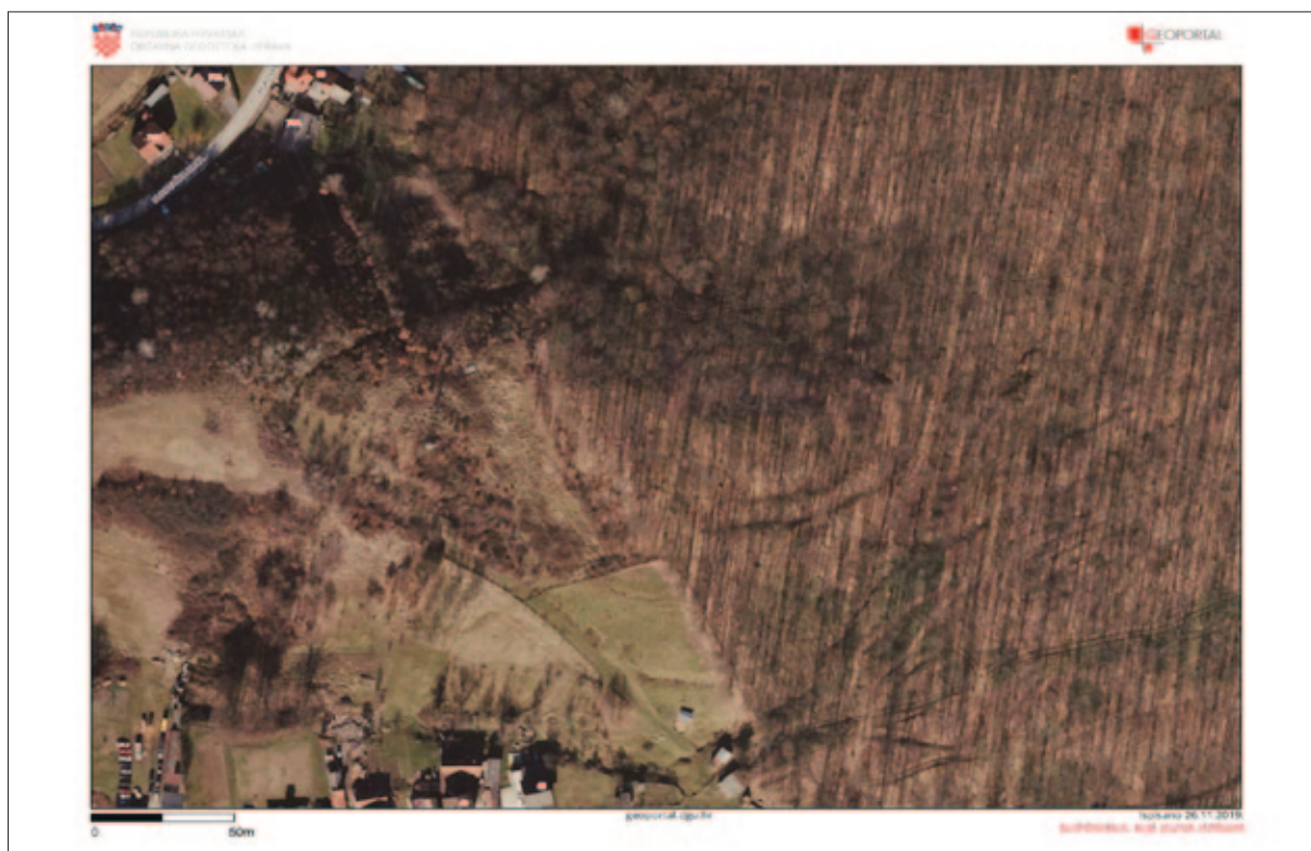
Sl. 29 Visinska utvrda Turski grad na aerofotogrametrijskoj snimci Fig. 29 Aerial photogrammetric image of the Turski grad hill fort