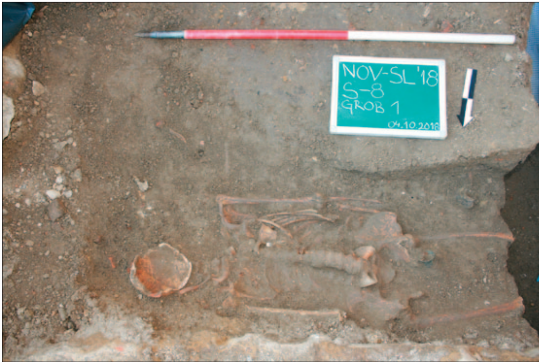
Sl. 5 Grob 1 sa zvonom (PN 1) in situ