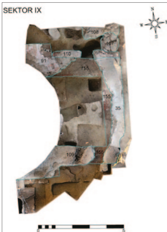
Sl. 6 Sektor IX, tlocrt s ucrtanim ostacima arhitekture (izradio: M. Babeli; 3D model u podlozi izradila: V. Gligora)