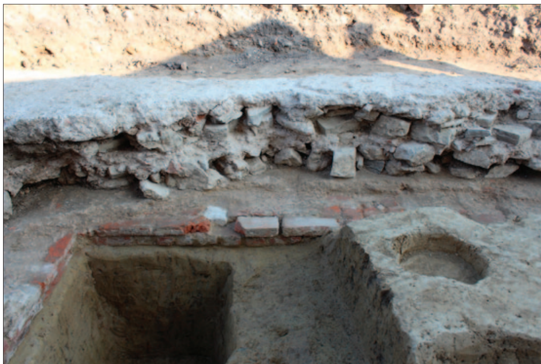
Sl. 7 Pogled sa zapada na temelj istočnoga zida svetišta najstarije crkve (SJ 35) Fig. 7 Base of the eastern chancel wall of the oldest church (SU 35) seen from the west