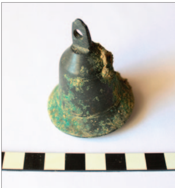
Sl. 22 Zvono (PN 1) iz groba 1 prije čišćenja

Fig. 22 The bell (SF 1) from grave 1 before cleaning