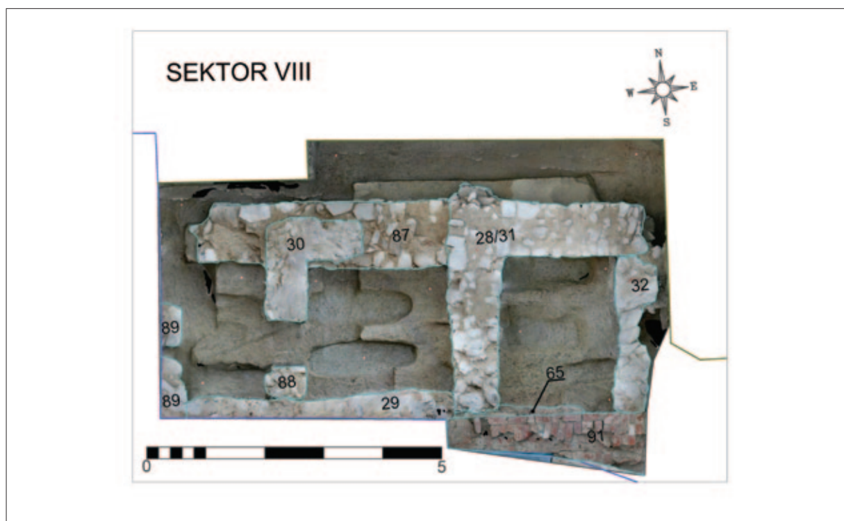
Sl. 3 Sektor VIII, tlocrt s ucrtanim ostacima arhitekture (izradio: M. Babeli; 3D model u podlozi izradila: V. Gligora)

Temelj/zid SJ 91 ostatak je sjevernoga zida broda crkve iz kasnoga srednjeg vijeka, a njegov je nastavak pronađen unutar crkve u sektoru VI gdje je dobio oznaku SJ 283. Na SJ 91 prilijepljen je temelj SJ 31 građen od većega nepravilnog bijelog i sivog kamenja koji se pruža prema sjeveru. Na jednak način bio je zidan i temelj SJ 28 koji se pruža u smjeru istok – zapad na oko 2,5 m udaljenosti od zida crkve, a građen je istovremeno s temeljom SJ 31 s kojim čini jednu cjelinu. Pogledamo li tlocrt, zajedno s ova dva temelja treći temelj, SJ 32, zatvara jednu logičnu pravokutnu prostoriju sjeverno uz crkvu. No, taj potonji temelj je od njih značajno plići! Zidan je