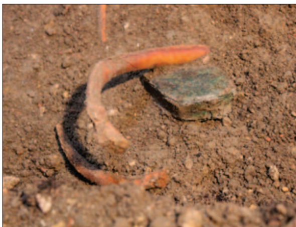
Sl. 15 Brevar (PN 74) in situ Fig. 15 A brevar (SF 74) in situ

oko upada podatak o posebnosti djevojačkih frizura novljanskoga kraja koje su pletenicama na zatiljku oblikovale pundu, tzv. kovrk (Žakula 2006: 251).