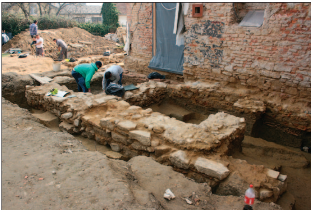
Sl. 4 Pogled na sektor VIII tijekom istraživanja