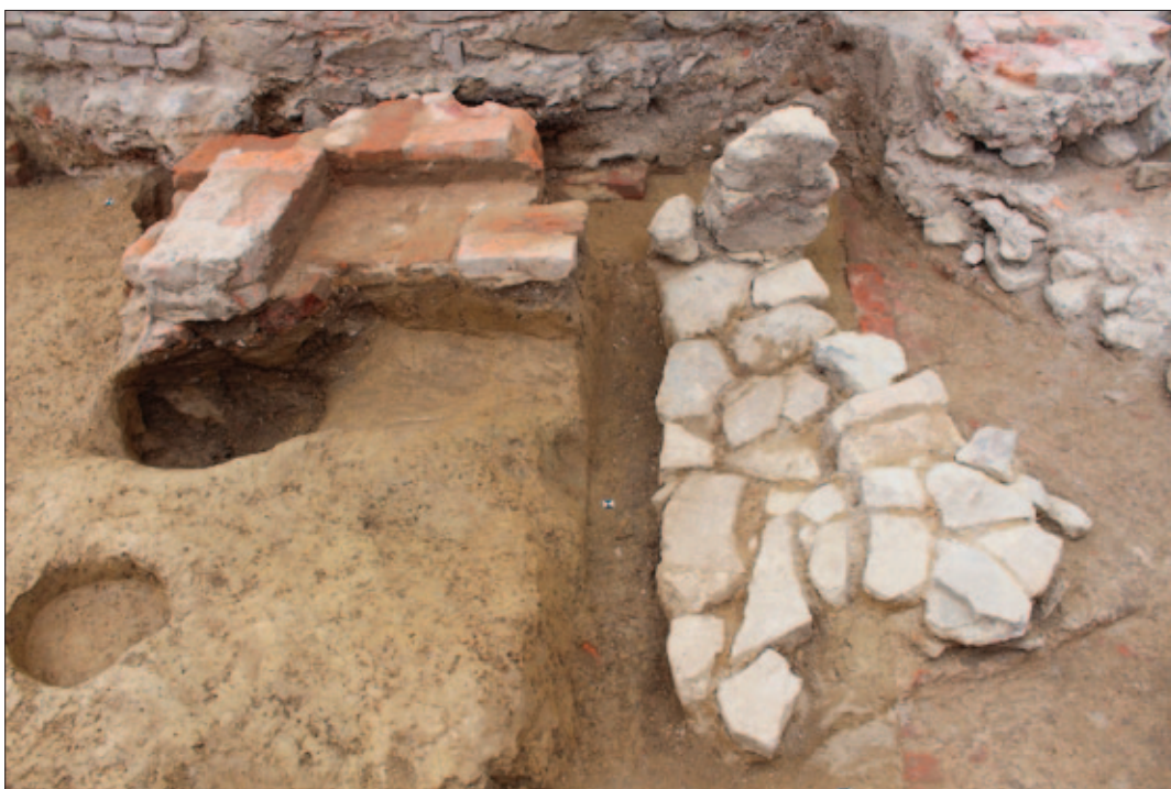
Sl. 8 Novovjekovne grobne strukture SJ 116 i 39, pogled s istoka Fig. 8 Modern Age grave structures SU 116 and 39 seen from the east