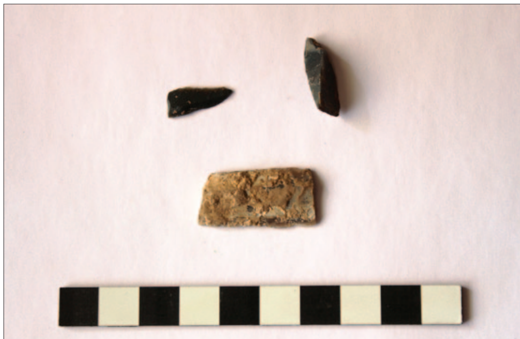
Sl. 26 Odabrani nalazi litike (PN 33, N 62 i 75)