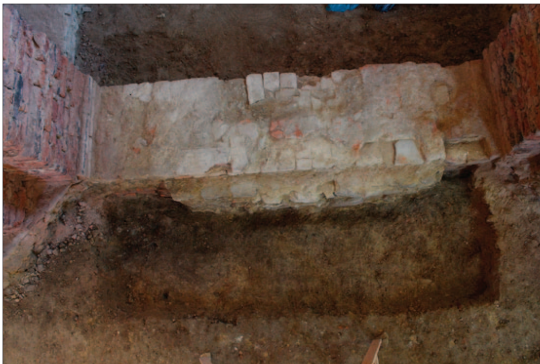
Sl. 19 Ojačanje SJ 192 za nekadašnji bočni ulaz u crkvu, sektori IV/V