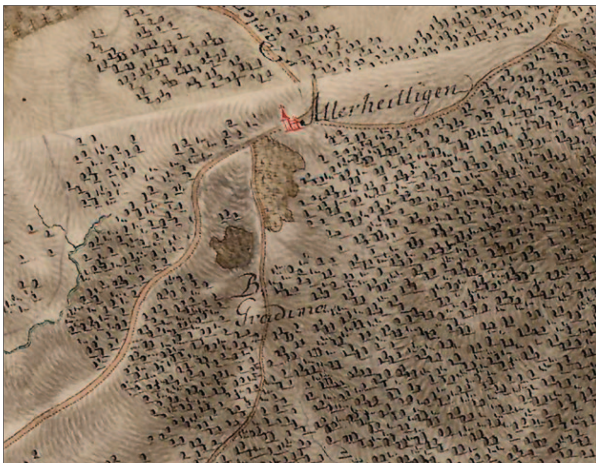
Sl. 31 Crkva sv. Svetih i Gradina iznad Voćarice i Paklenice na habsburškoj karti prve vojne izmjere iz 1780. god. (MAPIRE)

Fig. 30 Aerial photogrammetric image of the Gradina hill fort above Voćarica and Paklenica (SGA Geoportal)