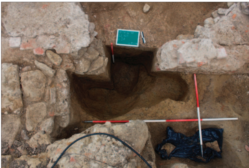
Sl. 9 Ukop prapovijesne jame SJ 121 pronađene sjeverno od svetišta najstarije crkve