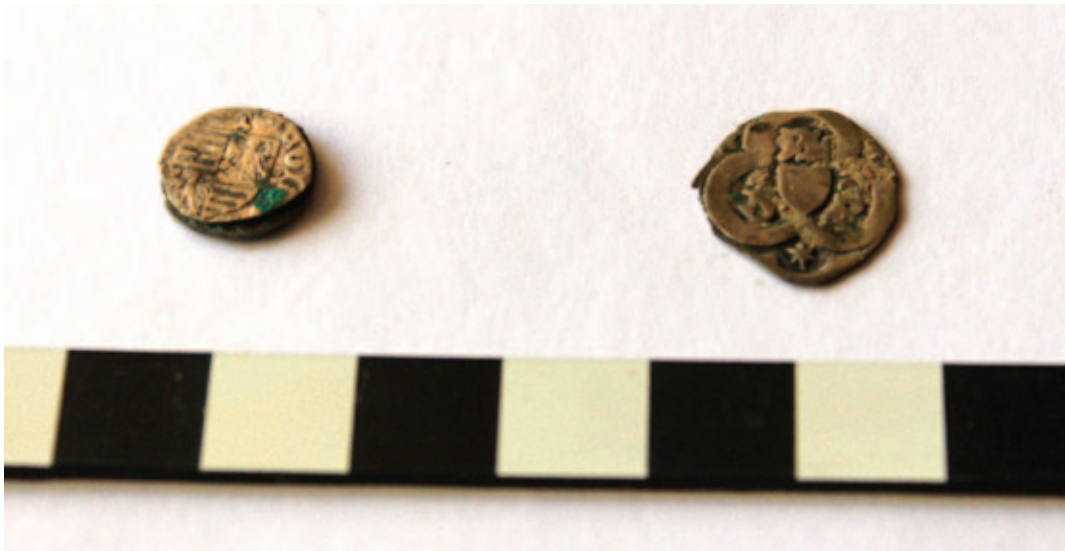
Sl. 24 Novci Žigmunda Luksemburškog iz groba 30 (PN 12; desno) te Alberta II. Habsburgovca iz groba 12 (PN 7; lijevo) Fig. 24 Coins of Sigismund of Luxembourg from grave 30 (SF 12; on the right) and Albert II of Habsburg from grave 12 (SF 7; on the left)

savršeno sačuvan čavao (PN 88), a u sloju sa spaljenim kostima (SJ 261) čavao (PN 91) s rastaljenom i savijenom glavom, možda kao posljedica gorenja. Oba čavla nisu nimalo korodirana. Najzanimljiviji nalaz iz sektora III svakako je čašasti pećnjak smeđe boje pronađen u sloju urušenja (SJ 245). Manjih je dimenzija, grublje izrade, s ravnim dnom i stijenkama nakošenim prema van. Takav tip pećnjaka datira se širokim vremenskim rasponom, od 14. pa sve do 17. stoljeća (Radić, Bojčić 2004: 231–233).