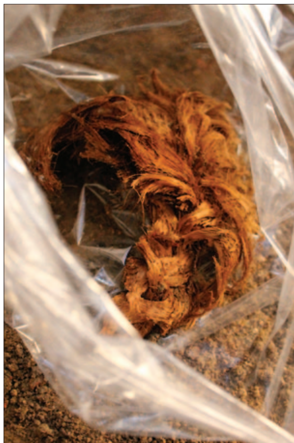
Sl. 16 Nalaz pletenice iz groba 43 (snimio: S. Stingl) Fig. 16 Find of a plait from grave 43 (photo: S. Stingl)

Nakon što je do sloja zdravice istražena gotovo cijela površina sektora VI, potvrdile su se naše slutnje. Zidana struktura SJ 11 zaista je ostatak zida koji je povezivao sjeverni (SJ 283) i južni zid (SJ 178) starije faze crkve, što je vidljivo iz njegovoga temelja (SJ 171) koji se pružao bez