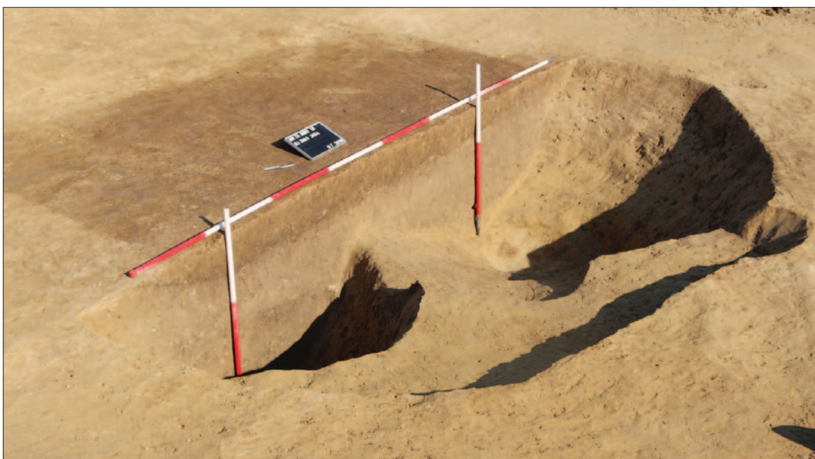
Sl. 5 Presjek jame SJ 3194