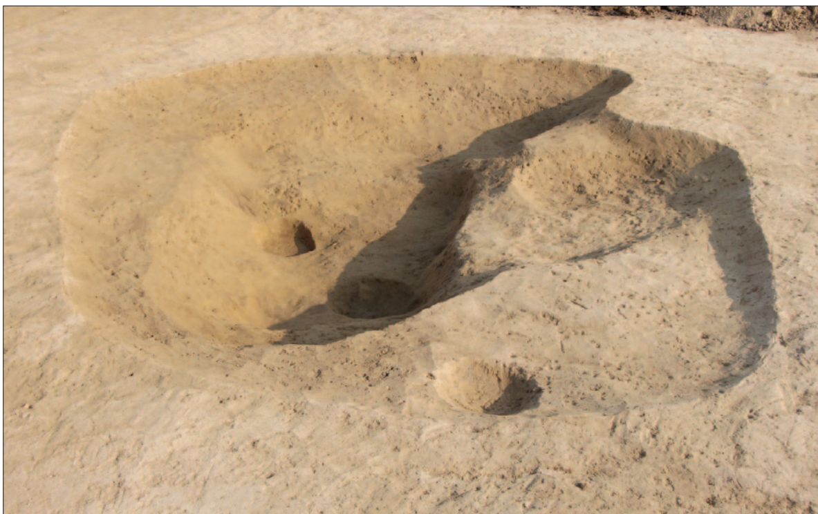
Sl. 4 Ukop jame SJ 3190