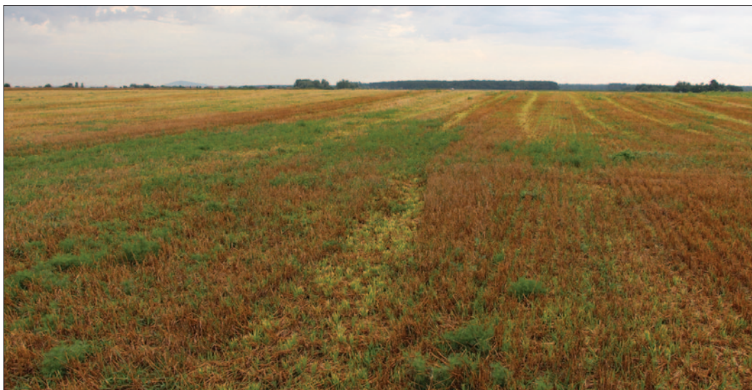
Sl. 1 AN 7A Jagodnjak – Napuštene njive prije početka istraživanja, južni dio nalazišta