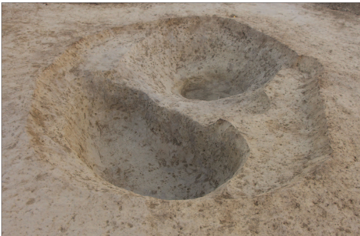
Sl. 6 Ukop jame SJ 3194