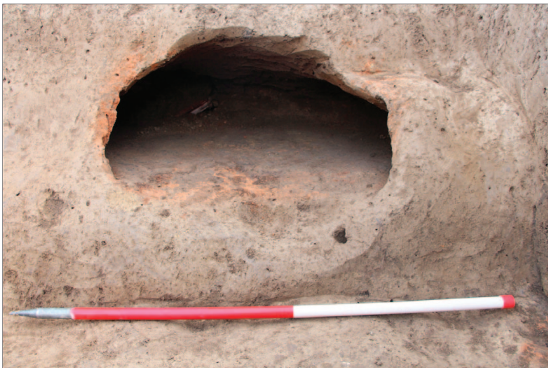
Sl. 4 Detalj peći u objektu SJ 1217

Fig. Semi-dug object SJ 1217