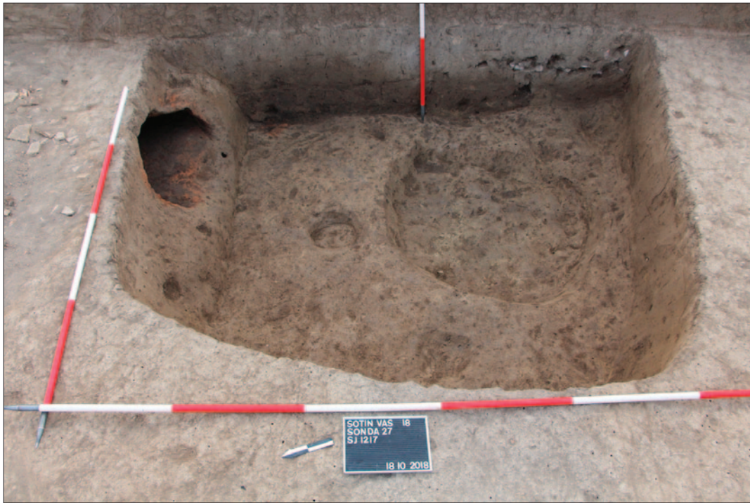
Sl. 3 Poluukopani objekt SJ 1217

Fig. Semi-dug object SJ 1217