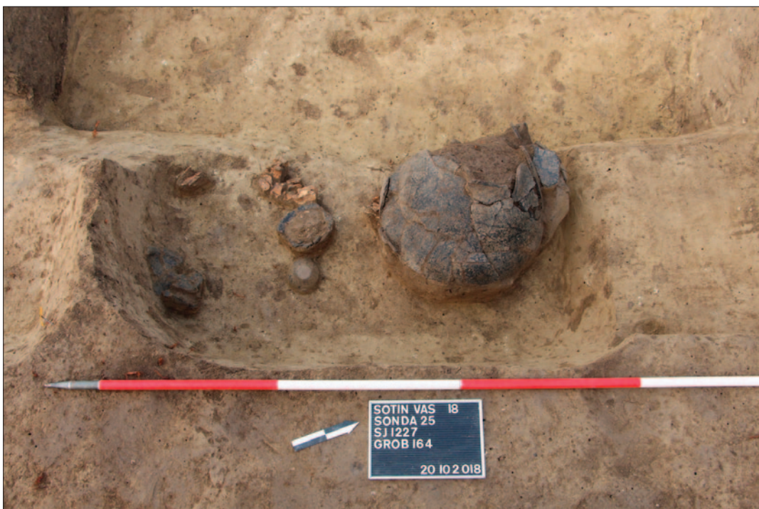
Sl. 2 Grob 164