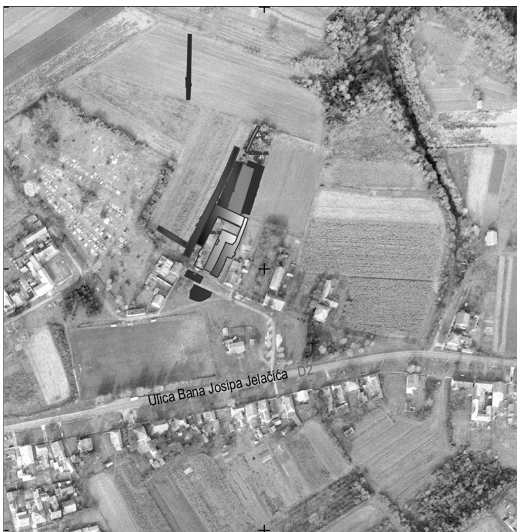
Sl. 5 Sotin Vašarište – položaji dosad istraženih sondi (2008., 2011.–2018.) (izradila: D. Ložnjak Dizdar)

zilo naselje čijoj infrastrukturi pripadaju ukopi pravilnih pravokutnih objekata, vjerojatno radnih prostora, uz koje se nalaze peći. Manji broj pronađenih objekata pripada razdoblju kasnoga srednjeg vijeka, da bi potom brojni bili i ukopi novovjekovnih kanala koji su često oštetili starije cjeline. Ipak, nalazište na Vašarištu ističe se, prije svega, po otkriću velikoga broja paljevinskih grobova daljske grupe s kraja kasnoga brončanog i početka starijega željeznog doba čime se Sotin svrstava među najveća istražena nalazišta toga vremena na prostoru srednjega Podunavlja.