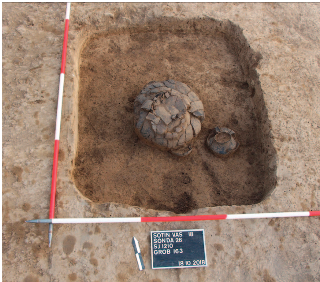
Sl. 1 Grob 163