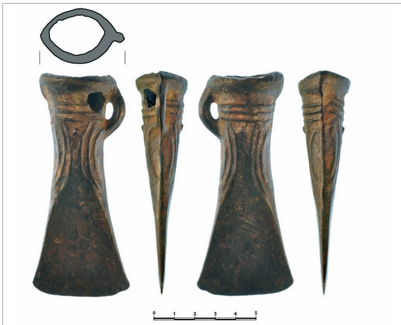
Sl. 2 Brončana sjekira (grafička obrada: Miljenko Gregl) Fig. 2 Bronze axe (graphic processing by Miljenko Gregl)

tuljcem od sječiva i ukrasom "X" koji u gornjem dijelu zatvara bradavičasto ispupčenje podsjeća na neke primjere sjekira iz ostave Brodski Varoš, datirane u razdoblje Ha A, a one s bočnim facetama predstavljaju ranije primjerke, našu sjekiru moramo promatrati u odnosu na šuplje sjekire ostava i grobova IV. faze: Velika Gorica, Kapelna (Vinski-Gasparini 1973: 93, tab. 61: 10, 12; tab. 102: 1; 165, tab. 110: 9) iako još nema sječivo odvojeno od tuljca vodoravnim rebrom. Ipak, najbliža našem primjerku jest sjekira iz Lukavca koji je također datiran u IV. horizont kulture polja sa žarama (Žeravica 1993: tab. 38, 507).