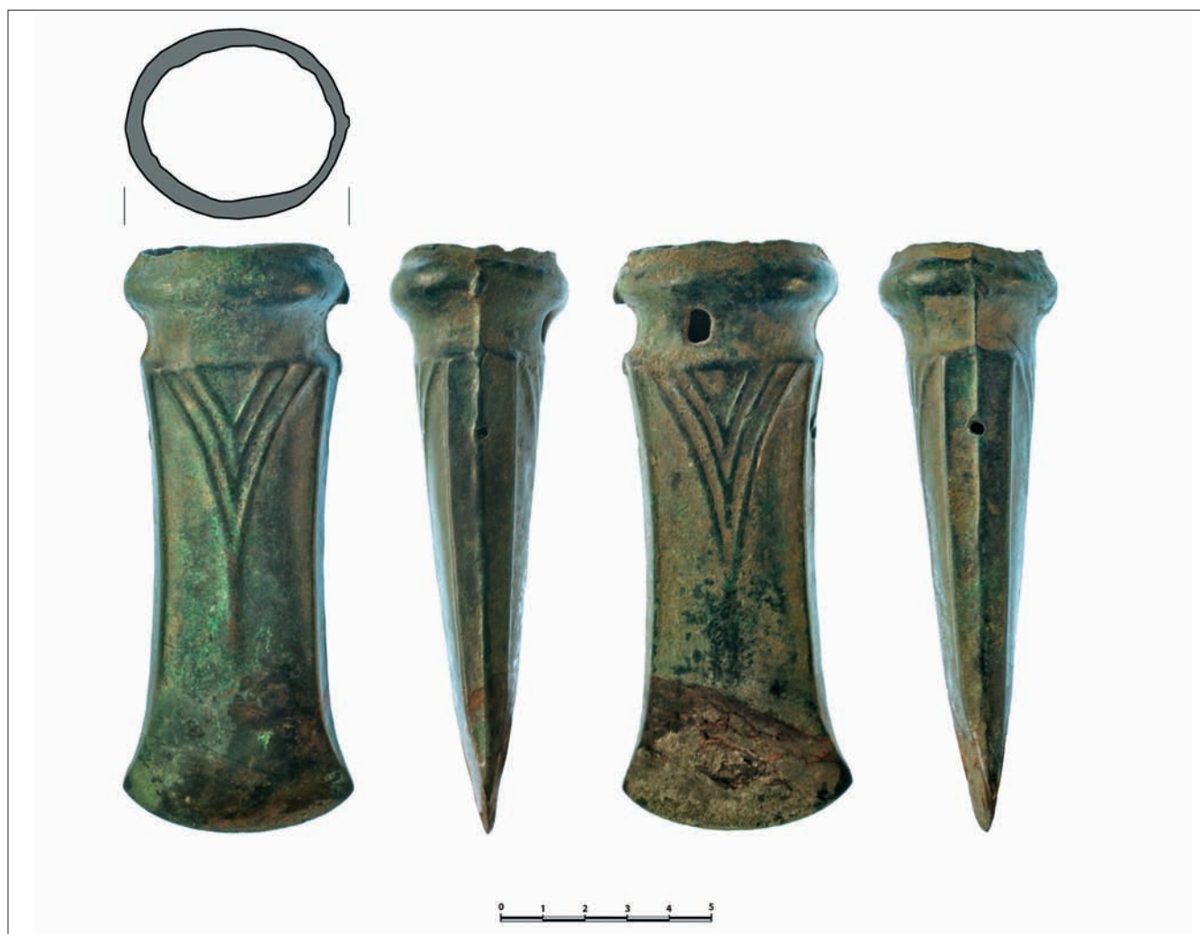
Sl. 1 Brončana sjekira (grafička obrada: Miljenko Gregl) Fig. 1 Bronze axe (graphic processing by Miljenko Gregl)

sumnja da su domaće provenijencije. No, s obzirom na nalaz značajnih predmeta i postojanje bogate nekropole na predjelu Šinigoj u gradu Krku (Balen-Letunić 1991–92), možemo gotovo sa sigurnošću razmotriti mogućnost da se radi o domaćem materijalu.* Zbog spomenutih okolnosti nalaženja, obradi krčkog materijala moglo se prići jedino s tipološke strane.