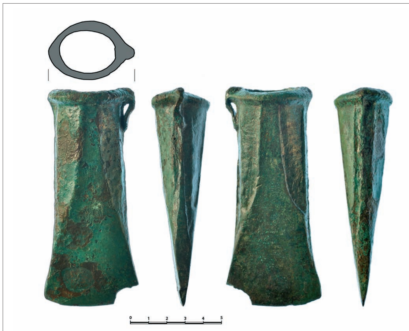
Sl. 3 Brončana sjekira (grafička obrada: Miljenko Gregl) Fig. 3 Bronze axe (graphic processing by Miljenko Gregl)

sječiva 5,1 cm; promjer otvora 4,5 cm; visina zadebljanog dijela oko otvora 0,7 cm; minimalna širina centralnog ispupčenja koje se proširuje u sječivo 1,2 cm; visina tuljca 5,5 cm.