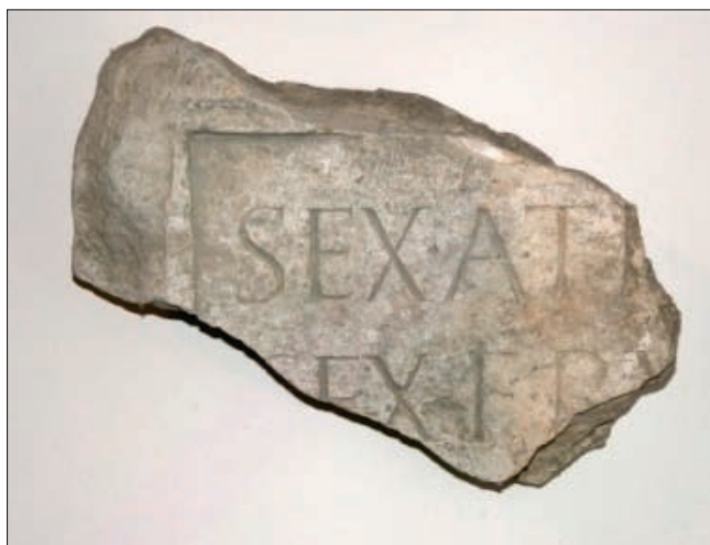
Sl. 2 Stela Seksta Atilija Rufa iz Aserije, Muzejska zbirka franjevačkog samostana Visovac