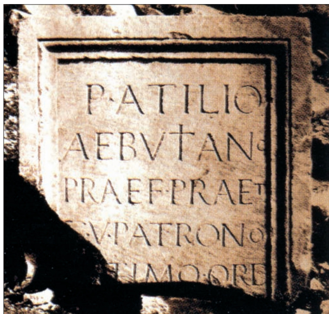
Sl. 3 Natpis Publija Atilija Ebutijana iz Aserije (Liebl, Wilberg 2006: 233)