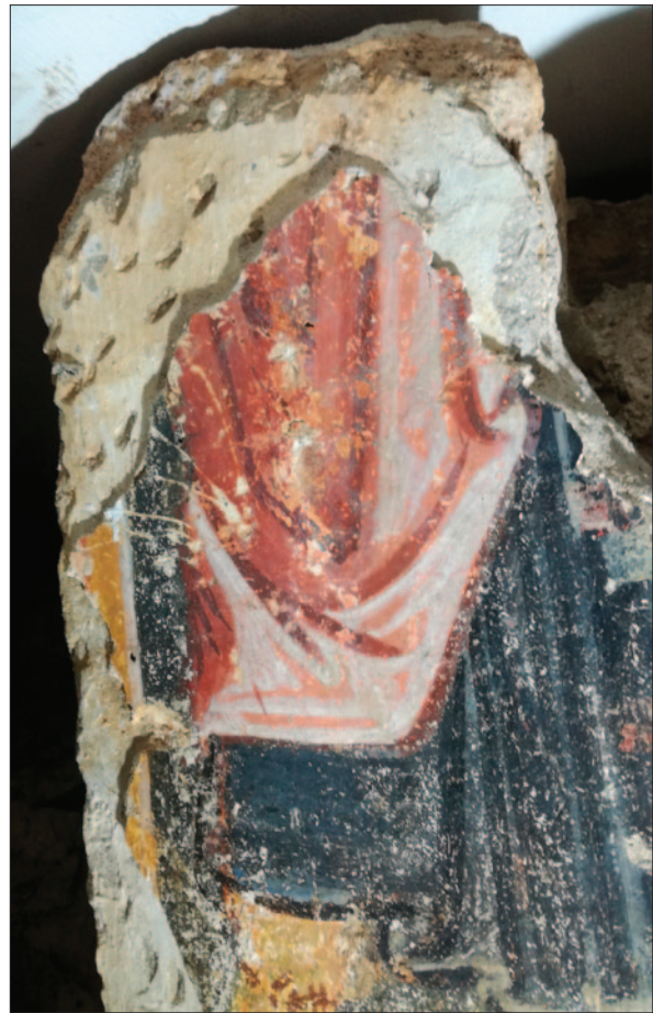
Sl. 13 Dubrovnik, podzemlje katedrale. Detalj zidne slike s arkada lađe – svijetla žbuka nanese na otučeni donji sloj (dokumentacija projekta)

Na kraju, potrebno je istaknuti i kako su aktivnosti ALU (OKIRU) bile usmjerene i na pravilno pakiranje i zbrinjavanje ulomaka, pri čemu se vodilo računa o konzervatorskim smjernicama vezanim za brigu o arheološkim artefaktima. Tako se zbrinuti ulomci sada nalaze u čvrstim kutijama obloženim polietilenskom spužvom s ugrađenim pregradama za veće i podlogama za manje ulomke, čime je omogućen pregled sadržaja kutija već „na prvi pogled“ (sl. 14). Kutije se slažu jedna na drugu kako bi se uštedio prostor, ali istovremeno ostavila mogućnost