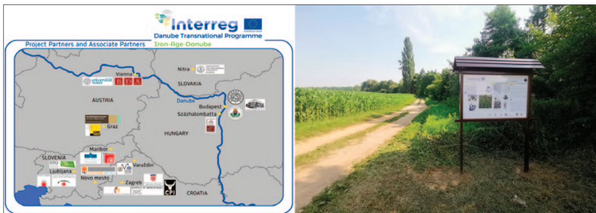
Sl. 1 Partneri projekta Iron-Age-Danube i jedna od informativnih dvojezičnih tabli arheološko-turističke staze postavljene na Bistričaku u okviru projekta Iron-Age-Danube Interreg DTP u 2019.