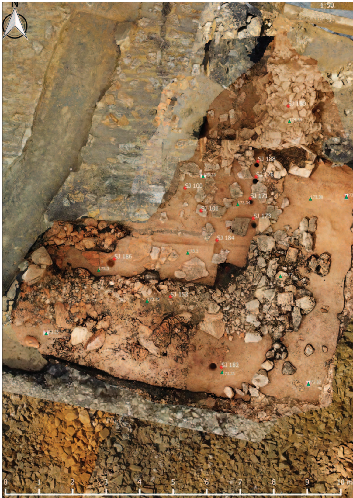
Sl. 2 Jugoistočni kut grobne komore Gomile s istočnim nizom rupa od stupova i dromosom tijekom istraživanja 2019. (izradio: M. Maderić)