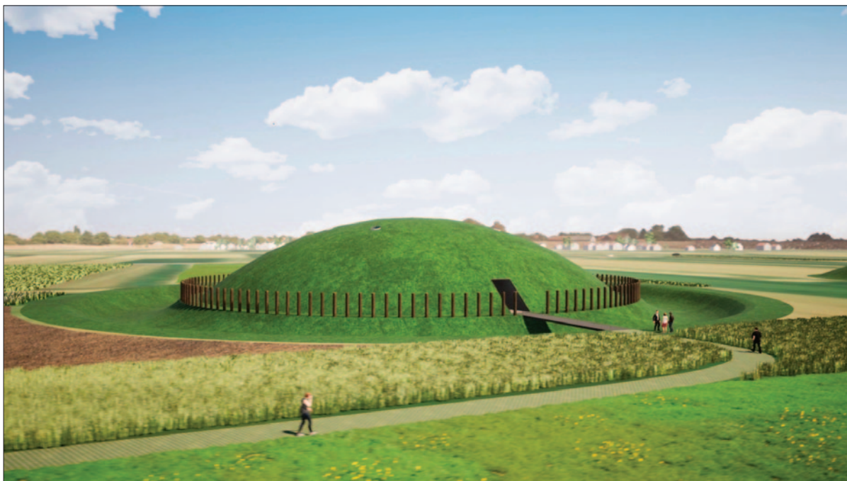
Sl. 3 Iz idejnoga rješenja prezentacije Gomile u Jalžabetu (izradio: G. Rako/Radionica arhitekture)