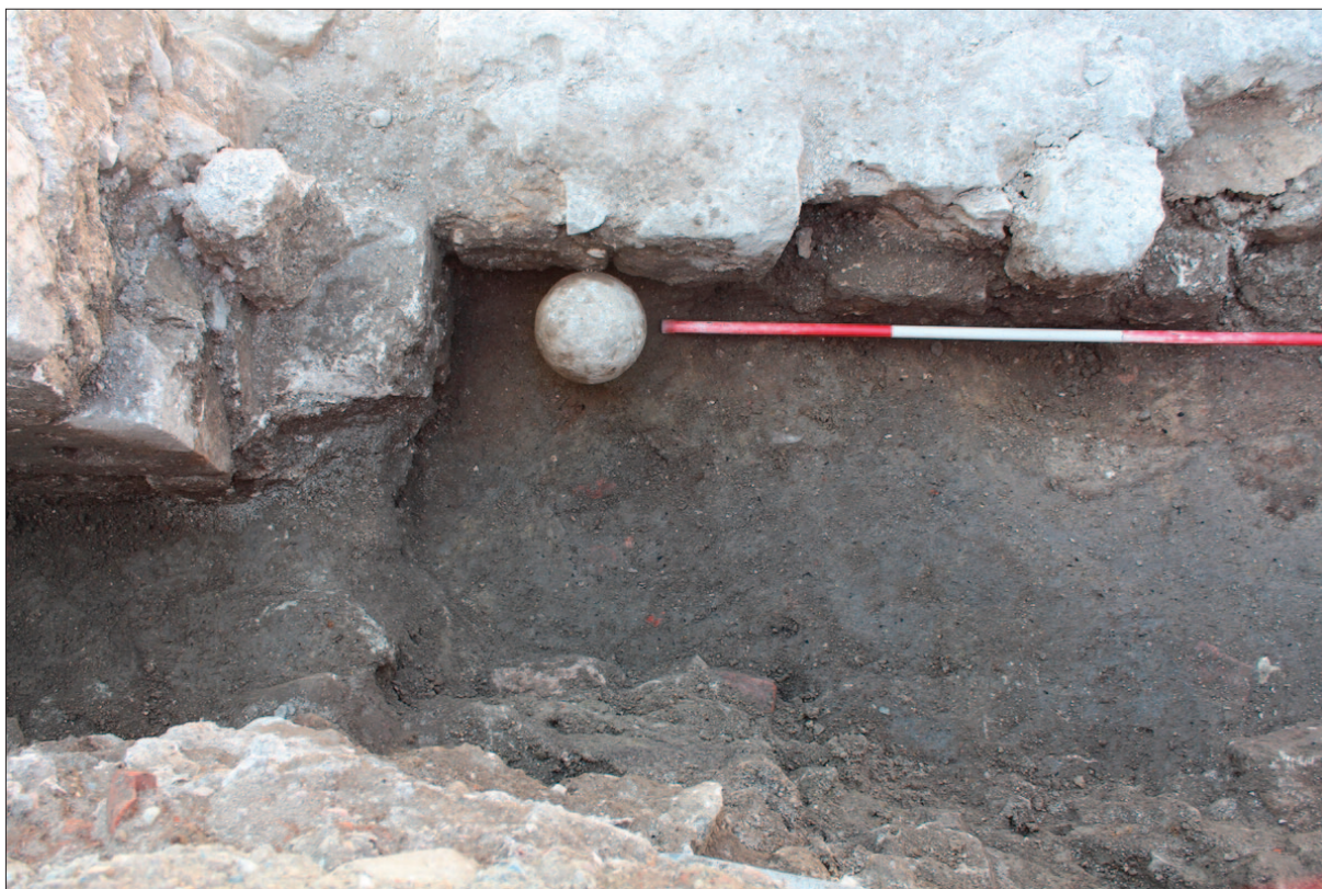
Sl. 9 Kameni kuglasti projektil pronaden s vanjske strane stubišta

Fig. 8 Stone paving in the vestibule of the staircase and the threshold and lowest parts of the door jamb at the very entrance to it