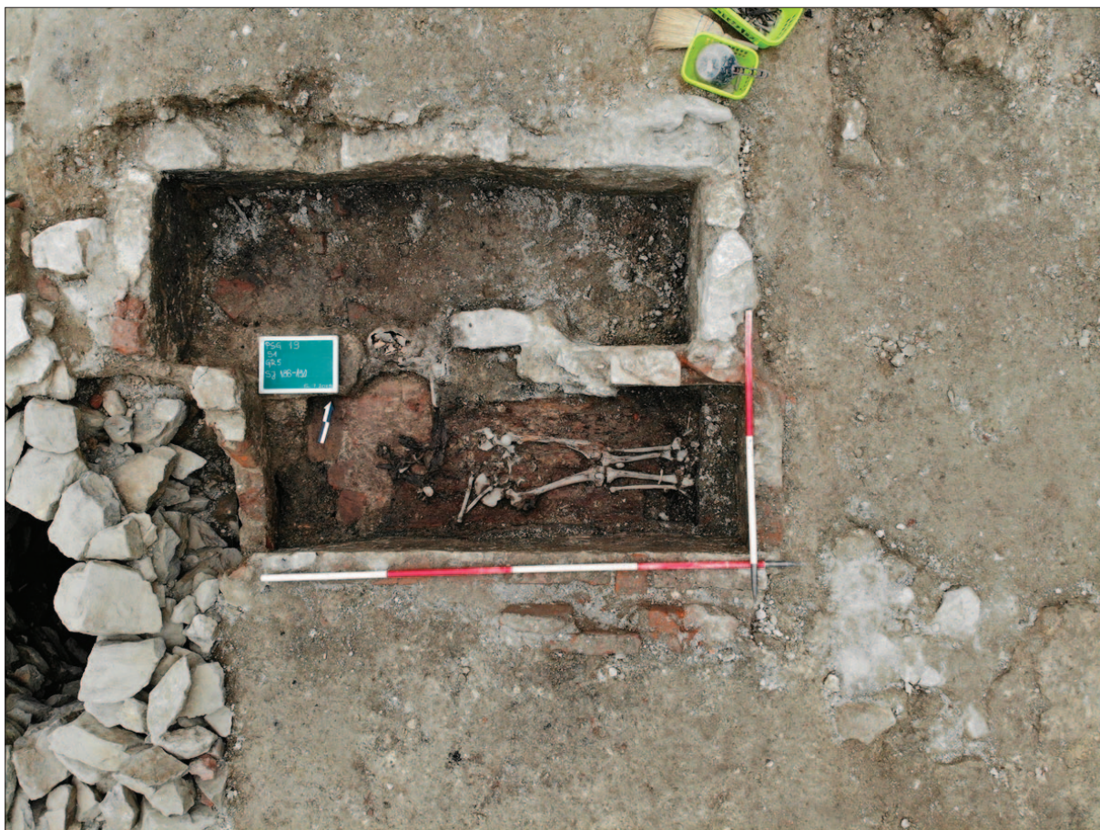
Sl. 15 Kamenom zidana grobnica (gore) i opekom zidana grobnica (dolje) s ostacima pokojnika i tragovima lijesa

Fig. 15 Stone masonry tomb (above) and brick masonry tomb (below) with the remains of the dead and traces of the coffin