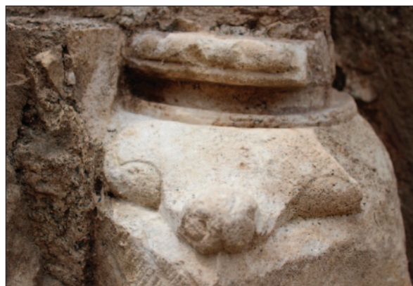
Sl. 6 Manja baza polustupa u jugozapadnome kutu kapele, uz ulaz u stubište

izrade, vjerojatnije je bio ispaljivan iz topa, nego li iz katapulte. Slični su projektili, korišteni prilikom topničkih opsada, nalaženi i na drugim hrvatskim utvrdama, primjerice Gorbonoku (Čimin 2020: 180–181), Velikom Taboru (Horjan 2007: 91, kat. br. 70), Virovitici (Salajić 2010: 359, sl. 24) i Ružici (Radić, Bojčić 2004: 154). Tri kamena kuglasta projektila različitih kalibara (8,6/9,6; 10/11,9; 23 cm) i neujednačene vrsnoće izrade, ali i očuvanosti, pronašli smo u Pakracu i 2017. godine unutar velike kule u sondi 3 u slojevima urušenja (Belaj 2018: 58). Moguće je da su pojedini projektili preostali nakon neke