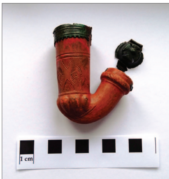
Sl. 5 Lula s poklopcem