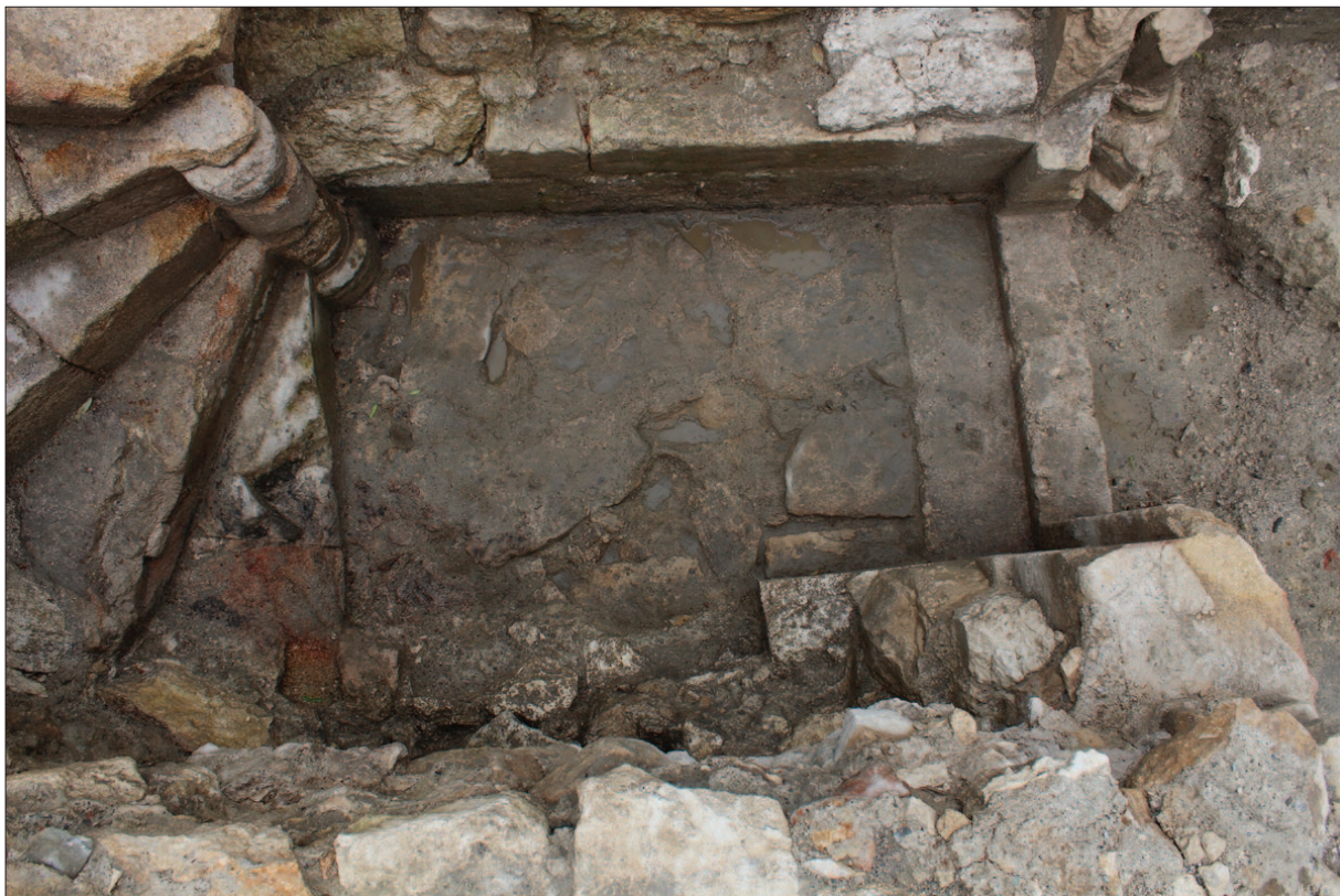
Sl. 8 Kameno popločenje u predprostoru stubišta te prag i najdonji dijelovi dovratnika na samome ulazu u njega

Fig. 8 Stone paving in the vestibule of the staircase and the threshold and lowest parts of the door jamb at the very entrance to it