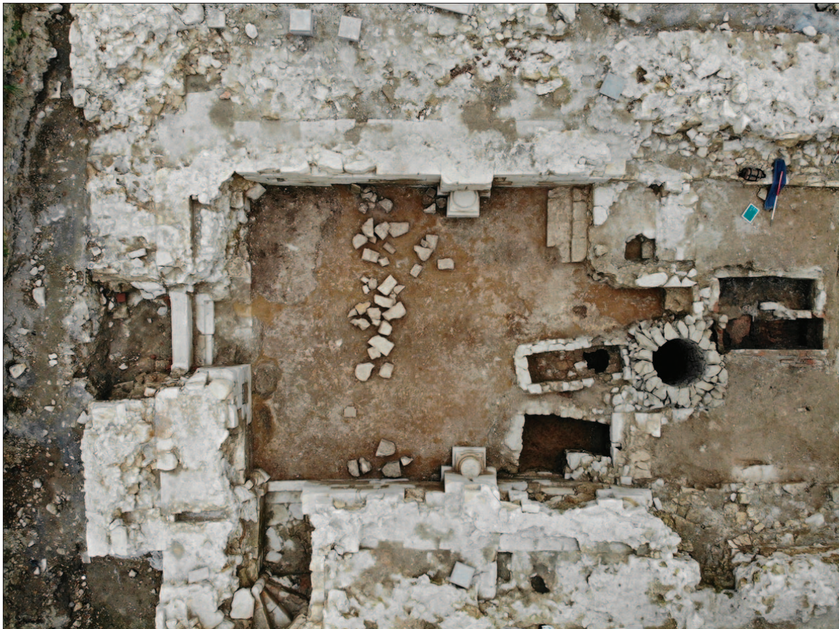
Sl. 2 Urušenje u zapadnome traveju

Fig. 2 Collapsed material in the western nave