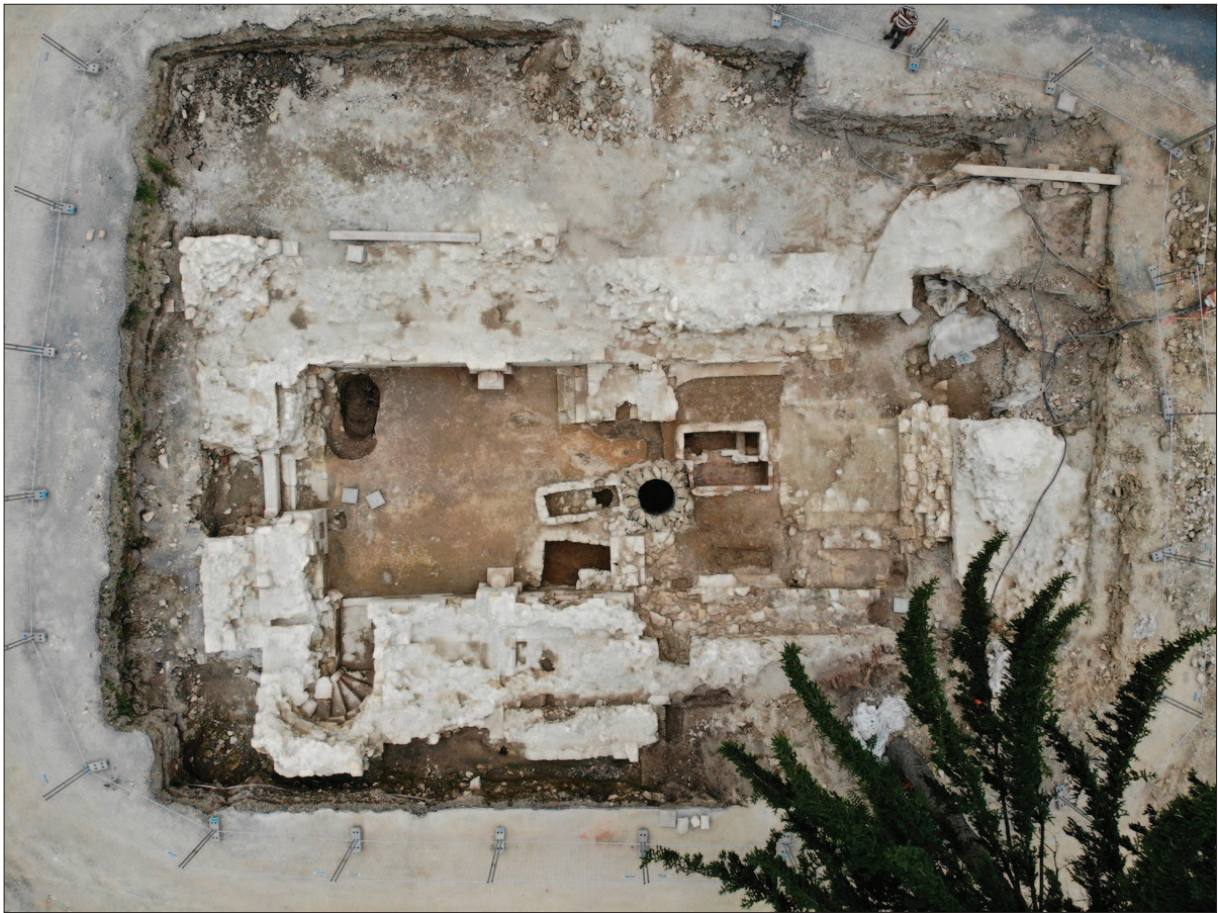
Sl. 13 Pogled na kapelu tijekom istraživanja

Fig. 13 View of the chapel during the excavations