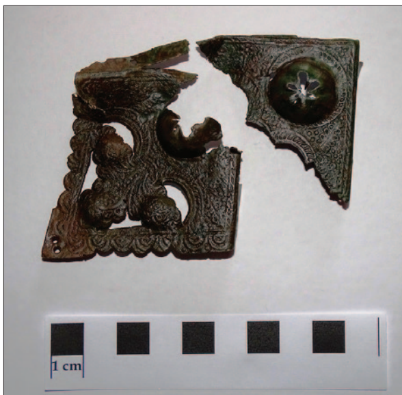
Sl. 11 Ukrasni okov za korice knjige

Fig. 11 Decorative fitting for the binder of the book