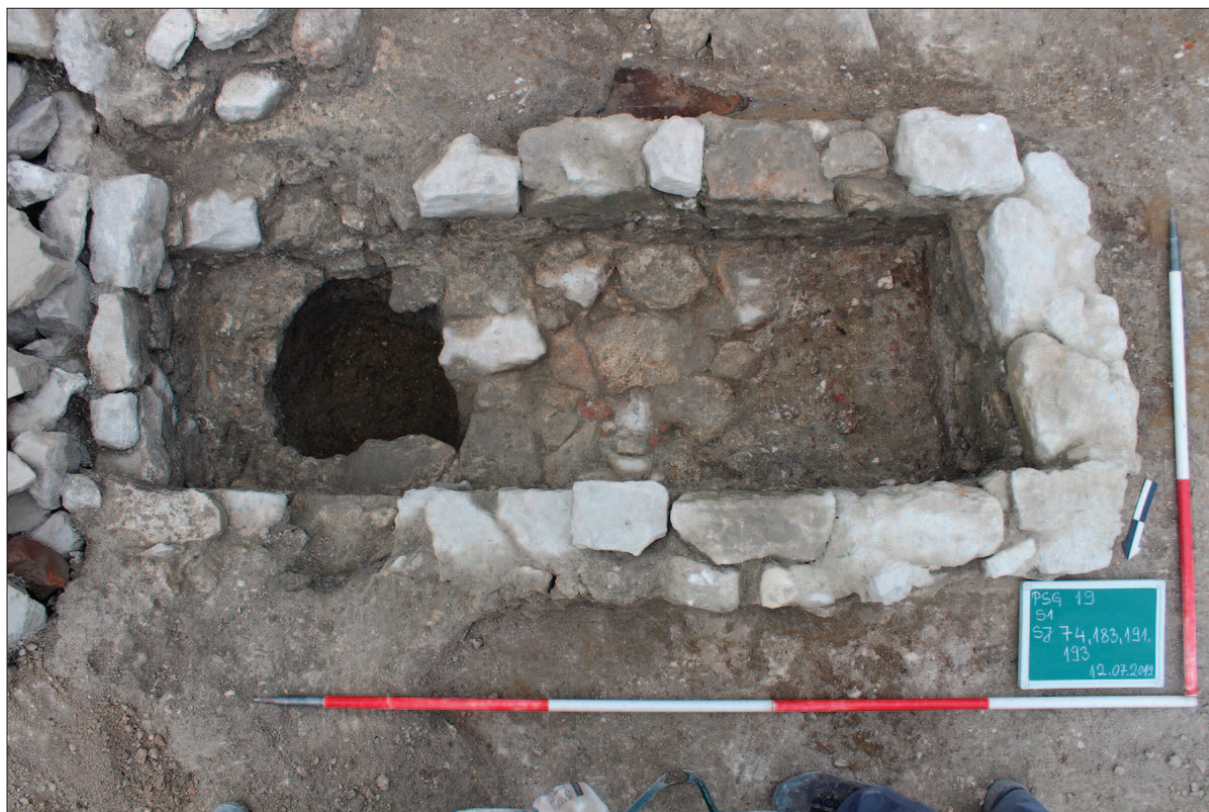
Sl. 10 Kamenom zidana grobnica s kamenom podnicom, naknadno probijena ukopom za stup