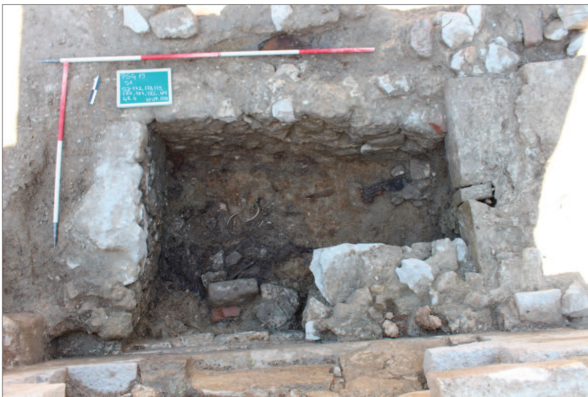
Sl. 12 Kamenom zidana grobnica i kamena struktura u njoj

Također se čini da su posmrtni ostaci ekshumirani. 19 Vjerojatno je u svim ovakvim slučajevima bila riječ o uglednijim članovima zajednice. Na dnu ove grobnice nalazi se sloj žute gline – možda je riječ o zdravici – a u njenom jugoistočnome kutu kamena struktura za sada nepoznate namjene (sl. 12). Istočnije od ove grobnice, također prislonjene uz južni zid kapele, nalaze se zidane strukture pravokutnoga tlocrta. Njihove namjene u ovome stupnju istraživanja još nisu jasne, no situacija se u mnogočemu podudara s onom uz nasuprotni zid. Zapadnije strukture su vrlo plitko temeljene i široke te se možda radi o bazama bočnih oltara. Istočnije strukture su pak mnogo uže te djeluju poput zidova koji se pružaju prema sredini kapele. Položaj potonjih navodi na pomišljanje kako je riječ o ostacima trijumfalnoga luka koji bi bio izveden u nekoj kasnijoj fazi kada je svod kapele već bio porušen (sl. 13). Uz sjeverni zid može se vidjeti kako iz istočnije strukture “viri” vrlo oštećen ostatak baze polustupa. Možda se i na suprotnoj strani kapele kriju ostaci polustupa prislonjeni uz južni zid – tragovi mu do sada nisu uočeni. Sve ove pretpostavke tek će trebati provjeriti u narednim kampanjama.