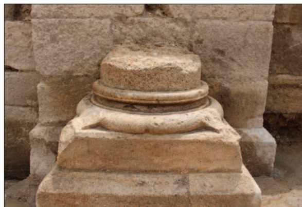
Sl. 7 Baza polustupa na razmeđu zapadnoga i središnjega traveja