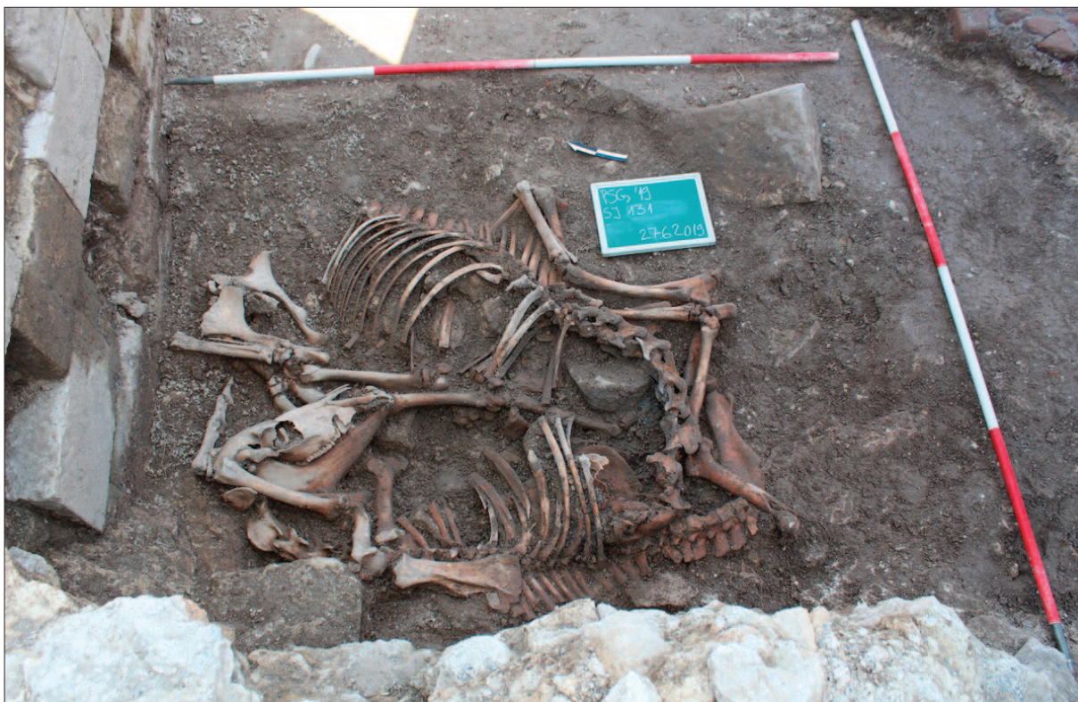
Sl. 4 Ukopi konja u sjeverozapadnome kutu