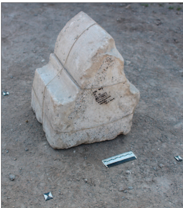
Sl. 3 Ulomak svodnoga rebra bademastoga presjeka

Fig. 2 Collapsed material in the western nave