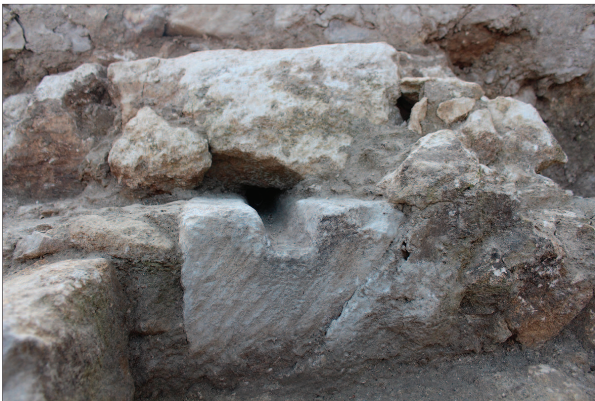
Sl. 16 Izljevni kanalić sakrarija sačuvan u istočnome zidu kapele