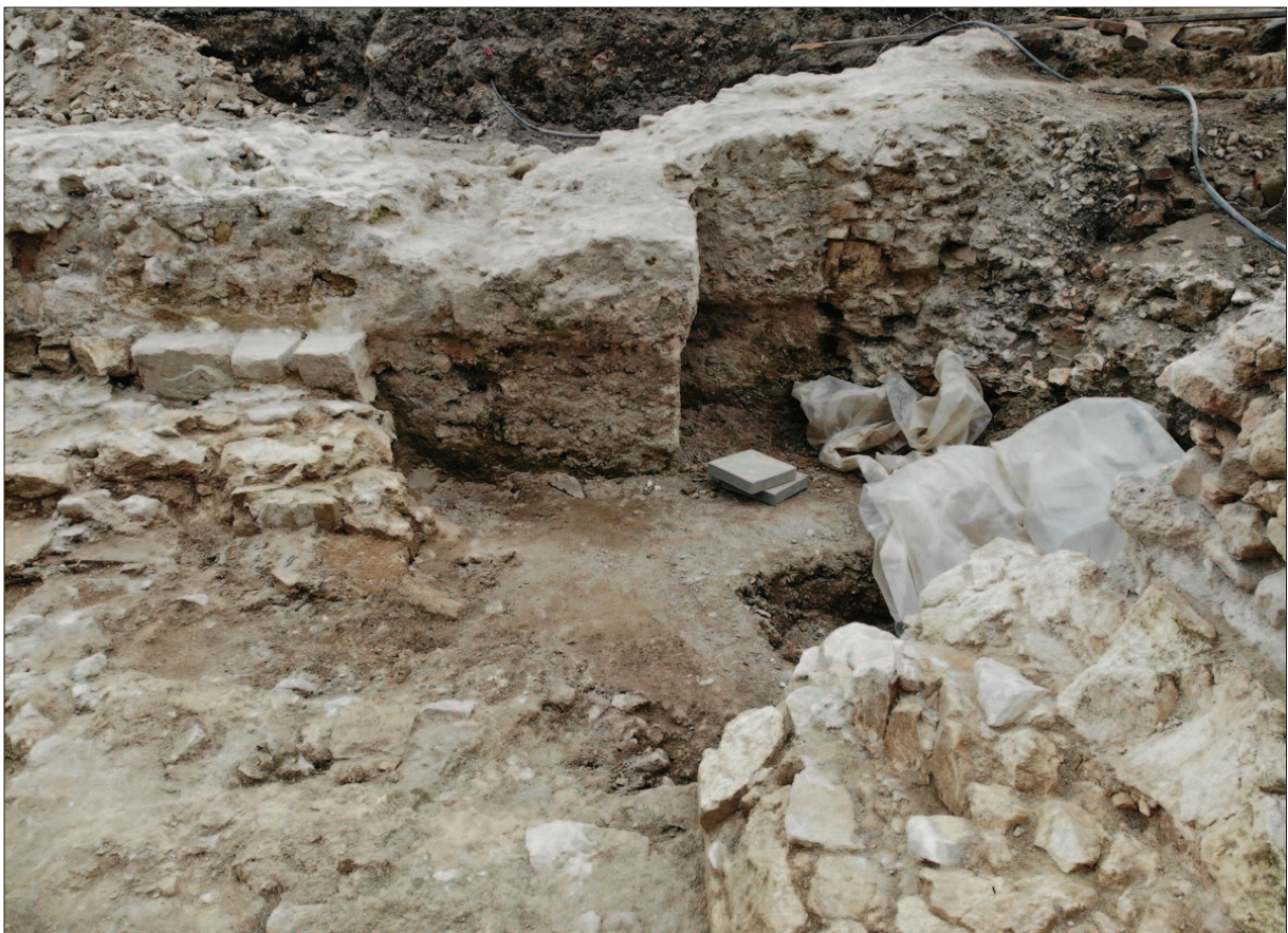
Sl. 14 Sačuvani trag sjeveroistočnoga ugla i potpornjaka zajedno s njegovim soklom, vidljivi poput negativa u pridodanome zidu

Fig. 13 View of the chapel during the excavations