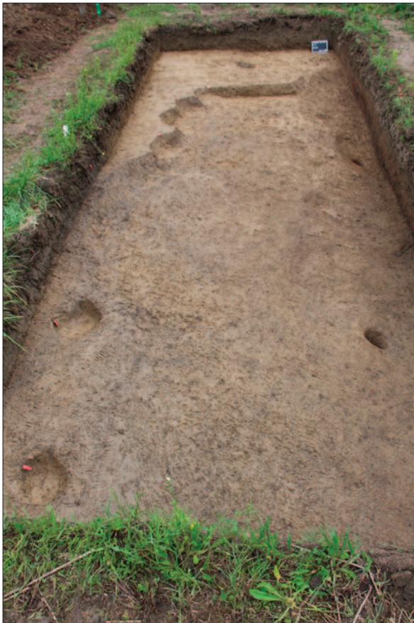
Sl. 3 Istražena sonda 3 u Dolini 2019. godine Fig. 3 Excavated Trench 3 in Dolina in 2019