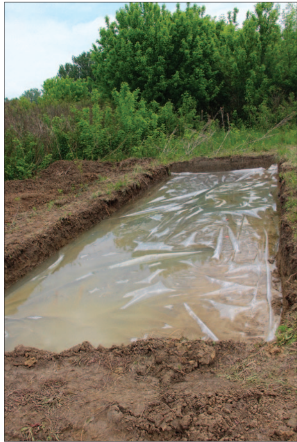
Sl. 4 Sonda 3 u Dolini tijekom istraživanja u svibnju 2019. godine za vrijeme visokih zaobalnih voda Fig. 4 Trench 3 in Dolina during the excavations in May 2019 in the period of high river basin waters

ke u intenzitetu aktivnosti u pojedinim dijelovima naselja koje bi se mogle dovesti u vezu s podjelom na stambeni i gospodarski dio. Sumirajući spoznaje iz terenskih pregleda, geofizičke prospekcije i arheoloških istraživanja, vidljivo je kako je infrastruktura kasnobrončanodobnoga naselja u Dolini bila složena i najvjerojatnije uvjetovana interakcijom s okolišem u kojem je naselje podignuto.