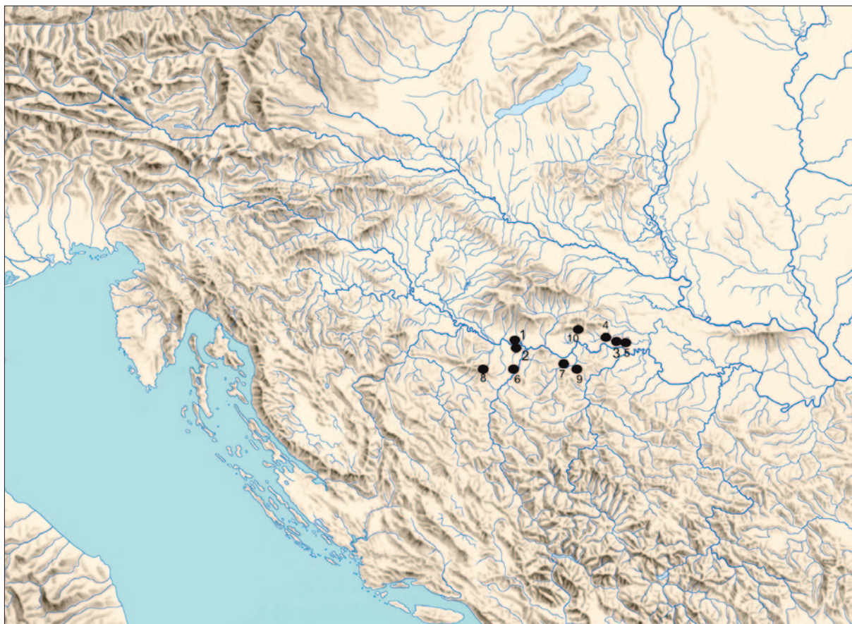
Sl. 6 Položaj Doline u slici naseljenosti srednje Posavine u mlađoj fazi kasnog bronzanog doba: 1 Dolina; 2 Donja Dolina; 3 Novigrad na Savi; 4 Stružani; 5 Jaruge; 6 Brdašca; 7 Vis; 8 Zemunica; 9 Vrela; 10 Završje (izradila: D. Ložnjak Dizdar)