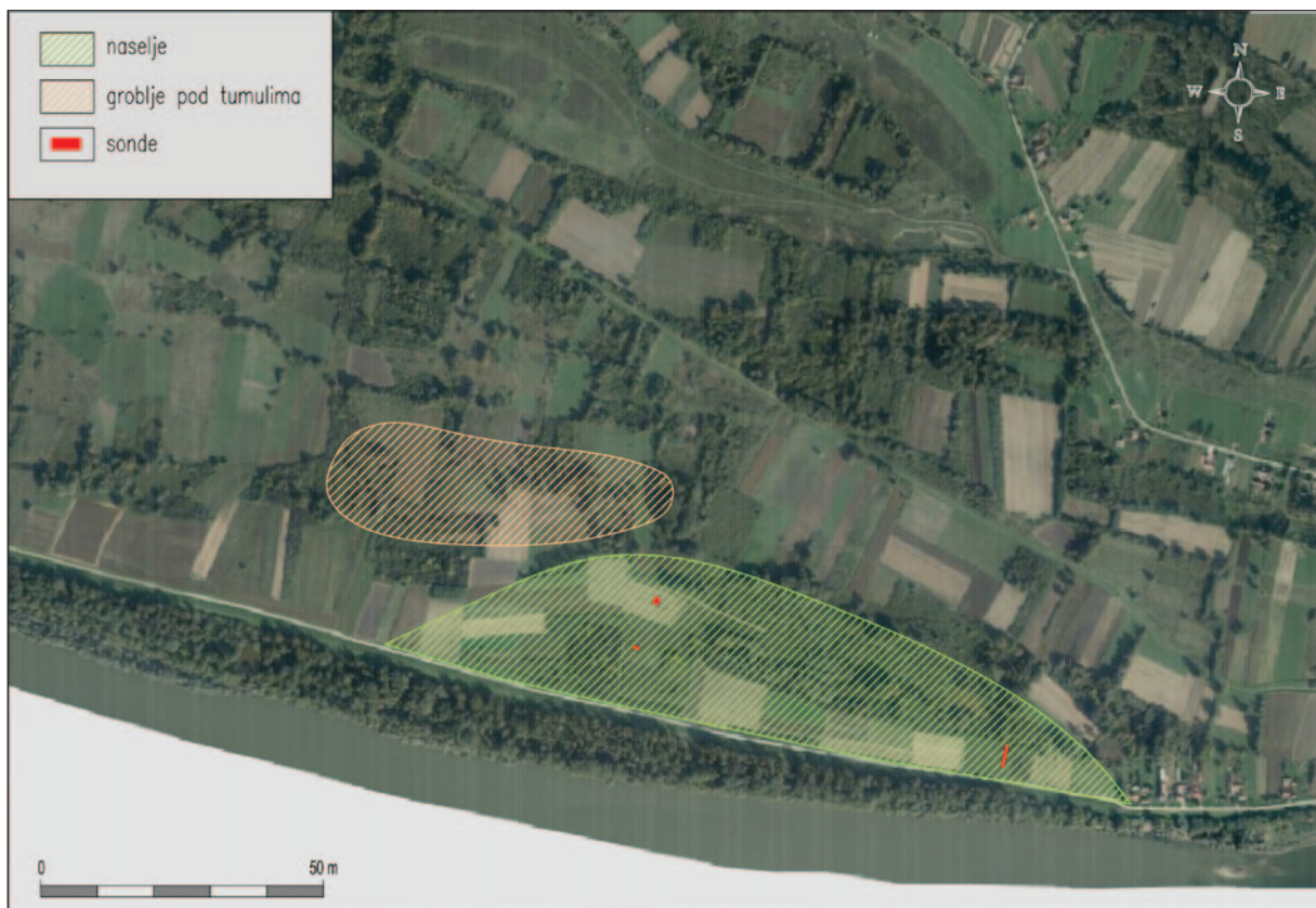
Sl. 1 Položaj naselja i groblja pod tumulima u Dolini (podloga: Geoportal Državne geodetske uprave, ortofoto 2017. i 2018., oznake: D. Ložnjak Dizdar)

Fig. 1 Location of settlement and cemetery under tumuli in Dolina (background: Geoportal of the State Geodetic Administration, orthophoto 2017 and 2018, marks by: D. Ložnjak Dizdar)