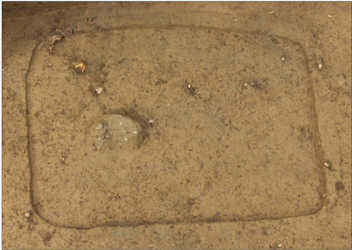
Sl. 2 Grob LT 127 Fig. 2 Grave LT 127