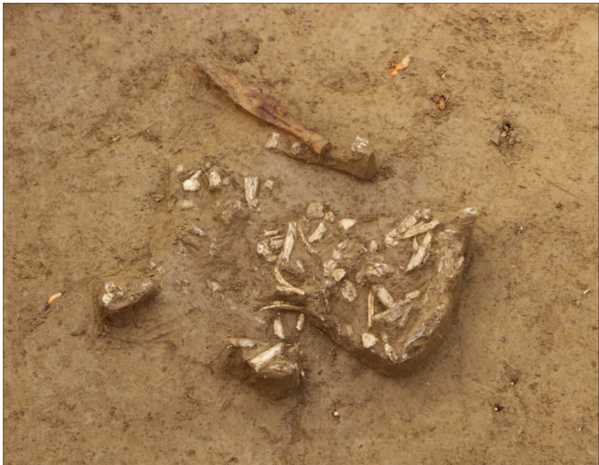
Sl. 3 Detalj groba LT 128 – pokop ratnika Fig. 3 Detail of grave LT 128 – burial of warrior