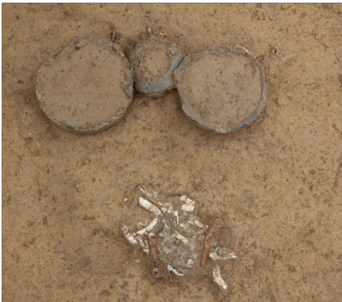
Sl. 5 Detalj groba LT 129 Fig. 5 Detail of grave LT 129