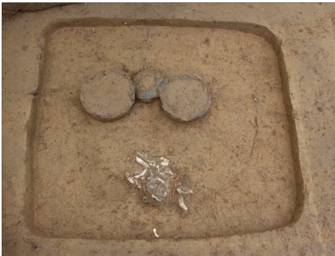
Sl. 4 Grob LT 129 Fig. 4 Grave LT 129