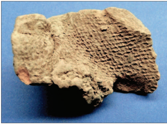
Sl. 13 Otisak tkanine na glini Fig. 13 Imprint of fabric on clay

i varira od 0,7 do 0,9 cm, a boje je crvenkasto narančaste, bež i tamnosmeđe. Keramika fature srednje do fino pročišćene gline, s minimalnim udjelom primjesa, ima relativno zaglađene i fine površine stjenki, debljine 0,4–0,7 cm, tamnosive, tamnosmeđe ili crne boje. Prema ulomcima oboda, dna i stjenki, radi se o posudama tipa zdjela i lonaca, oboda ravnih, lagano uvučenih ili lagano izvijenih prema van, blagoga bikoniteta i zaobljenoga tijela posude (sl. 14). Prema broju pronađenih ulomaka nogu, tip posude na visokoj nozi je sveprisutan u raznim varijantama (Šimić 2000: 225). Ukrasi su rjeđe prisutni, a izvedeni su tehnikama ubadanja i urezima ili tehnikom crvenoga oslikavanja te plastičnim trakama ispod oboda s otiscima prsta. Većina keramičkoga materijala potječe iz kulturnih slojeva, rjeđe iz zapuna otpadnih jama. Na osnovi analogija tipološko-stilskih odlika može se govoriti