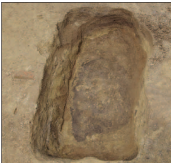
Sl. 8 Ukop jame u kvadrantu A nastale tijekom pljačke tumula s vidljivim nasipima tumula u rubovima

Fig. 7 The start of the 2017 excavations of tumulus 1 during the excavation of the humus layer