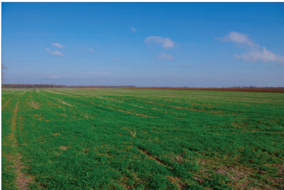
Sl. 5 Tumul 1 tijekom terenskoga pregleda 2012. godine

Fig. 4 The location of the site of Stari Jankovci – Jankovačka Dubrava/Stara Međa and the location of the tumulus (made by: H. Vulić)