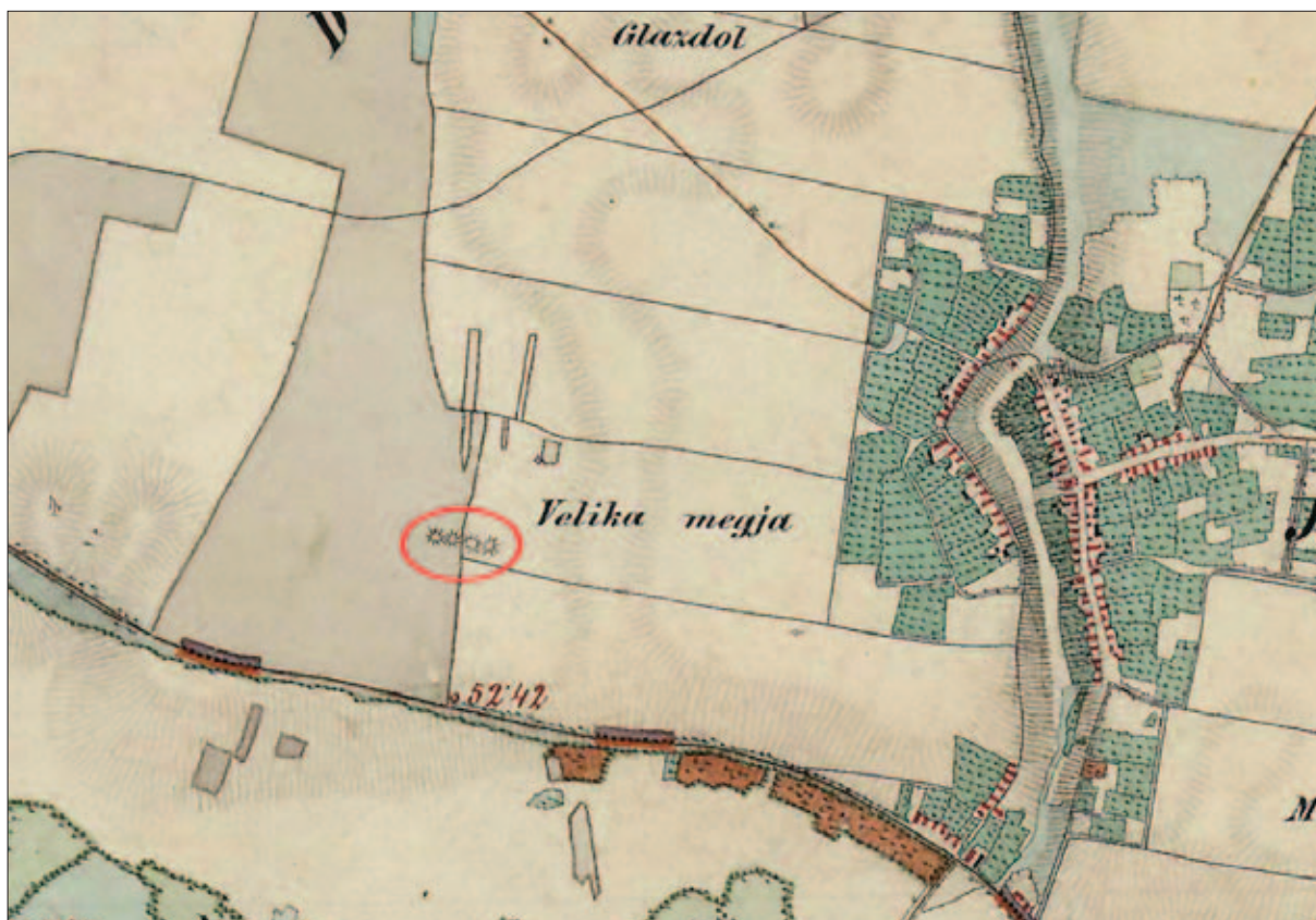
Sl. 2 Karta iz sredine 19. stoljeća s prikazana četiri tumula (izradio: H. Vulić)