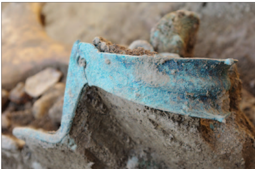
Sl. 17 Hackamore sjevernoga konja, tip Taylor 5/Ortisi III.B.2

Fig. 17 The backamore of the northern horse, type Taylor 5/Ortisi III.B.2