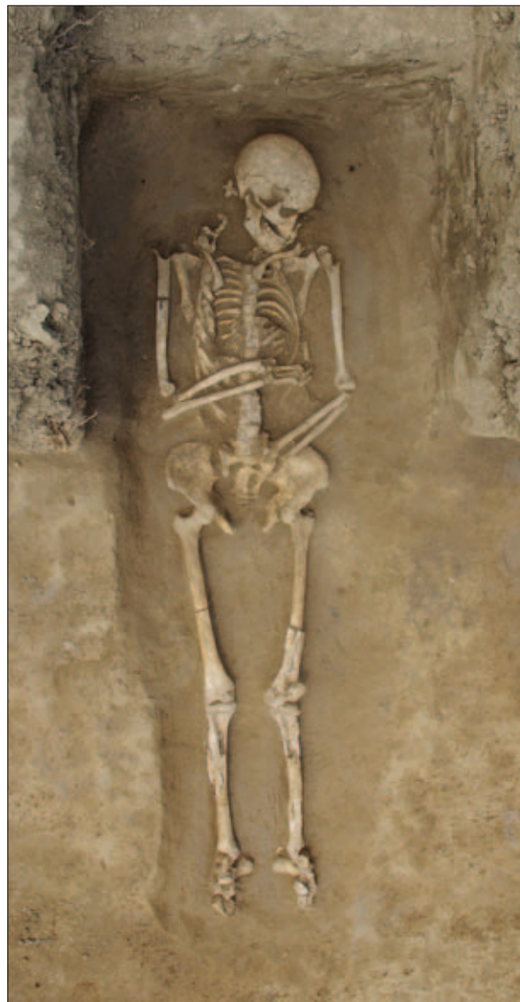
Sl. 10 Kasnoantički kosturni grob u kvadrantu C

U nastavku istraživanja poduzetom 2019. godine cilj je bio istražiti sjeverozapadnu od dvije velike strukture koje su vidljive na magnetometrijskoj snimci kao i središnji prostor tumula koji se počeo istraživati 2017. godine gdje su pronađeni i ostaci jednoga paljevinskog groba (sl. 13). Nakon iskopa najdonjega sloja nasipa tumula koji se sastojao od tamnosmeđe ilovače te polirana dosegnute razine na predzdravičnome sloju od smeđe ilovače, u kvadrantu A prepoznata je velika pravokutna zapuna pretpostavljene komore orijentacije sjeverozapad–jugoistok koja je odgovarala položaju strukture na ma-