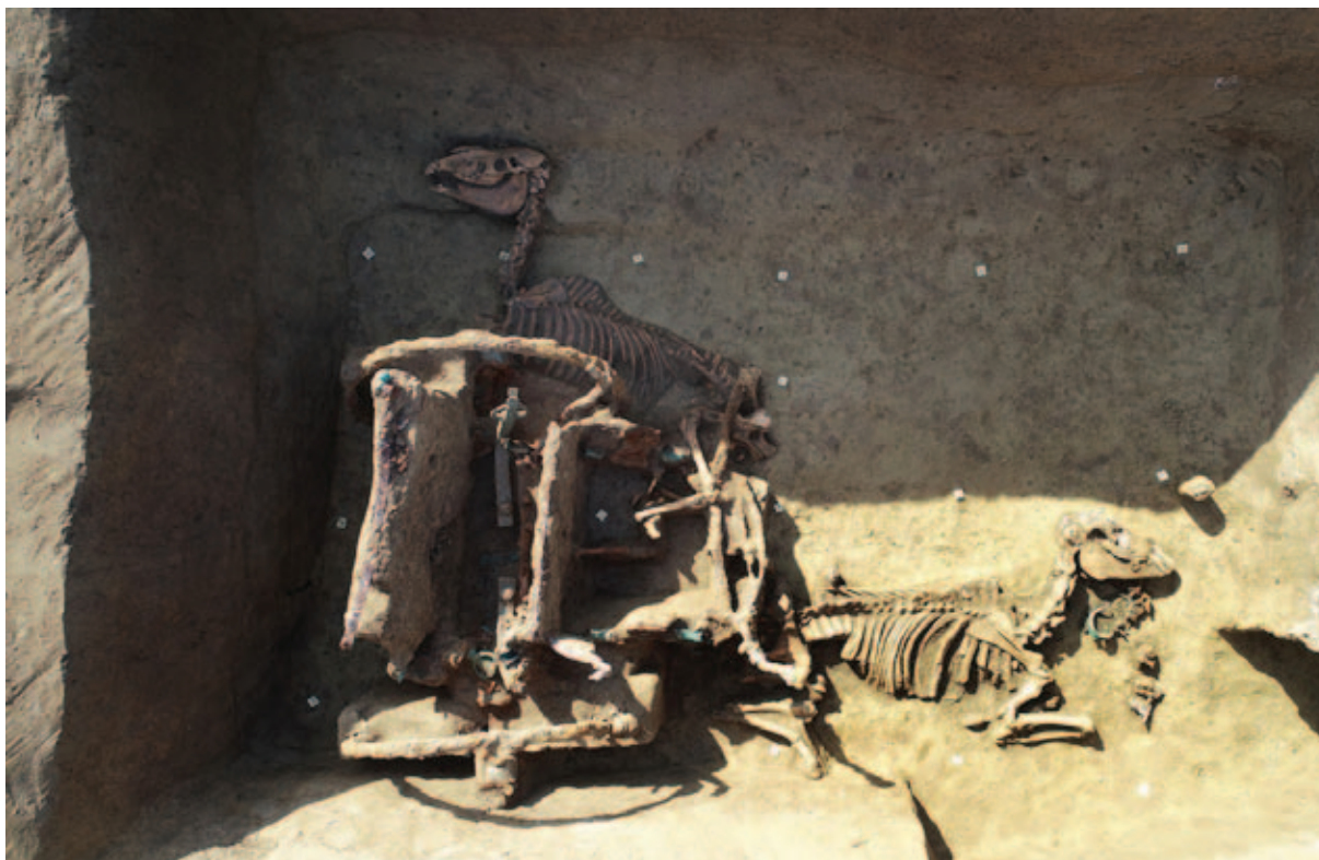
Sl. 16 Dvokolica i konji nakon čišćenja

Fig. 15 The two-wheel carriage with two horses viewed from the south-west