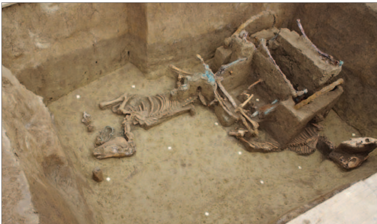
Sl. 15 Dvokolica s dva konja – pogled s jugozapadne strane

Fig. 15 The two-wheel carriage with two horses viewed from the south-west