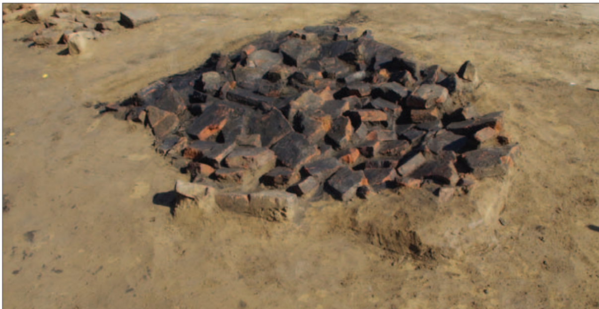
Sl. 9 Ostaci lomače od opeka

Fig. 9 The remains of a brick pyre