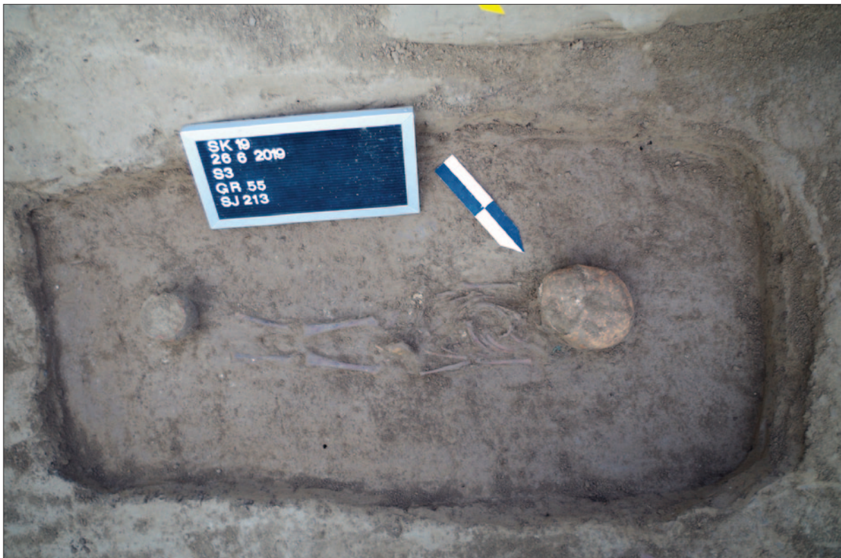
Sl. 3 Grob 55