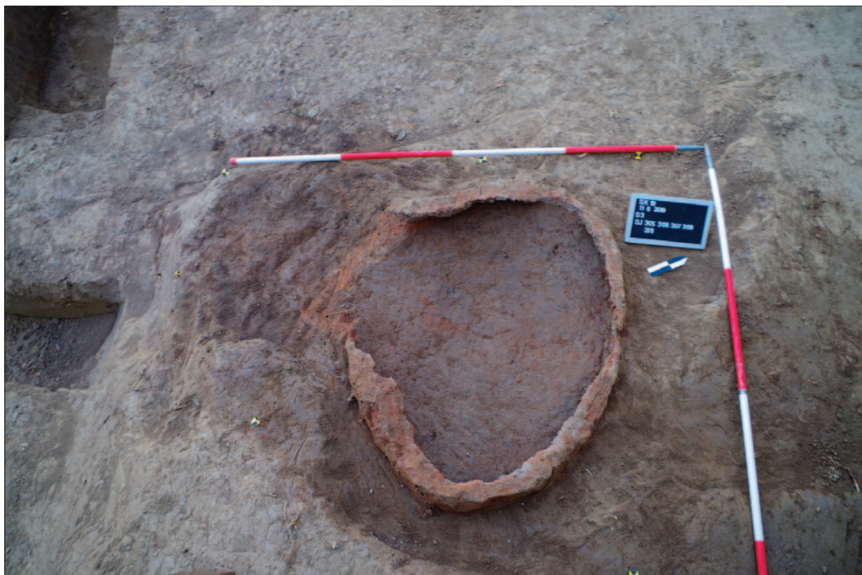
Sl. 10 Peć nakon čišćenja, SJ 306/308

Fig. 10 Kiln after cleaning, SU 306/308