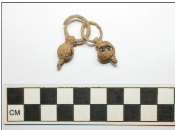
Sl. 5 Naušnica iz groba 55