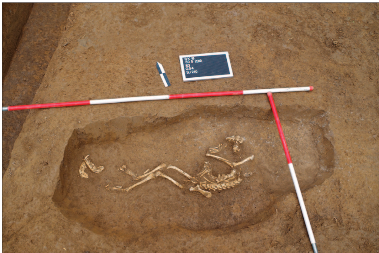
Sl. 2 Ukop psa – grob 54

Dječji grobovi su uglavnom sadržavali nakit koji se sastojao od brončanih naušnica sa staklenom pastom koje su datirane u kraj 6. i prvu polovicu 7. stoljeća. Najbliže usporedbe za ovu vrstu nalaza nalaze se u istraživanjima lokaliteta Čik u Bačkom Petrovom selu (Mikić Antolović 2016: sl. 21) te lokalitetu Aradac kod Zrenjanina u Ba-