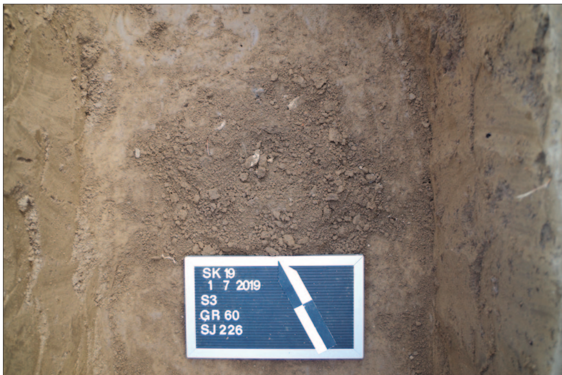
Sl. 7 Paljevinski ukop u grobnoj jami – grob 60