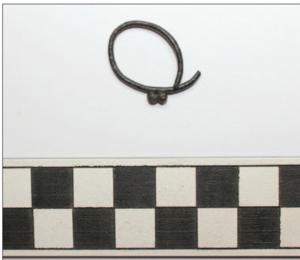
Sl. 8 Brončana naušnica iz paljevinskoga groba 56

Fig. 8 Bronze earring from cremation grave 56