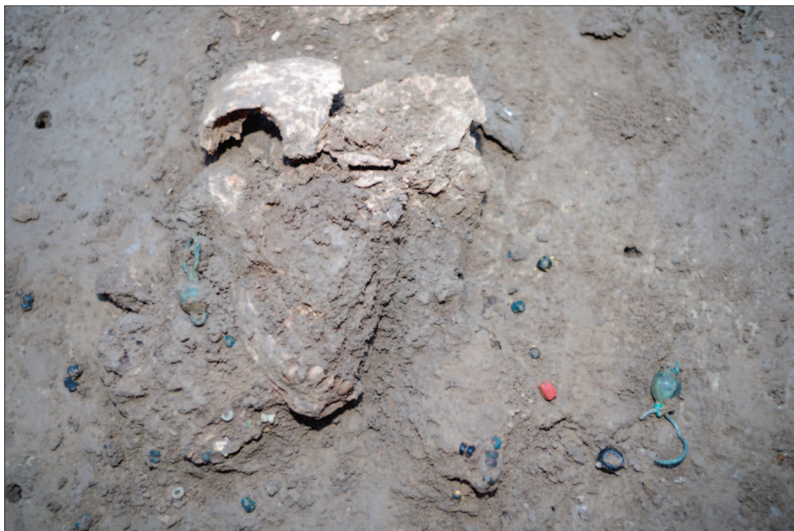
Sl. 6 Detalj dječjega groba 80, ogrlica i naušnice

Grobovi sa spaljenim pokojnicima otkriveni su u južnome i jugoistočnome dijelu istražne sonde. Ukupno je pronađeno sedam paljevinskih grobova, od čega su kod četiri groba spaljeni ostaci pokojnika bili položeni izravno u grobnu raku, dok su u preostala tri groba spaljene kosti bile položene u keramičke urne koje su zatim smještene u grobne rake. Jame su kružnoga ili nepravilnoga tlocrta, prosječne dužine 0,50 metara i širine 0,30 metara (sl. 7). Prilikom istraživanja uočene su određene pravilnosti u razmaku i rasporedu paljevinskih grobova međusobno, a otkriveni su na prosječnoj dubini od 0,50 m relativne