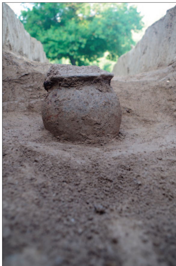
Sl. 9 Paljevinski ukop u urni i jami – grob 56

Fig. 9 Cremation burial in urn and pit – grave 56