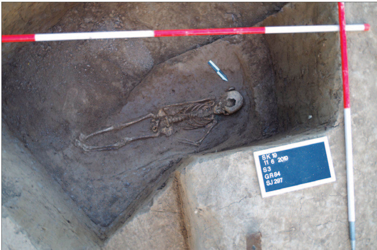
Sl. 4 Grob 84