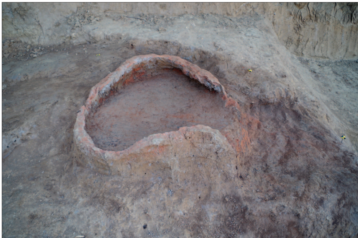
Sl. 11 Peć nakon čišćenja, SJ 305/306/307/308/318

Fig. 10 Kiln after cleaning, SU 306/308