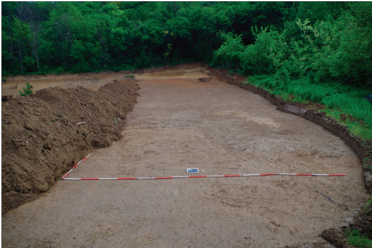
Sl. 1 Pogled na sondu III

Arheološkim istraživanjem 2019. godine evidentirane su dvije vrste pogrebnoga ritusa – kosturno pokopavanje te spaljivanje pokojnika. Ukupno je pronađen 21 grob koji su bili cjeloviti ili samo djelomično sačuvani. Grobne rake s kosturnim pokopima su pravokutnoga oblika. Orijentacija grobova je uglavnom sjeverozapad –