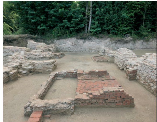
Sl. 4 Pogled s istoka na istražene zidane grobnice ZG 3 i 4 u četvrtom traveju lađe samostanske crkve

Exception amongst the examined graves in the nave of the monastery church is grave 071 (G 71, average h – 152.97