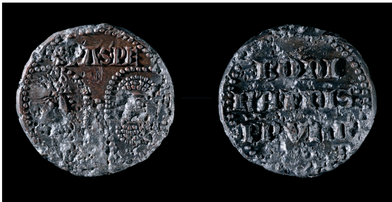
Sl. 7 Bulla plumbea pape Bonifacija IX. Fig. 7 Bulla plumbea of Pope Boniface IX

Dimenzije bule su 3,5x3,7 cm, težina je 48,9 g, a veličina slova 4 mm. Na vrhu i dnu bule jasno je sačuvana rupa širine 11 mm kroz koju je prolazila vrpca.