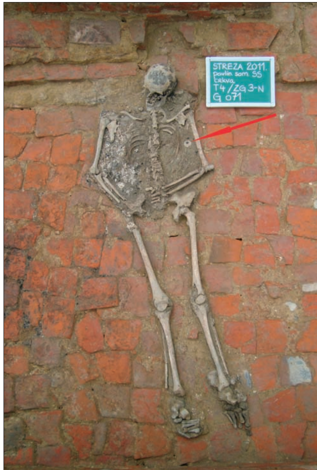
Sl. 3 Grob 071 s označenim položajem bule pape Benedikta IX.

Izuzetak među istraženim grobovima u lađi streške samostanske crkve jest grob 071 (G 71, prosječni h – 152,97