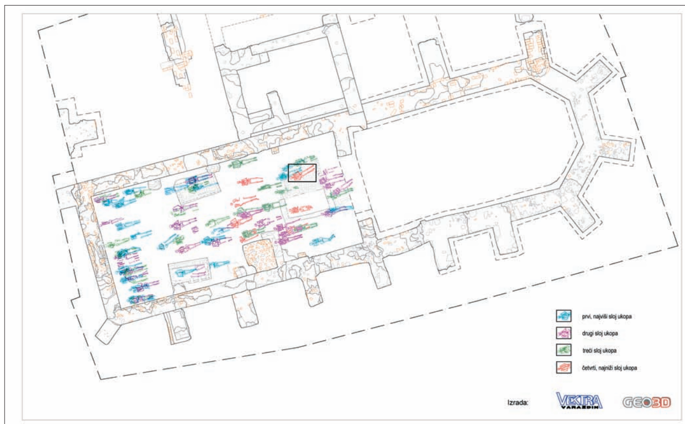
Sl. 2 Tlocrt samostanske crkve s označenim istraženim grobovima te istaknutim smještajem groba 071 (izrada: „Vektra d.o.o.” i HRZ, 2011.)