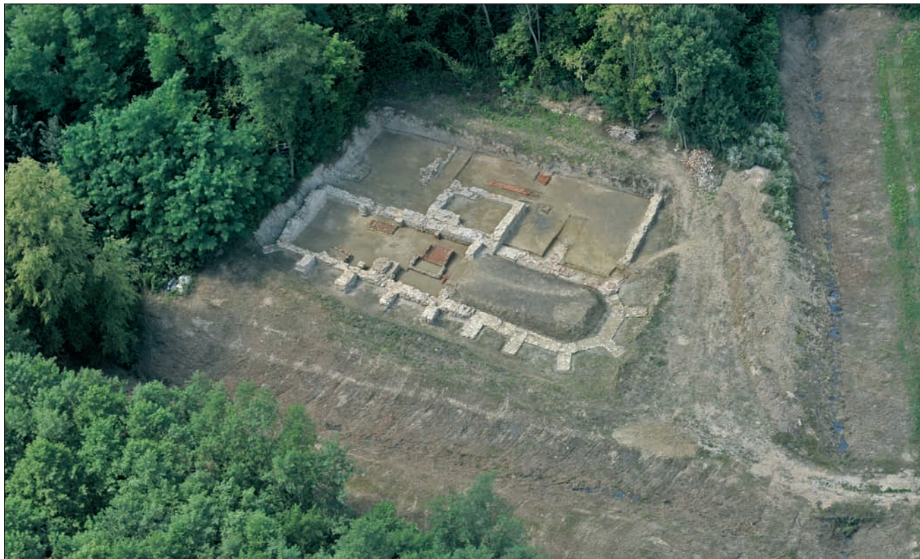
Sl. 1 Pogled na istraženi dio samostanskog sklopa Svih svetih u Strezi