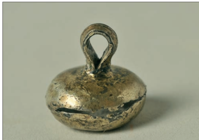
Sl. 6 Srebrno dugme pronađeno u grobu 071

Fig. 6 Silver button found in grave 071