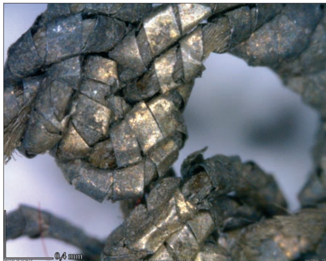
Sl. 5 Makro-snimak metalne čipke pronađene u grobu 071

Fig. 5 Macro-photo of the metal lace found in grave 071