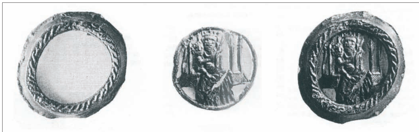
Sl. 3 Hodočasničke oznake sastoje se od dva dijela – okvira i oznake, koja u ovom slučaju prikazuje Mariju s djetetom Isusom u desnom naručju, 15. stoljeće (prema Mitchiner 1986: 265, br. 1027, približno 2 : 1)

From the depictions, it is clear that these pendants are associated with pilgrimages; however, with no inscriptions, it is difficult to establish the pilgrimage destinations they originate from. The portrayal of the Blessed Virgin Mary in a bell-shaped mantle is characteristic of all Marian pilgrimage destinations, but these depictions lack additional attributes whereby the localities of their provenance could be identified.