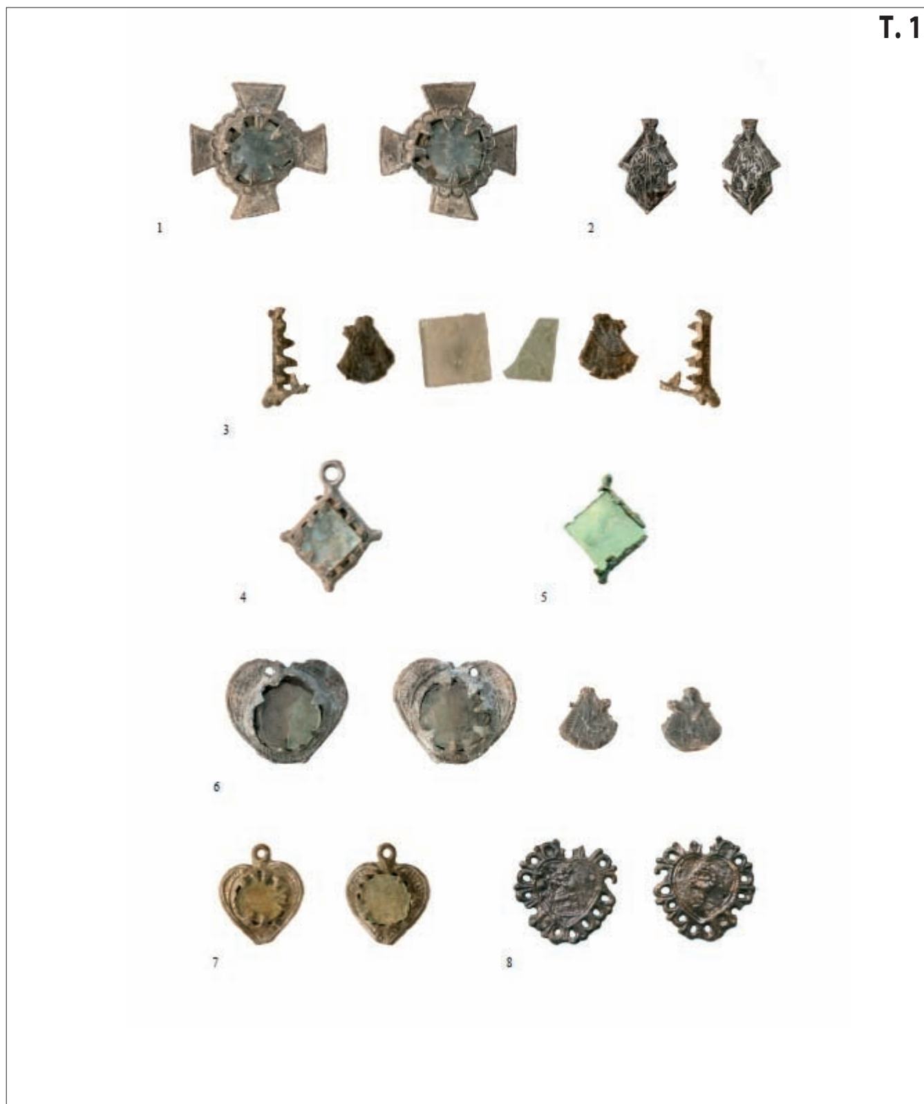
T. 1 Hodočasnici privjesci (izradile: D. Vukičević i A. Azinović Bebek) Pl. 1 Pilgrim pendants (prepared by: D.Vukičević and A. Azinović Bebek)