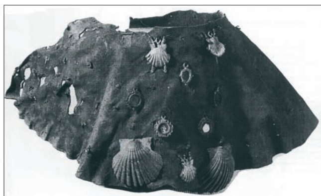
Sl. 2 Hodočasnički plašt s kasnosrednjovjekovnog groblja u Lourdesu (prema Mitchiner 1986: 7)