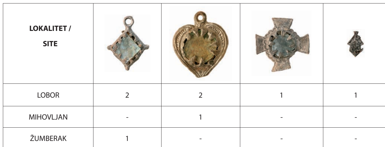
Tab. 1 Oblici hodočasničkih privjesaka (A. Azinović Bebek) Tab. 1 Pilgrim pendant forms (prepared by: A. Azinović Bebek)

su prikazi Majke Božje u zvonolikom plaštu s djetetom Isusom u naručju. Figura sv. Ivana Nepomuka najbližnja je hodočasničkim oznakama iz 15. i 16. stoljeća. Figure hodočasničke Majke Božje ne mogu se sa sigurnošću identificirati. Sa žezlom u ruci prikazuju se Marije iz Altöttinga i Einsiedlena, ali i Majka Božja Gorska. Hodočasnički privjesak T. 1: 7 nije bilo moguće otvoriti, ali je prepoznata figura Marije u zvonolikom plaštu s Isusom između dva stakla učvršćena trokutastim držačima. Privjesak je u obliku srca, od kositra, površina je ukrašena urezima i točkama. Ostale tri figure Marije su i nacrtane: 17