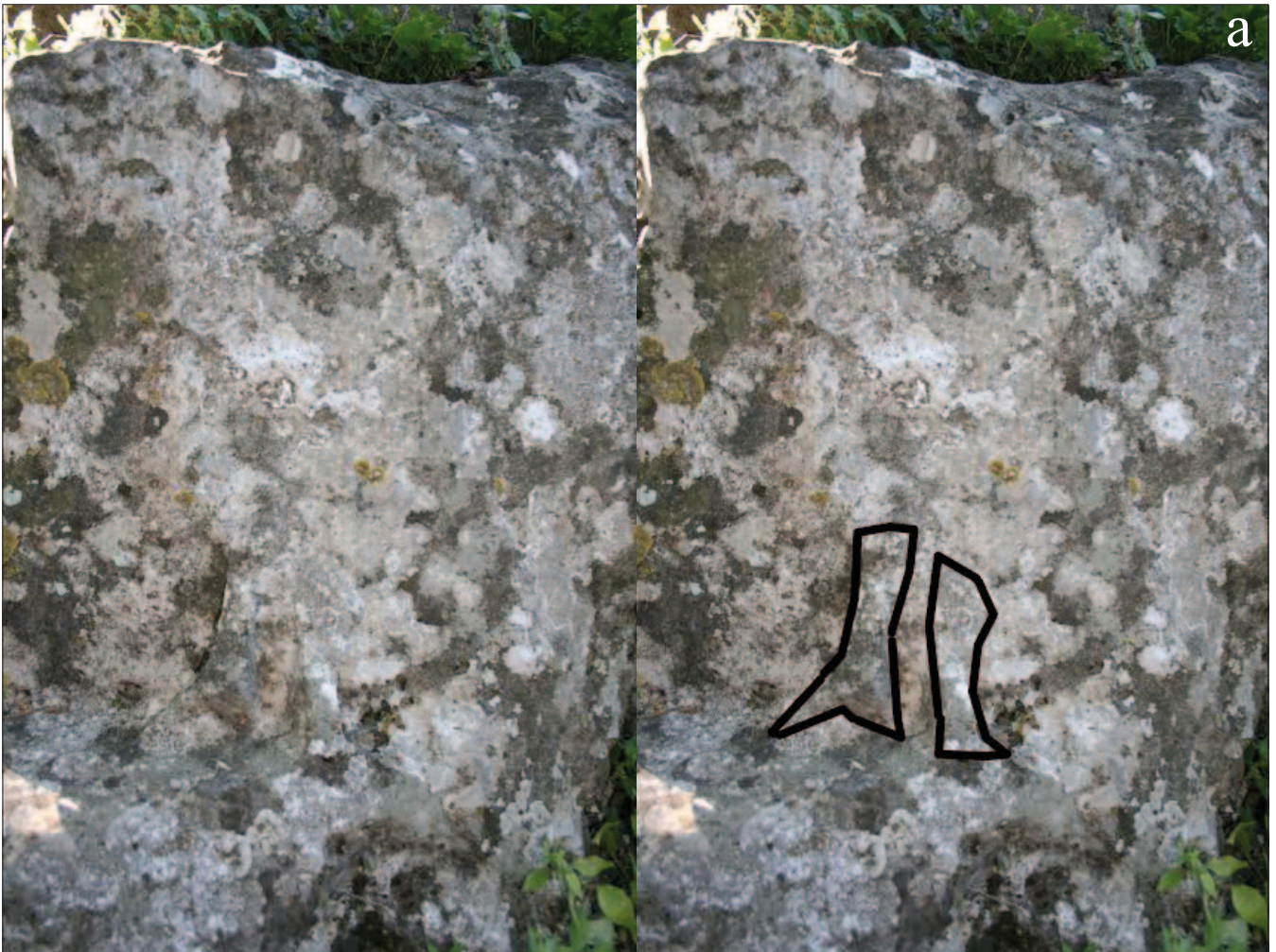
Sl. 2 i 2a Reljef s prikazom Silvana, Močići Fig. 2 and 2a Relief depicting Silvanus, Močići

Silvana, nedvojbeno upućujući na postojanje srodstva između dviju susjednih populacija ( Liburni i Delmatae ), barem kada je riječ o Silvanovu kultu.