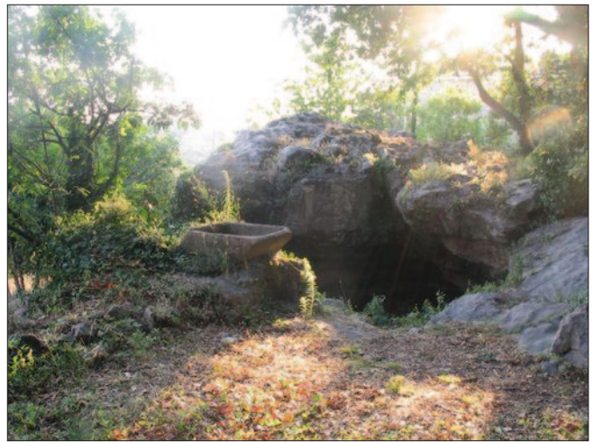
Sl. 4 Svetište Mitre i Silvana, Močići

Važno je naglasiti da je još nekoliko komada reljefa pronađeno na istom nalazištu Putovići Ograja, koji također