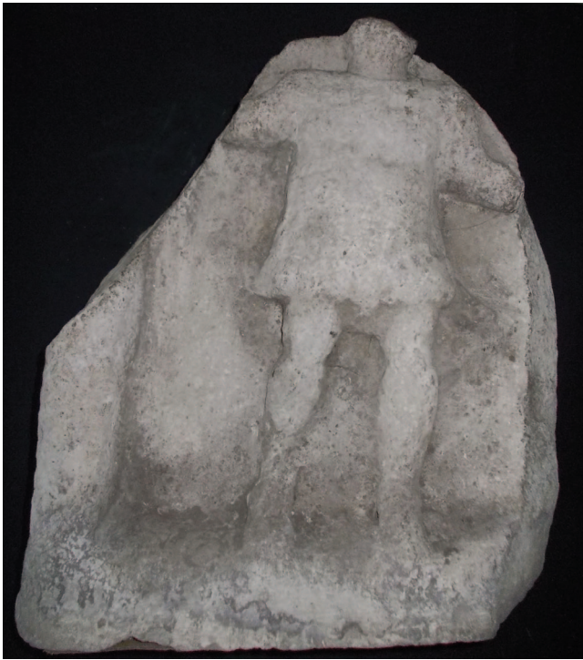
Sl. 5 Reljef s prikazom Silvana pronađen u Ograji, Putovići Fig. 5 Relief depicting Silvanus, found in Ograji, Putovići

prikazuju Silvana i/ili Dijanu (sl. 5–7). Ovi drugi ulomci spomenika s prikazom bogova s istog nalazišta prikazuju nam boga kojeg smo vidjeli na većini spomenika iz Dalmacije. Na osnovi te činjenice, sasvim je opravdano pretpostaviti da je ovo nalazište bilo Silvanovo (i Dijanino) svetište.