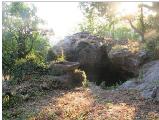
Sl. 4 Svetište Mitre i Silvana, Močići

Važno je naglasiti da je još nekoliko komada reljefa pronađeno na istom nalazištu Putovići Ograja, koji također