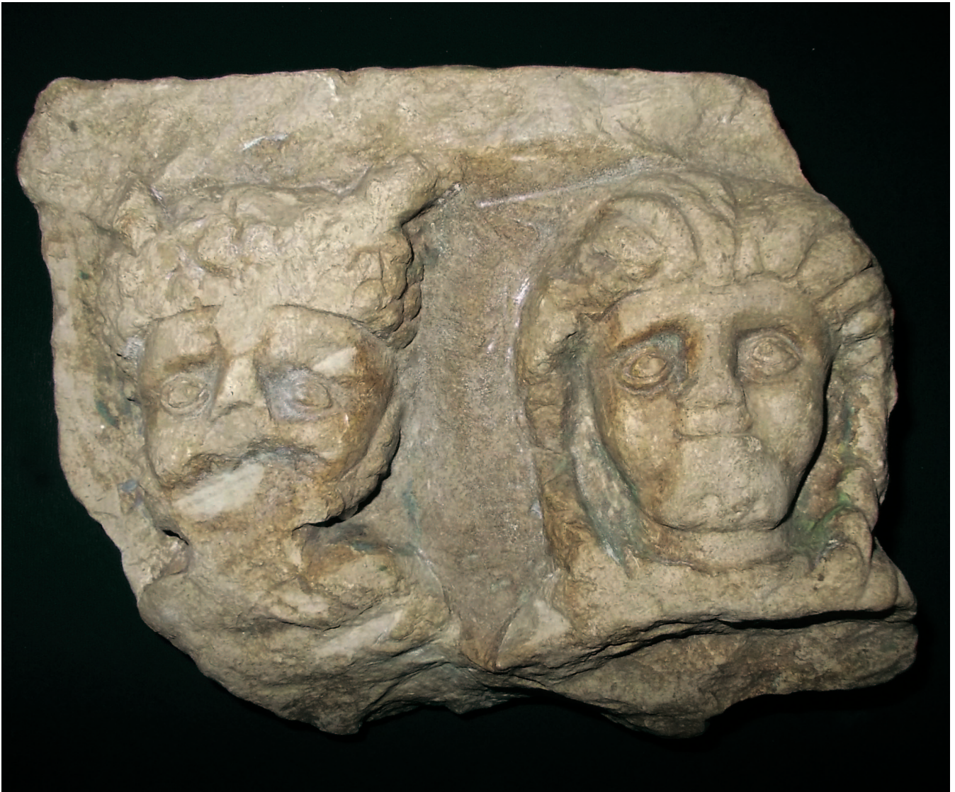
Sl. 3 Reljef s prikazom Silvana i Dijane, Zenica Fig. 3 Relief depicting Silvanus and Diana, Zenica

Pojednostavljenje oblika dovelo je do dominacije velikih, okruglih očiju kojima su pridodani plastično izbočeni profil i lice. S obzirom na glavne značajke spomenika, naglašene u ukočenom izrazu lica i jednako ukočenom pogledu moguće je pomaknuti datiranje reljefa do u rano 4. stoljeće.