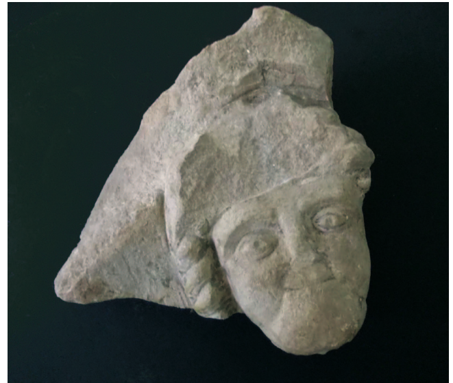
Sl. 6 Reljef s prikazom Dijane pronađen u Ograji, Putovići Fig. 6 Relief depicting Silvanus, found in Ograji, Putovići

Za kraj ove rasprave možemo zaključiti da smo kroz tekst vidjeli tri različite razine sinkretizma (prihvatimo li predloženo tumačenje zeničkog spomenika), i to u tri, kako se čini, donekle različita tipa svetišta. Vrlo je opravdano zaključiti kako spajanje ovih elemenata nije bilo rezultat kolektivne kognitivne promjene nego prije svega osobne. Ponekad nas mogu zvesti naše tradicionalne pretpostavke o pojavnim oblicima pojedinih kultova. Prema riječima S. Pricea, navikli