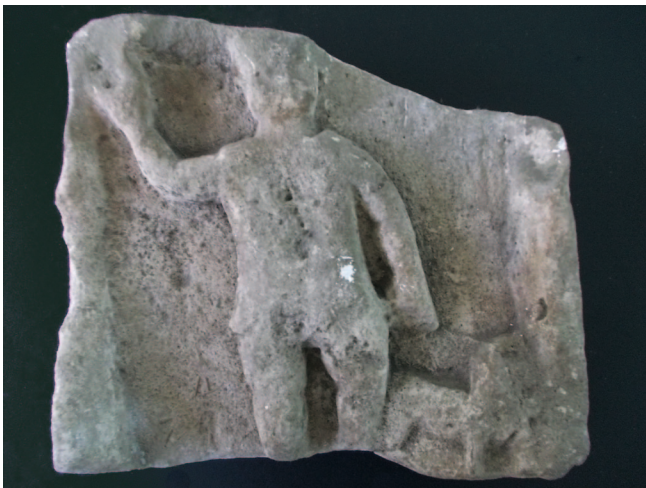
Sl. 7 Reljef s prikazom Silvana pronađen u Ograji, Putovići